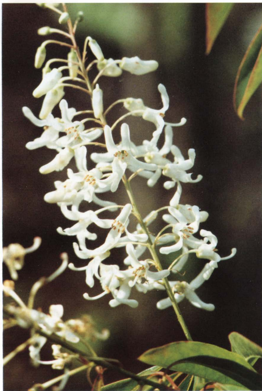
Fig. 4. Nærbillede af blomsterstanden og blomsterne med de karakteristiske frie kronblade og hvide blomsterstilke. Close up of racemes and flowers with the characteristic free petals and white pedicels.