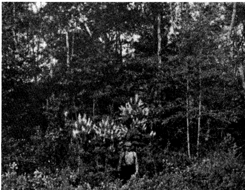
Fig. 5. Elliottia racemosa i en naturlig bevoksning i Bullock County i Øst-Georgia.

ligt, at en sjælden, genopdaget plante har kunnet bevares. Nu må man blot håbe, at de resterende arealer med Elliottia , der i 1958 er foreslået beskyttet som naturreservater, kan bevares intakte for fremtiden.