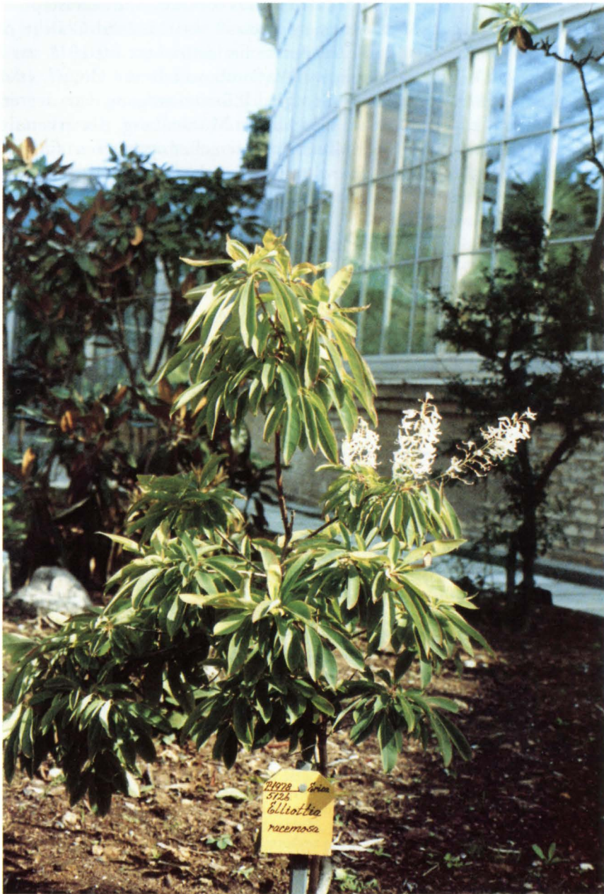
Fig. 1. Elliottia racemosa med 4 blomsterstande i begyndelsen af september 1985 i Botanisk Have, København.

Elliottia racemosa with 4 racemes in the beginning of September 1985 in the Botanical Garden, Copenhagen.