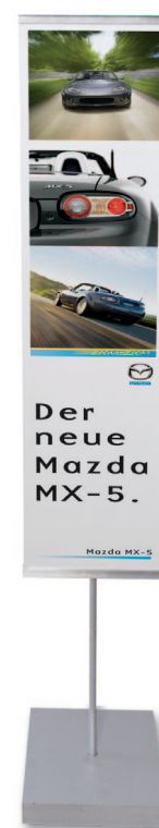
Banner mit OKI Bannerhalter

Ein Beweis dafür ist unsere einzigartige Template Manager Software, mit der Sie schnell und einfach viele verschiedene beeindruckende Dokumente erstellen können. Ein weiterer Beweis sind die kostenlosen Netzwerk-Hilfsprogramme für Druckmanagement und -kontrolle. Ebenso wie „Ask OKI“, eine Schaltfläche im Treiber Ihres Druckers, mit der Sie zu einer genau auf den C9600 zugeschnittenen Website mit unzähligen Informationen gelangen. Damit können Sie das Maximum aus Ihrem Drucker herausholen. Und nicht zuletzt ist ein Beweis dafür das informative grafische Displayfeld, das jeden Schritt jederzeit für jeden Nutzer klar und einfach darstellt.