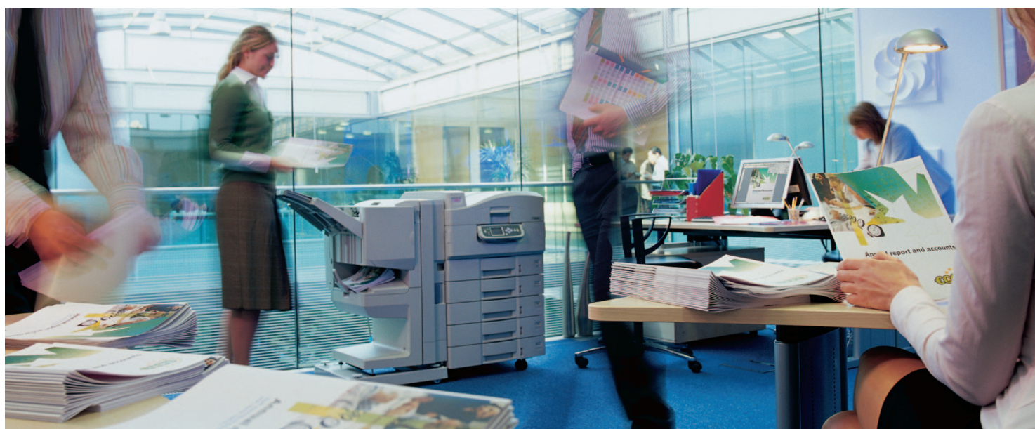
C9600 mit optionalem Finisher abgebildet