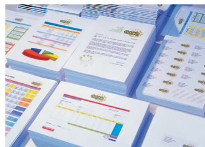
Druckmaterialien in hohen Auflagen