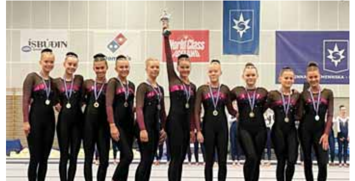
2. flokkur Umf. Selfoss.

Styrkleikar Krabbameinsfélags Íslands voru haldnir í annað sinn á Selfossi um liðna helgi. 500 einstaklingar skráðu þátttöku sína og gengu þeir samtals 23.677 hringi, eða tæplega 6000 kílómetra. Nánar má lesa um Styrkleikana á bls. 9.