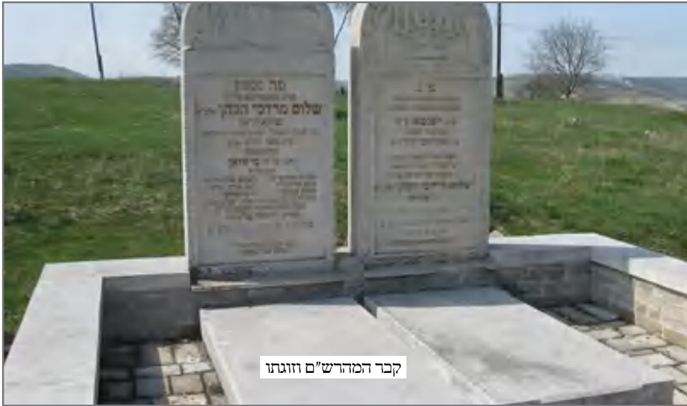
קבר המהרש"ם וזוגתו

וכאשר רצה להפרד ממנו ביקש שיספר לו היאך הוא בעולם העליון, אמר לו אף שאין מגלין דברים כאלו אף ליודעי ח"ן, אך למענך אעשה, ואספר לך כמה דברים. הנה תדע שבעולם העליון יש ישיבות וחדרים וקבוצות כמו בעוה"ז, וכל חבורה יש לה חדר מיוחד. הקדושים יושבים בקתדראות יפים עד ל מאוד, אשר עין לא ראתה ולומדים קבלה, הגדולים בעלי הוראה גם המה יושבים בחדרים מיוחדים על תכתקי זהב משובצים באבנים טובות ולומדים פוסקים, וכל חבורה וחבורה יש חדרים מיוחדים ואינם רואים זה את זה ואינם מתערבים זה עם זה, רק כל אחד בחדרו המיוחד נהנים מזיו השכינה, וא"א לתאר גודל התענוג מכל אחד ואחד.