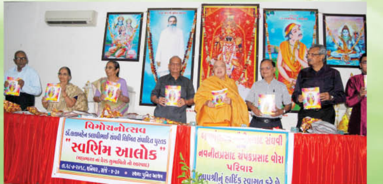
શ્રી બૃહદ્ ગુજરાત સંસ્કૃત પરિષદના પ્રકાશન "સ્વર્ણિમ આલોક"નું વિમોચન (તા. ૨૮-૭-૨૦૧૮) મણિનગર, અમદાવાદ