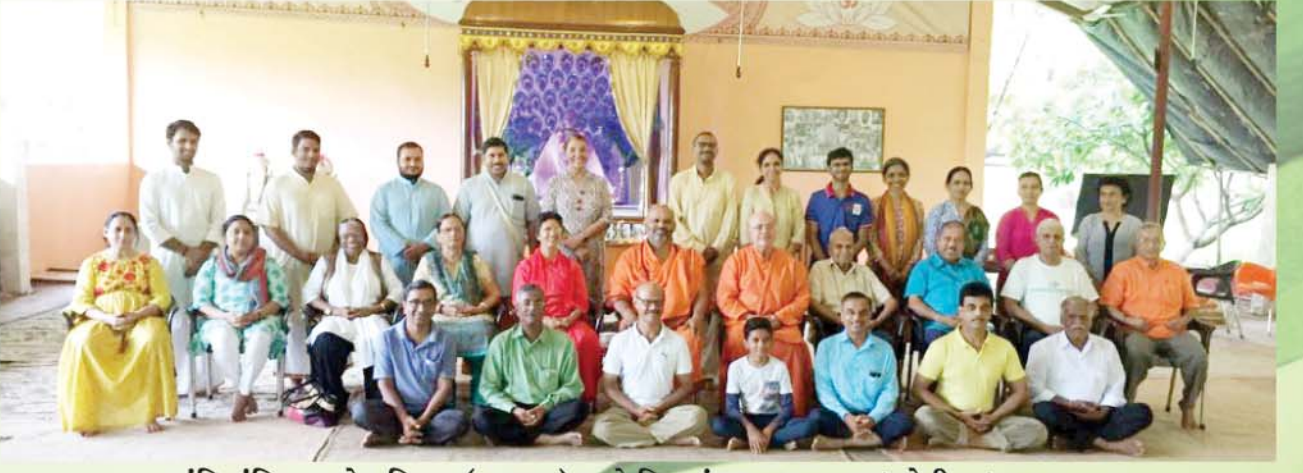
શાંતિ મંદિર, મગોદ-તિથલ (વલસાડ) ખાતે શિવાનંદ આશ્રમના સાધકોની અધ્યાત્મયાત્રા (તા. ૧૫-૭-૨૦૧૮ થી તા. ૧૯-૭-૨૦૧૮)