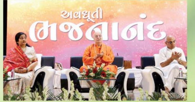
શ્રી રંગ અવધૂત મહારાજના પયાસમા પુણ્યતિથિ વર્ષે ભજન સંધ્યા - કલાકાર : 'પદ્મશ્રી' સુશ્રી અનુરાધા પૌડવાલ - (તા. ૨૧-૭-૨૦૧૮) મહેસાણા