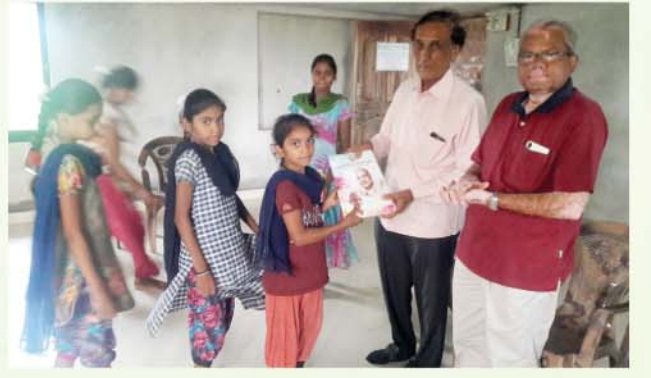
વાલિયા તાલુકામાં ગુજરાત દિવ્ય જીવન સંઘ દ્વારા શાળાનાં બાળકો માટે નોટબુકોનું વિતરણ (તા. ૮-૭-૨૦૧૮)