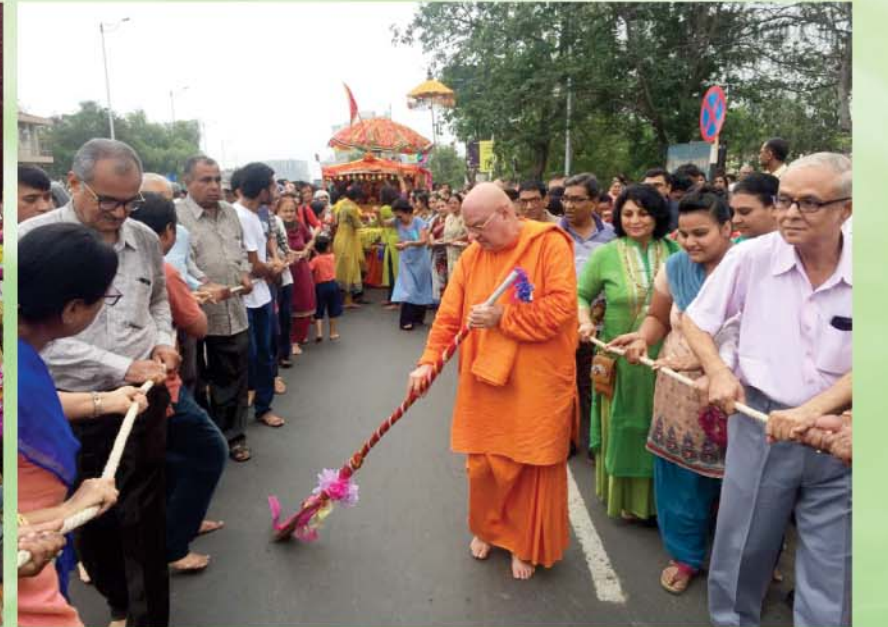
શિવાનંદ આશ્રમમાં શ્રી જગન્નાથ પ્રભુની રથયાત્રા (તા. ૧૪-૭-૨૦૧૮) અમદાવાદ