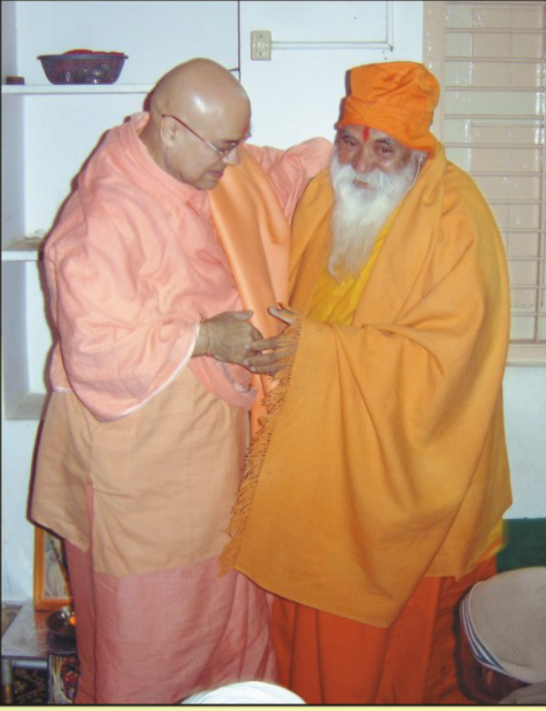
પૂજ્યશ્રી મોરારબાપુ - ખેરાળુ, મકરસંક્રાંતિ ૧૫-૧-૨૦૦૮