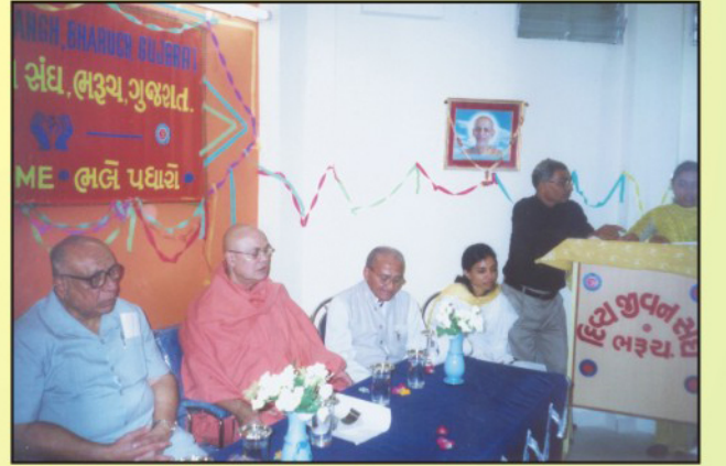
દિવ્ય જીવન સંઘ, ભરૂચ, શિવાનંદ હોસ્પિટલમાં કોન્ફરન્સ હોલ, વાચનાલય, યોગ મ્યુઝિયમ તથા I.C.C. સાધનોનો ઉદ્ઘાટન પ્રસંગ ૬-૧-૨૦૦૮