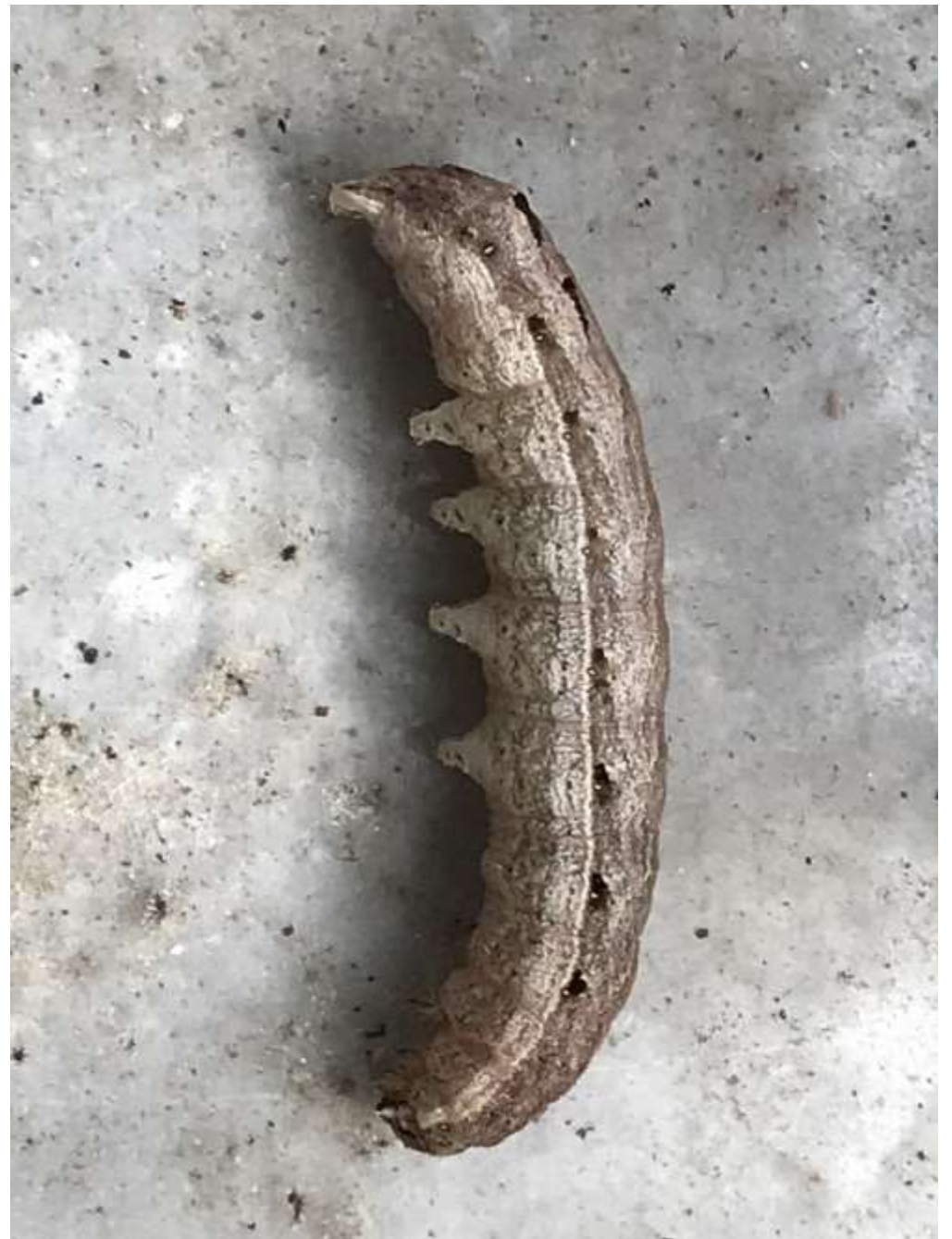
Das ist der Täter!