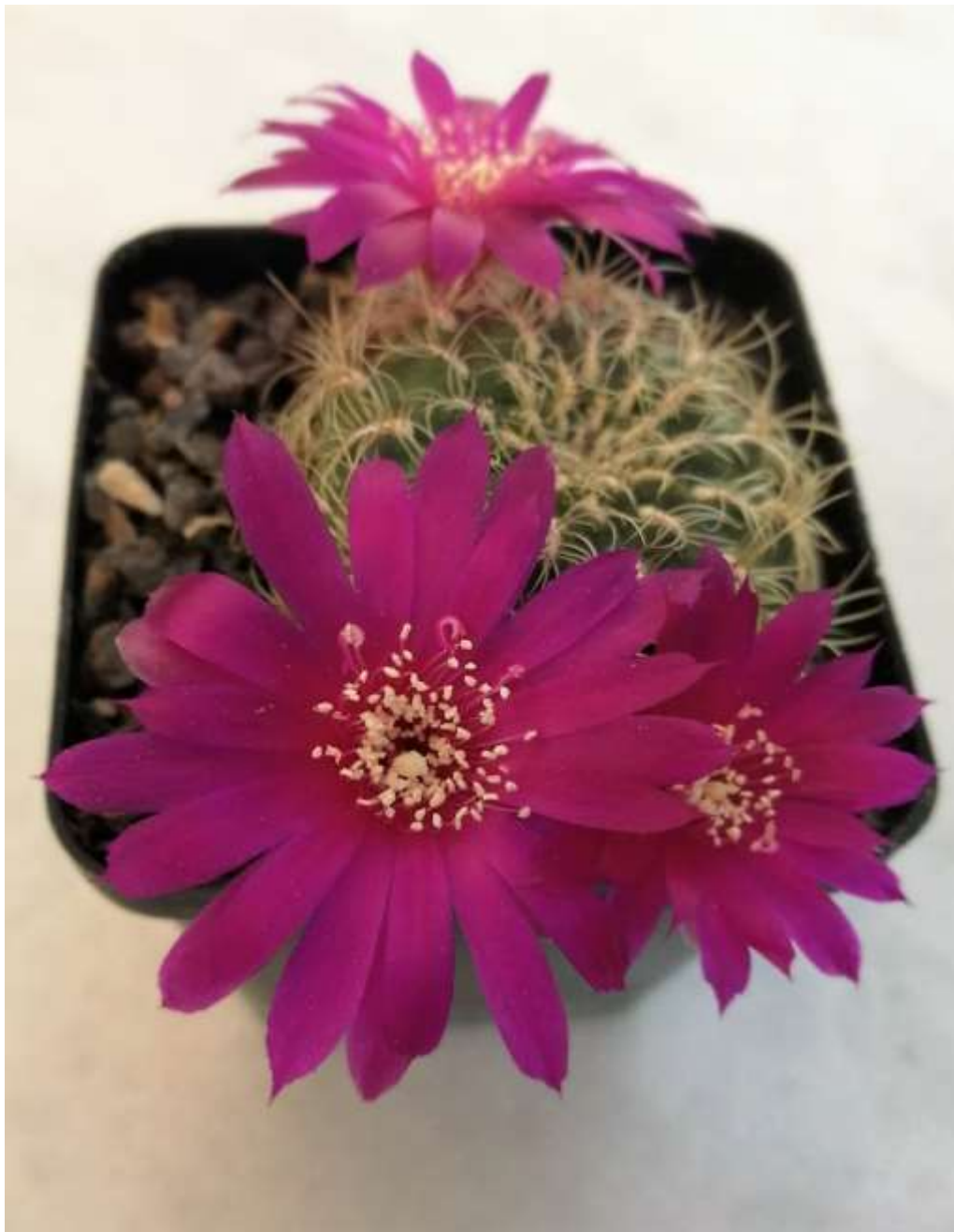
Sulcorebutia crispata HS 251