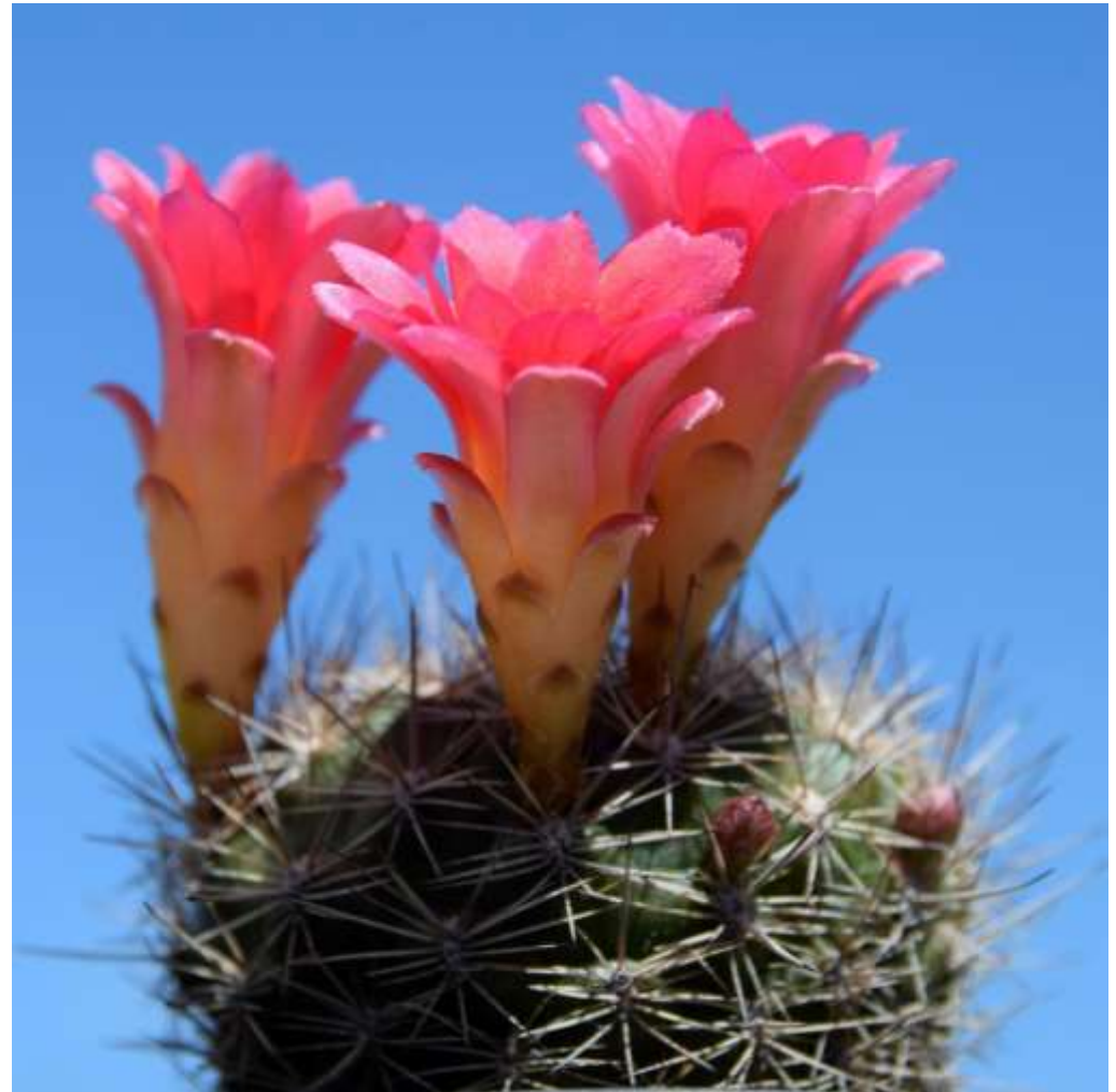
Weingartia neocumingii -Hybride

Diese von Backeberg benannte Pflanze erhält man auch unter vielen anderen Namen, wie jajoana , marsoneri oder auch chrysantha var. rubescens .