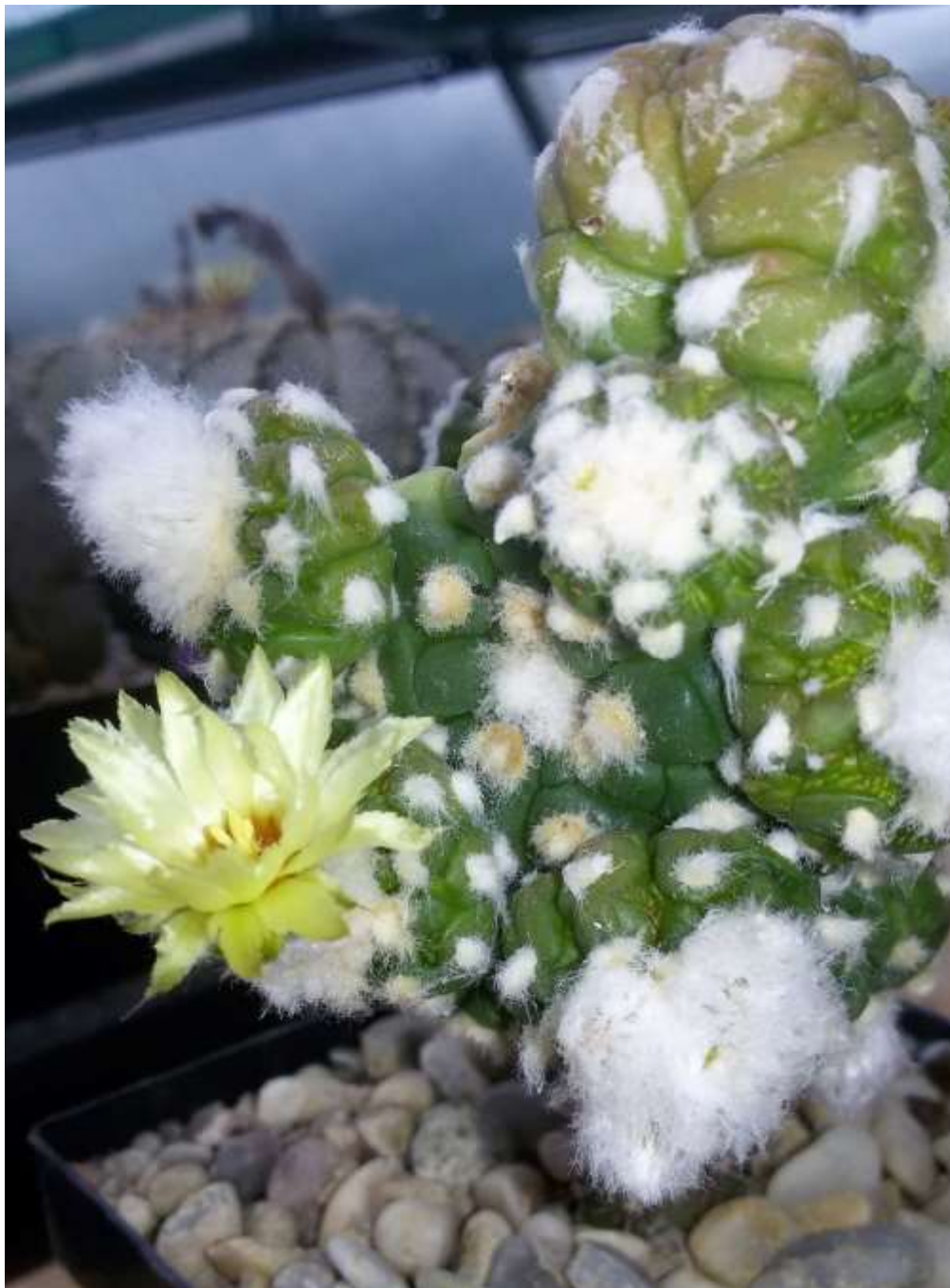
Astrophytum asterias cv. Kikku nudal forma monstrosa