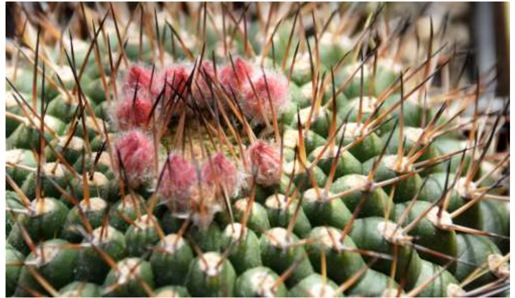
Knospen im Scheitel von Matucana formosa