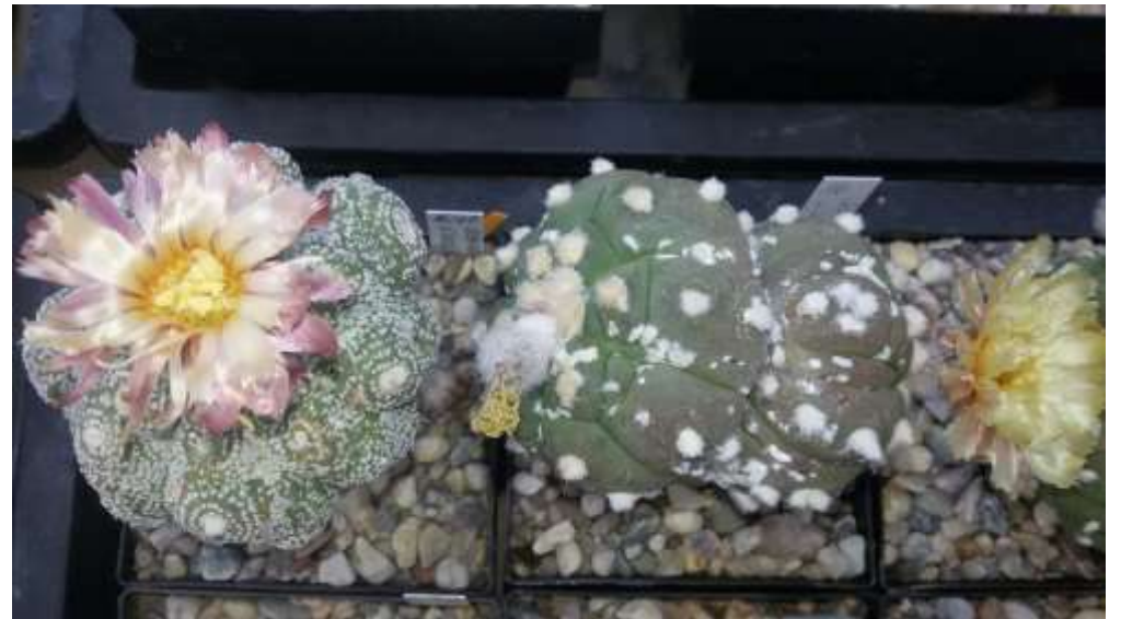
Astrophytum asterias cv. Kikku ( heißt Höcker )