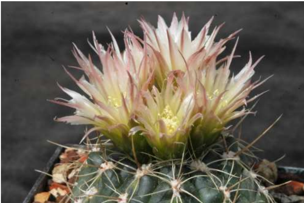
Gymnocalycium meragallii MM1200 Lutti

Die Pflanze bringt im Laufe des Jahres bis zu 7 solche Blütenschübe, die jeweils 8-12 Blüten haben. Die Zahl der Blüten vergrößerte sich in den letzten Jahren ständig mit dem Wachstum der Pflanze