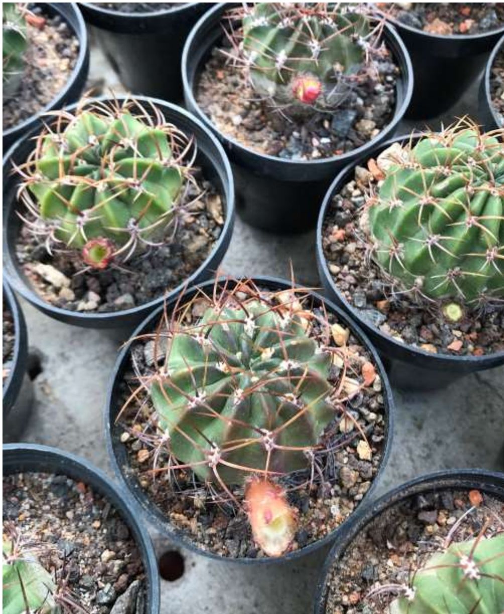
Lobivia maximiliana mit ausgefressenen Knospen