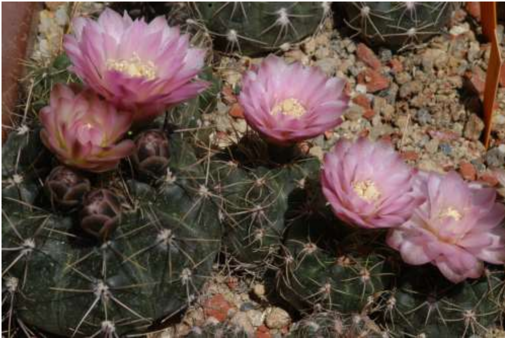
Gymnocalycium kulhanekii WP 442-859 Co. Uritotco