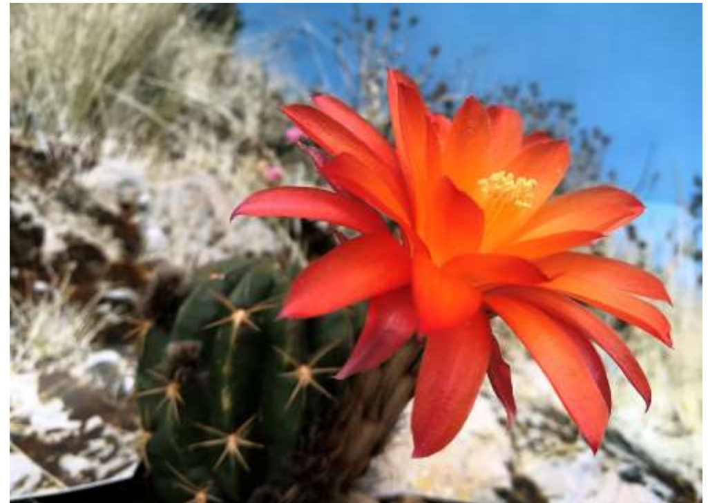
Lobivia tegleriana var. puquiensis