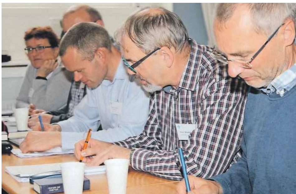
Der var valg til både LS, formand og næstformand, og der var genvalg på alle poster.

Pengene kommer i bund og grund fra de enkelte givere rundt omkring i afdelingerne, påpegede en. Han ønskede snarere, at folk gav af egen drift til landskassen. En anden mente, at bidraget var uheldigt, fordi det koster resurser at flytte pengene rundt. Han opfordrede til, at man kastede et blik på, hvordan pengene føres rundt i LM-systemet, så det bliver gjort så smidigt og billigt som muligt.