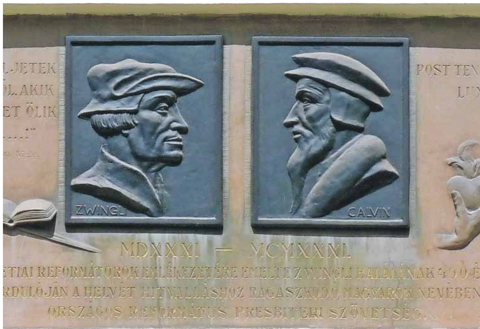
Forskellige protestantiske trosretninger udsprang af reformationen, ikke kun på grund af Luther, men også på grund af Zwingli og Calvin, som her ses på en mindetavle i Debrecen i Ungarn.

Helt galt går det, når man kalder baptistgrupperne på reformationstiden for reformerte. De skilte sig nemlig ud og distancerede sig fra såvel Zwingli, Calvin som Luther, forklarer han og tilføjer, at de alle tre havde alliancer med statsmagten og ønskede, at kirken skulle omfatte hele befolkningen. Det reagerede baptisterne imod, og de opfattede det som lige så galt afmarcheret som den katolske kirke. Luther og Zwingli støttede