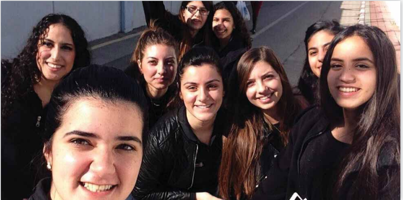
בנות השירות הלאומי בשירות בתי הסוהר

כ-60 בנות שירות לאומי משתלבות במגוון תפקידים בשירות בתי הסוהר אחרי שעוברות סיווג בטחוני, "לומדות כל יום לשנות סטיגמות"