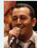
בנימין בוזגלו ותזמורתו