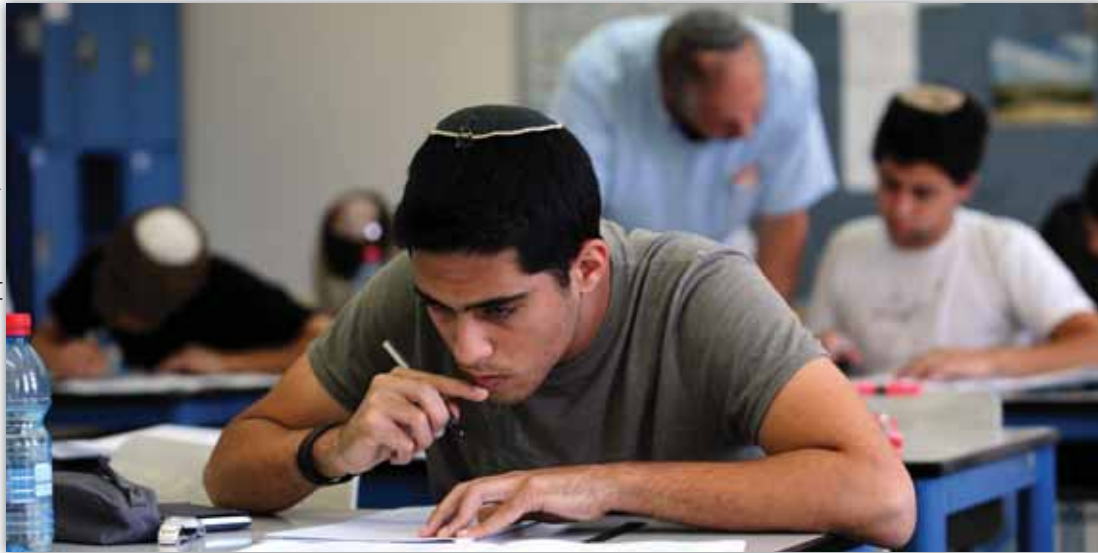
למחולמים אין קוטר לכתבה

מספר התושבים הדתיים בבירת השומרון הולך וגדל, אבל מענה חינוכי לנערים ולנערות לא נראה באופק • מספר הורים הקימו מטה מאבק ופנו לעירייה, אך לפי שעה נענו בשלילה