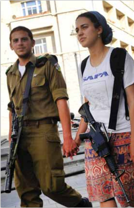
צילום: סרית אטאל, פלאש 90, למצלמות אין קשר לכתבה

◀ משרתי הקבע בצה"ל זוכים לתהילה ציבורית מורצדקת, ולא פעם עולה שאלת המחיר המשפחתי שהם משלמים למען ביטחון המדינה. מאחור נשכחות הרעיות שנותרות בבית, מגדלות את הילדים לבדן, נאלצות להתמודד בעצמן עם אתגרי החינוך ורואות את בעליהן אחת לשבועיים במקרה הטוב.