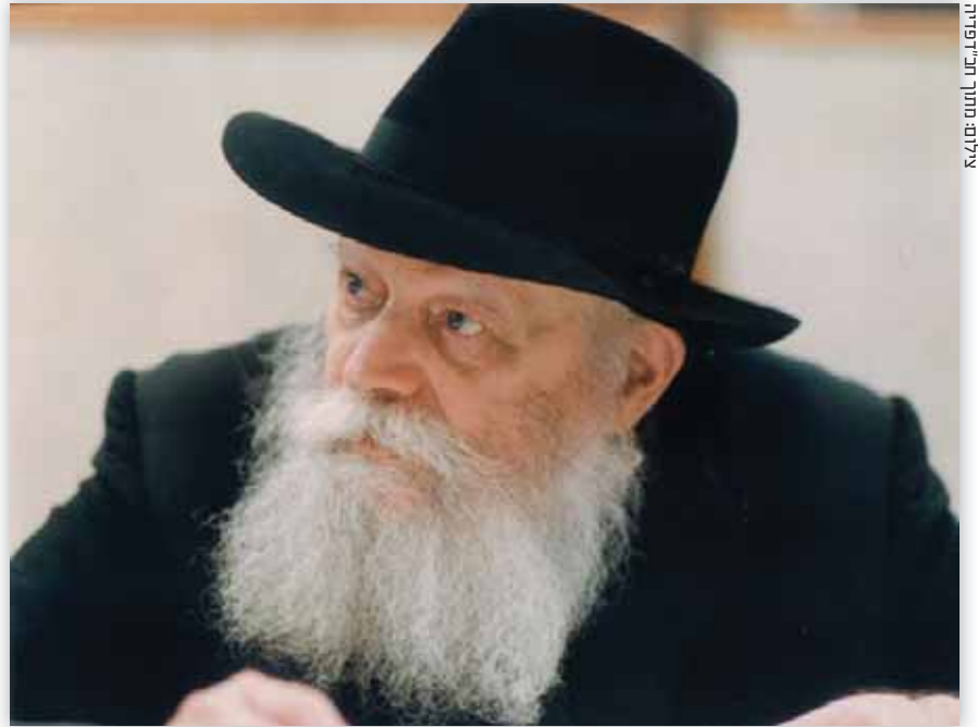
צילום: מתוך תיאור פרדיה

שלום ירושלמי, יוסי אליטוב, אריה ארליך הוצאת 'כנרת זמורה ביתן' / 476 עמ'