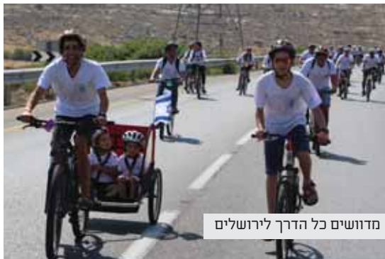
מדושים כל הדרך לירושלים