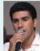
מייק קרוצי ותזמורתו