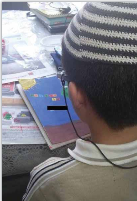
"אמרתי לו: תאמר להם שיש לך ארבע הורים, הכי כיף לך שבעולם"

רחל ואברהם, הורים לחמישה, פתחו את ביתם לילד בעל צרכים מיוחדים • "הילדים שלנו ישנים יחד עם ילד האומנה. אנחנו רוצים שירגיש חלק מהמשפחה", מספרת האם