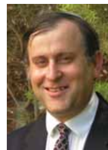
פרופ' אביעד הכהן

אין לנו כוונה לכפות על אדם כלשהו את שמירת השבת או לדחות תחרויות באופן גורף. הארגון שם לו למטרה לתת לספורטאים הזדמנות שווה להשתתף בתחרויות ארציות כשאר ספורטאי ישראל