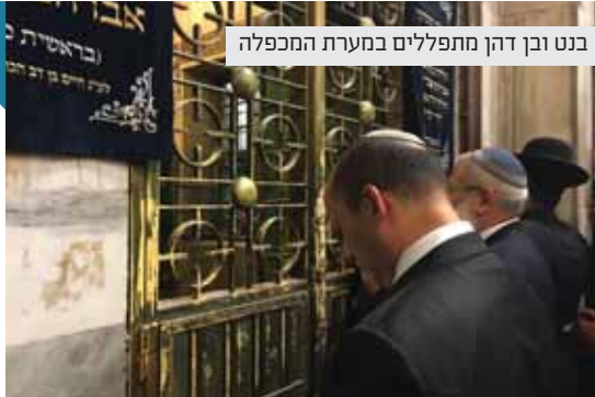
בנט ובן דהן מתפללים במערת המכפלה

בחברון, מול מערת המכפלה, חגגו בחמישי האחרון אלפים באירוע חגיגי לציון יובל לשהרור חברון. בראשית האירוע בירכו שר החינוך נפתלי בנט ושר התשתיות יובל שטייניץ, וכן סגני השרים חוטובלי ובן דהן. באירוע השתתפו רבנים, שרים, ח"כים, ראשי ומנהיגי ההתיישבות ותושבי חברון. "בימים האחרונים מדברים על חידוש התהליך. אנחנו בעד תהליכים, כל עוד התהליך מבוסס על שלום אמיתי שהוא שלמות ארץ ישראל ושלמות ירושלים. שלום אמיתי מבוסס על כבוד לעם היהודי בארץ ישראל והכרה בזכותו המלאה על הארץ", אמר השר בנט. בסוף הדברים השר בירך את המשפחות שחידשו את ההתיישבות היהודית ובמיוחד את הרב לוינגר ז"ל, שבזכותו הדבר קדם עור וגידים. "מכאן תצא העוצמה לקברניטי ישראל, שאנחנו נעמוד חזק ונזכור שארץ ישראל שלנו".