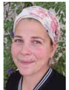
המודעות גדלה. ד"ר הרשושנים

"לומדים להעריך את בן הזוג ולשמוח בכל מפגש"