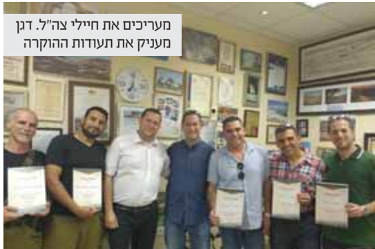
מעריכים את חיילי צה"ל. דגן מעניק את תעודות ההוקרה