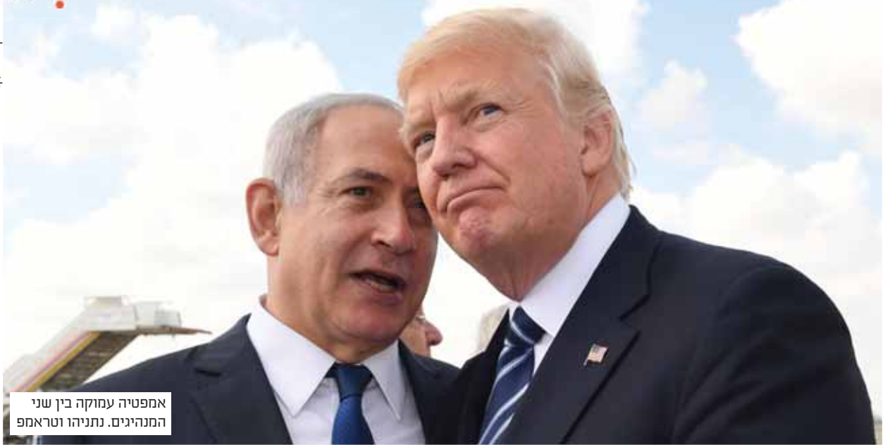
אמפטיה עמוקה בין שני המנהיגים. נתניהו וטראמפ