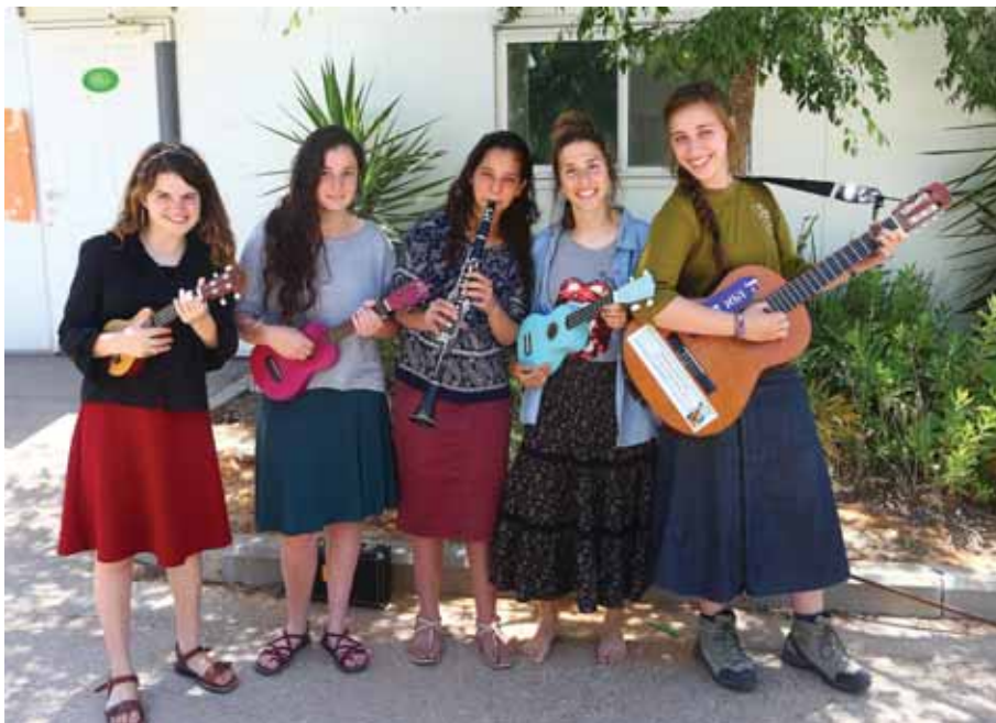
"הרבה דברים ישכחו אבל מי שתלמד לנגן, זה ישאר אצלה לתמיד". בנות אולפנת בני"ע נריה

ל-100%. כל אחת ואחת מהתלמידות בשתי השכבות האחרונות השלימה את לימודיה עם התעודה הנכספת, כולל כיתות החינוך המיוחד. "אני לא מהתלמידות החכמות", מספרת אחת הבנות שלומדות בכי' תה י"ב. "הייתי בכיתה קטנה בבית הספר, ועד כיתה ט' הציונים שלי נעו סביב 50. לא היה לי סיכוי לבגרות, ואז אחת המורות דחפה אותי בצורה רצינית. אף אחד לא ידע איך אעשה