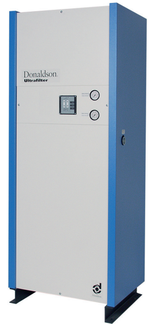
MSD 0005 - 0035 Tropical