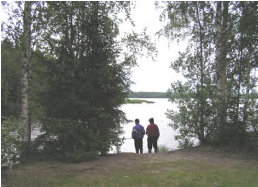
Kuva 9. Kalassa Inhottujärvellä Riuttan padon tienoilla.

Inhottujärven laskevan Karvianjoen yläosalla esiintyy luontainen purotaimenkanta ja Karvianjoessa tavataan myös luontaisesti lisääntyvää harjusta. Karvianjoessa on aiemmin esiintynyt myös rapua ja jokihelmisimpukkaa, mutta rutto on tuhonnut rapukannat. Jokihelmisimpukan tämän hetkisestä tilasta ei ole tarkempaa tietoa. Karvianjoella on tehty rapuistutuksia, mutta niistä ei ole saatu kovin hyviä kokemuksia (Mäkinie mi 2003). Karvianjoen latvaosissa luonnonvaraisena esiintyvä alkuperäinen purotaimenkanta pyritään säilyttämään. Alueen istutuksissa käytetään kannan sekoittumisen välttämiseksi Karvianjoen omaa kantaa olevia istukkaita. Kavokosken ja Pomarkun Kyläkosken välisellä alueella alkuperäisen taimenkannan esiintyminen on epävarmaa ja alueelle on tehty taimenistutuksia myös muilla kuin Karvianjoen kantaa olevilla taimenistukkailla. Satakunnan Kalatalouskeskuksen 1997 tekemässä purotaimenselvityksessä taimenia ei saatu sähkökalastuskohteena olleesta Kynäskoskesta. Sen sijaan Kynäskoskessa esiintyy kohtalaisen hyvä luontainen harjuskanta. Yleisesti ottaen kalakanta on runsas, mutta lajisto vähäinen. (Pirkanmaan ympäristökeskus 2004.) Kalakantoja hoidetaan istutuksilla ja Karvianjokeen istutetaan vuosittain harjuksen ja purotaimenen poikasia, pyyntikokoisia kirjolohia ja järvitaimenia. Muita istukaslajeja ovat olleet hauki, säyne ja toutain. (Mäkinie mi 2003.)