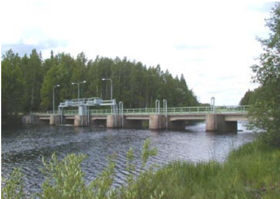
Kuva 10. Riuttansalmen pato.

Oravajoen pato on varustettu pelkästään avattavilla luukuilla, joista nykyään käytetään lähinnä kahta kahden muun ollessa tarvittaessa avattavissa. Tampereen vesipiirin vesitoimiston tekemässä säännöstelyn muutossuunnitelmassa (1985) ei ole kerrottu hankkeen tason ja N_{60} -tason välistä korkeuseroa Oravajoen padolla, mutta padon korkeustason ero N_{60} -tasossa verrattuna hankkeen tasossa annettuihin määräyksiin on 34 cm. Luukkujen yläpinnan korkeus luukkujen ollessa suljettuina on N_{60} + 42,97 ja luvan mukaan ne tuli rakentaa tasoon N_{\text{hanke}} + 42,63 . Aukkojen pohja on korkeudella N_{60} + 40,44 ja luvan mukaan sen tuli olla korkeudella N_{\text{hanke}} + 40,10 . Aukoista kaksi on leveydeltään 7,50 m ja kaksi 4,50 m. (Tampereen vesipiirin vesitoimisto 1985.) 4,5 metrin levyiset aukot pidetään yleensä kiinni, mutta ne ovat tarpeen vaatiessa nostettavissa nostoauton avulla ylös.