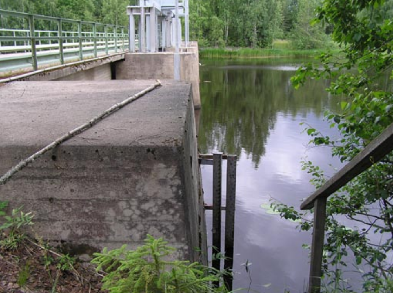
Kuva 11. Vedenkorkeusasteikko Riuttansalmen padolla.

paljon kesävedenpinnan alapuolelle ja että vedennostosta aiheutuva hyöty on olennaisesti suurempi kuin ranta-alueilla siitä johtuva haitta, joka on yleensä vedenpinnan nousun myötä tapahtuva rantapeltojen tai metsien vettäminen. Vedenpinnan noston aiheuttamat vahingot estetään yleensä toimenpitein, elleivät niistä syntyvät kustannukset ole kohtuuttoman paljon korvattavia vahinkoja suurempia. Eniten käytetty kompensointikeino on rantapengerrysten rakentaminen suojaamaan peltoalueita ja rakennuksia vedennoston vaikutuksilta. Mikäli kiinteistölle on vedennostosta hyötyä esim. rannan käyttökelpoisuuden paranemisena ja toisaalta haittaa esim. peltojen vettymisen lisääntymisenä, voidaan hyöty ottaa huomioon korvausta alentavana tekijänä. (Lakso 2005.)