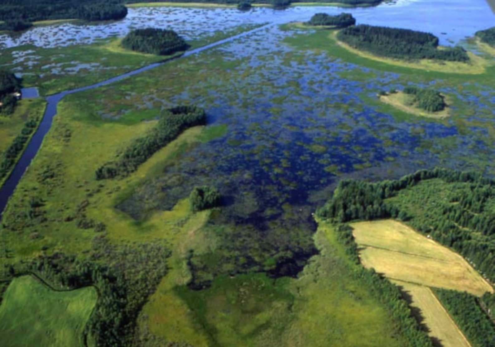
Kuva 5. Lassilanjoki näkyy selvänä uomana varsin umpeen kasvaneessa Inhottujärven itäpäässä. Kuva on otettu keväällä, jolloin kasvillisuus ei ole ollut vielä runsaimmillaan.