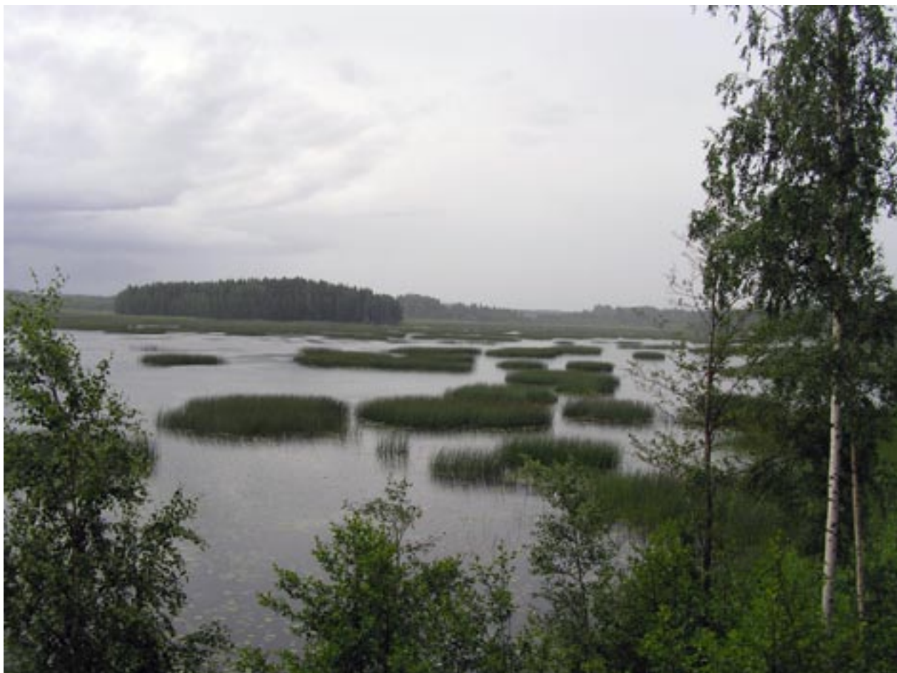
Kuva 6. Näkymä Lehtisalonnokan lintutornista.

Myös ruovikoita on järvellä vähän. Mainittavimmat ruovikot ovat luoteisrannalla ja sekä itäpäähän saarten itärannoilla. Ilmaversoisten valtaamia alueita on etenkin järven itäpäässä Lassilanjoen ruopatun uoman molemmin puolin sekä saarten ja rantojen ruovikoiden ulkopuolella, mutta laajempia alueita on myös järven pohjoisosissa ja länsirannalla. Näillä alueilla kasvuston muodostavat pääasiassa järvikorte ja järvikaisla.