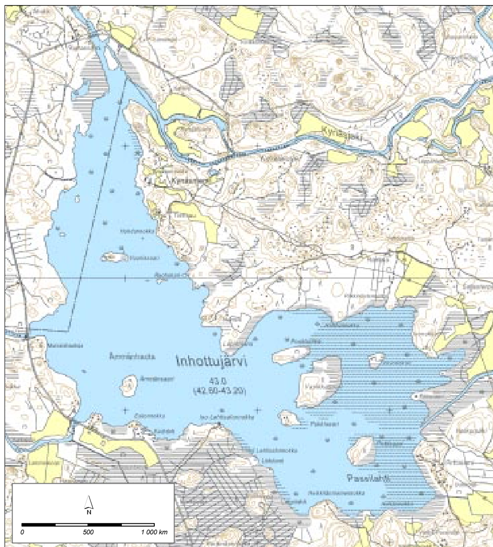
Kuva 2. Inhottujärvi