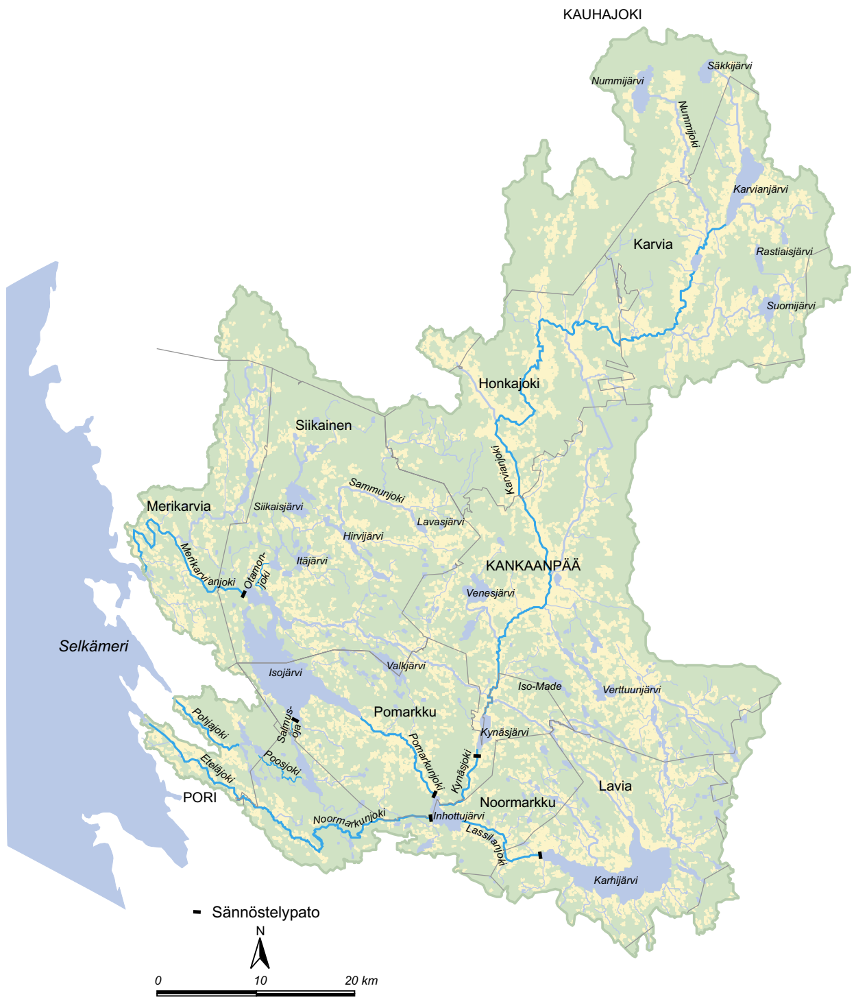
Kuva 1. Karvianjoen vesistöalue