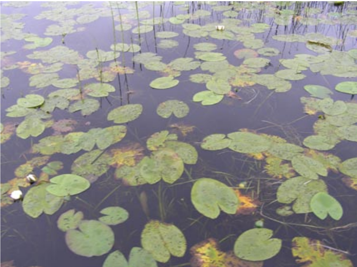
Kuva 13. Vesikasvillisuutta Inhottujärvellä.

Kasvillisuuden lisääntyminen ja umpeenkasvu kuuluvat osittain vesistöjen luontaiseen kehitykseen, jota tapahtuu kaikissa järvissä. Yleensä järven umpeenkasvu on hidas, vähintään vuosisatoja kestävä prosessi, joka kuitenkin nopeutuu loppua kohden. Ihmisen toimintojen seurauksena järven umpeenkasvu tapahtuu usein luontaista kehitystä huomattavasti nopeammin. Tyypillinen esimerkki umpeenkasvua kiihdyttävästä toiminnasta on vedenpinnan lasku, mutta ihminen voi myös hidastaa umpeenkasvua esimerkiksi vedenkorkeutta nostamalla. Lisääntynyt vesikasvillisuus koskettaa usein suurta osaa järven virkistyskäyttäjistä ja vaikeuttaa mm. veneilyä, uintia ja kalastusta. Yksi käytetyimmistä vesistöjen kunnostusmenetelmistä onkin juuri vesikasvien poistaminen. Sen tavoitteena on lähinnä kohentaa järvimaisemaa sekä parantaa järvien virkistyskäyttömahdollisuuksia. (Kääriäinen ja Rajala 2005.)