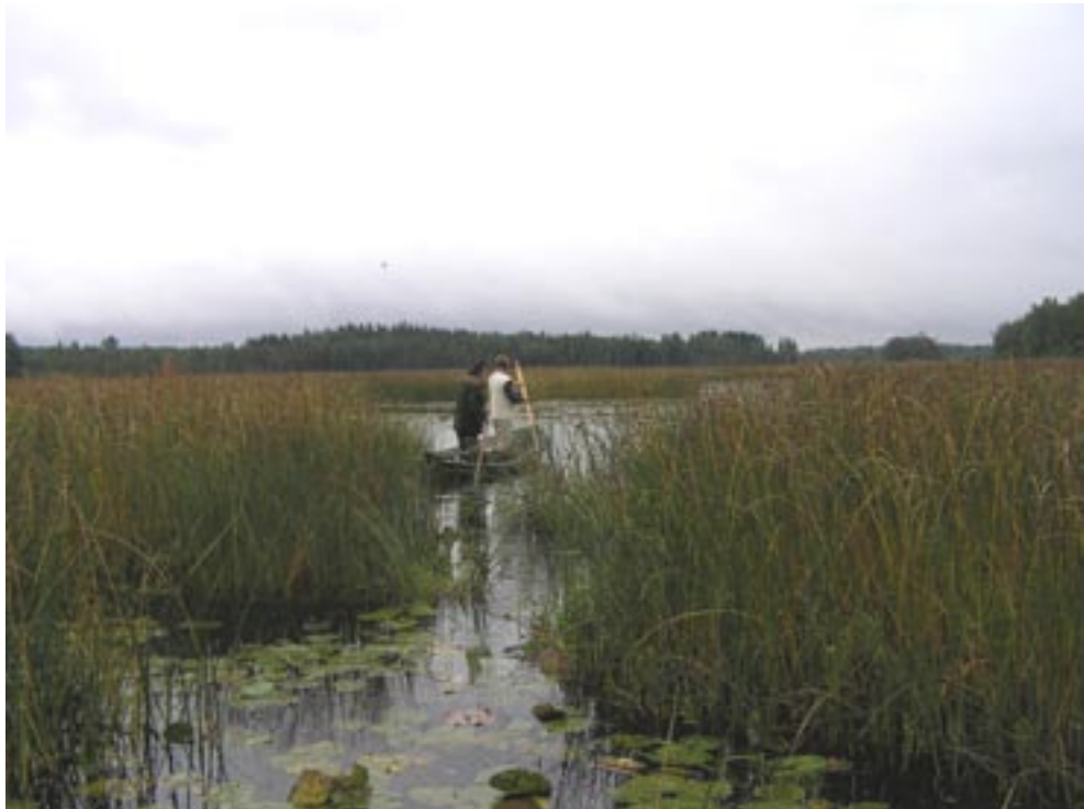
Kuva 7. Vaikeakulkuinen Inhottujärven itäpää on linnuston suosimaa.

Inhottujärven itäpään Natura-alueella on vireillä useampia rauhoitushakemuksia, mutta tällä hetkellä yksityisten luonnonsuojelualueiden perustaminen on vielä kesken. Natura-alueiden yleissuunnittelu Lounais-Suomen ympäristökeskuksen toimialueella on parhaillaan käynnissä ja käyttö- ja hoitosuunnitelmien tekeminen aloitetaan lähivuosina. Vaikkei Inhottujärvi olekaan luonnonsuojelullisilta perusteiltaan Lounais-Suomen ympäristökeskuksen toimialueen kiireellisimpiä kohteita, on se käyttö- ja hoitosuunnitelmien laatimisen suhteen Satakunnan tärkeimpiä kohteita mm. alueelle kohdistuvien moninaisten ja osin ristiriitaistenkin käyttöpaineiden vuoksi.