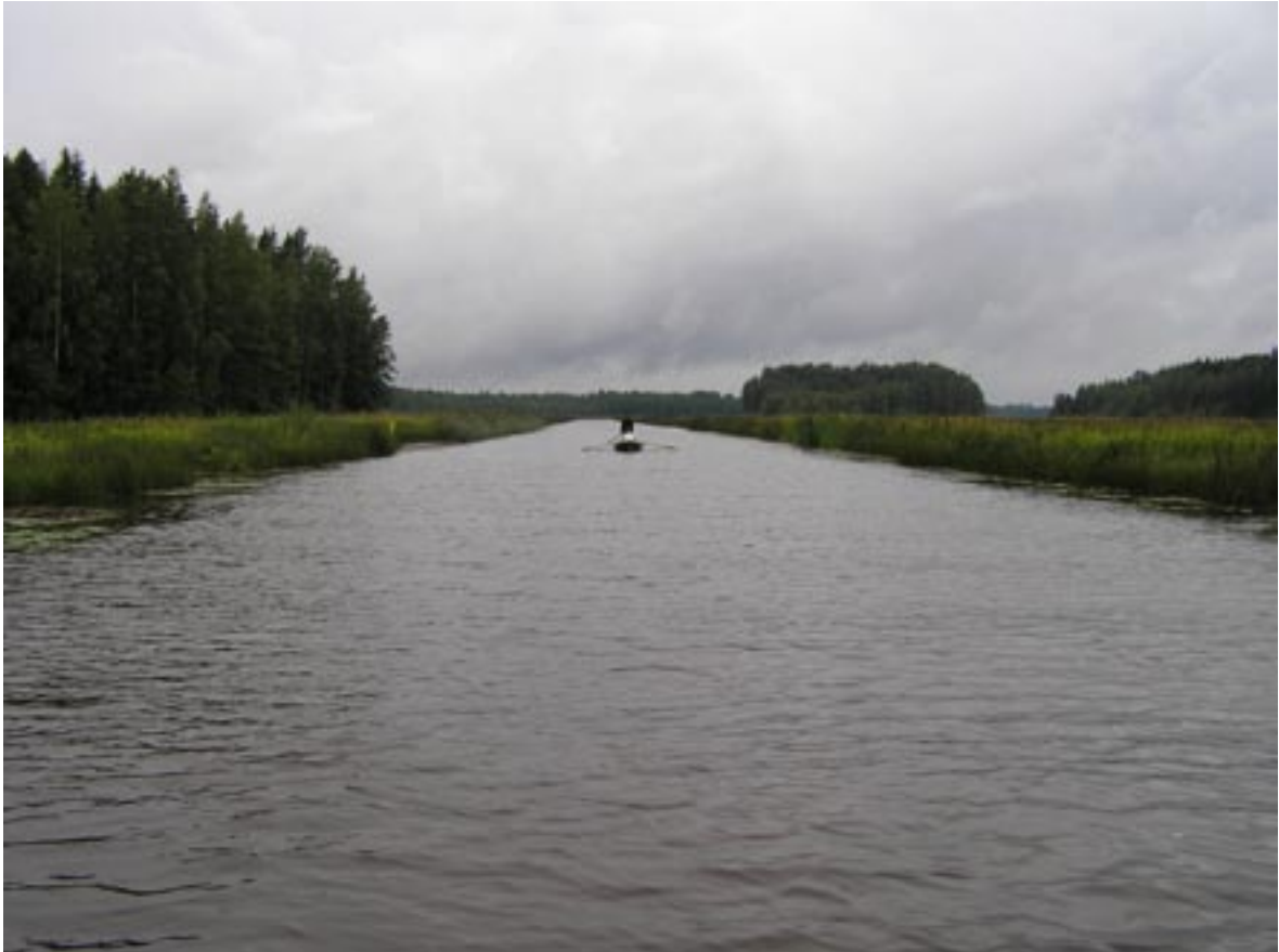
Kuva 12. Lassilanjoki virtaa Inhottujärven itäpäässä pitkän matkan penkkojen reunustamassa uomassa.

Lassilanjoen rantapenkkaan tehtävät virtausaukot ovat tulleet esiin myös mm. Karvianjoen vesistön kehittämis- ja kunnostusprojektin toimenpideohjelmassa (Ihalainen 1998). Toimenpideohjelmassa on nähty aiheelliseksi Inhottujärven suojeluyhdistyksen teettämän Inhottujärven kunnostussuunnitelman tarkistaminen ja täydentäminen virtausaukkojen osalta, sillä Lassilanjokisuun vanhat ruoppausmassapenkat estävät veden vaihtumisen matalissa lahdissa, jolloin talviaikana veden ollessa matalalla saattaa lahdissa esiintyä hapettomuutta. Toimenpideohjelmassa on esitetty myös, että Lassilanjokisuun mahdollisen liettymisen vaikutukset vedenkorkeuksiin ja niistä aiheutuviin haittoihin selvitetään jokisuussa. Toimenpideohjelman mukaan Tampereen vesi- ja ympäristöpiiri on 1970-luvulla laatinut Lassilanjoelle kunnostussuunnitelman, jonka tarkoituksena on, suurentamalla joen vesisyvyyttä, vähentää niitä haittoja, joita 1960-luvulla tehty perkaus aiheutti mm. joen virkistyskäytölle, vedensaannille, vesimaisemalle ja kalastolle. Suunnitelma ei kuitenkaan ole edennyt. Välittöminä toimenpidetarpeina Inhottujärvellä on toimenpideohjelmassa nähty kunnostussuunnitelman tarkistaminen sekä huolehtiminen järven tilasta ennen kunnostusta niittämällä. Vaikka teetetyssä kunnostussuunnitelmassa lähtökohtana on virkistyskäyttöarvon parantaminen, on toimenpideohjelmassa Inhottujärven kunnostamisella nähty olevan järven lintuvesiarvon johdosta myös laajempaa yleistä merkitystä.