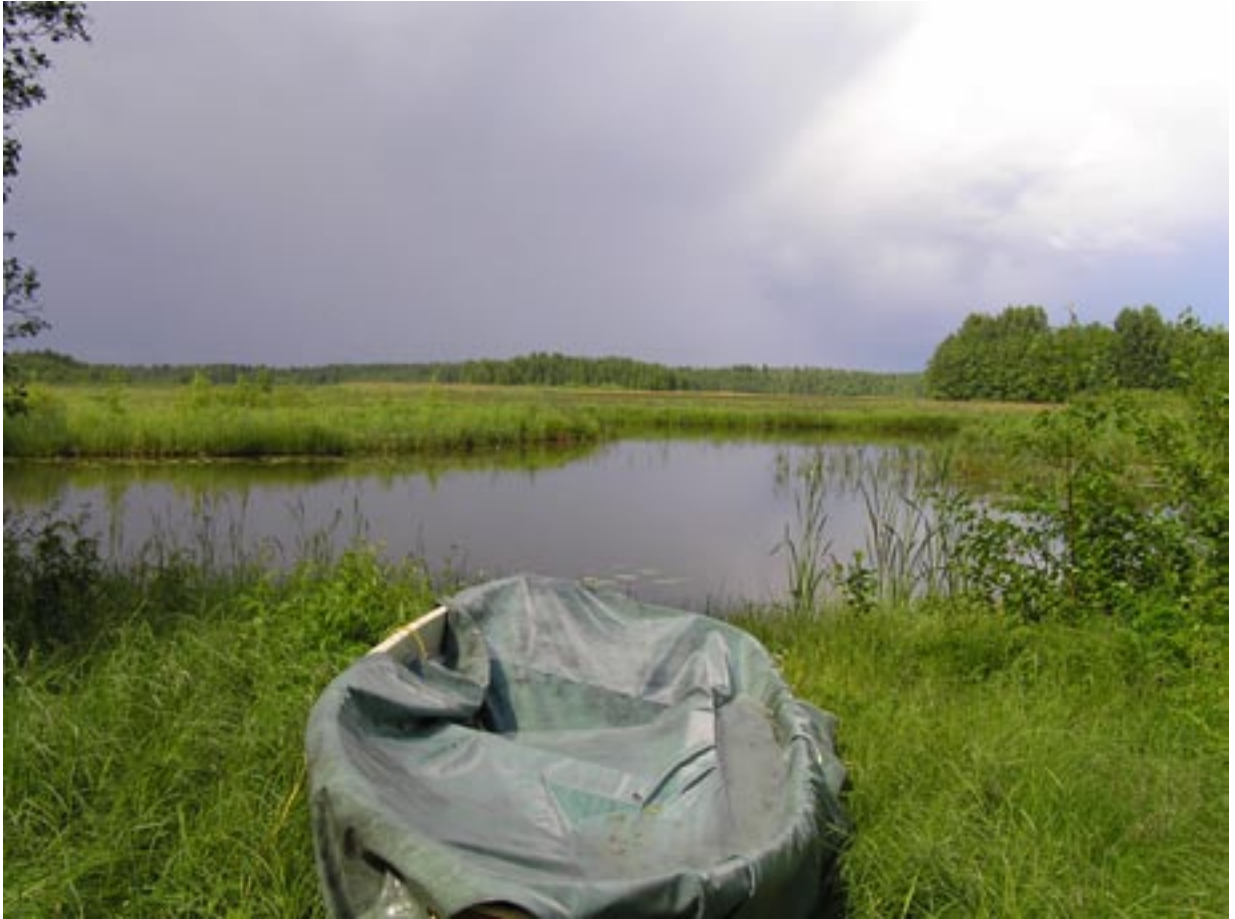
Kuva 4. Pirttiniemen venerannasta katsottuna Inhottujärven itäpää näyttää varsin umpeen kasvaneelta.

on meneillään samanlainen kehitys, kiihtyvä rehevöityminen ja umpeenkasvu, kuin monessa muussakin matalassa satakuntalaisessa järvestä. Järvien umpeenkasvu vedenpinnan laskun jälkeen on aluksi hidas, mutta vuosikymmenien kuluessa vähitellen kiihtyvä prosessi.