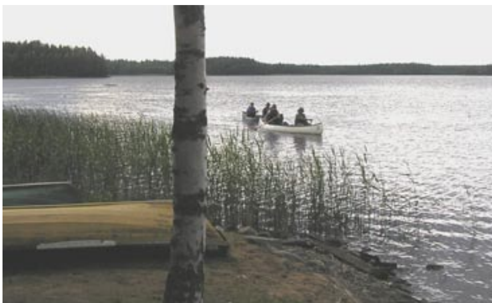
Kuva 8. Melojia Inhottujärvellä Lehtisalonnokan edustalla.

Inhottujärvellä on Natura-alueen lisäksi Kynäsluodossa sijaitseva luonnonsuojelualue Kynäsluodon lehto. Tampereen vesipiirin vesitoimiston säännöstelysuunnitelman (1985) mukaan Satakunnan seutukaavaliiton 1979 julkaisemassa selvityksessä (Satakunnan seutukaavaliiton julkaisu, sarja A:120) on inventoitu kulttuurihistorialliset kohteet Satakunnassa. Sen mukaan Inhottujärven välittömässä läheisyydessä olevia kulttuurihistoriallisesti suojeltavia kohteita on mm. Kynäsniemen rakennusryhmä Inhottujärven rannalla.