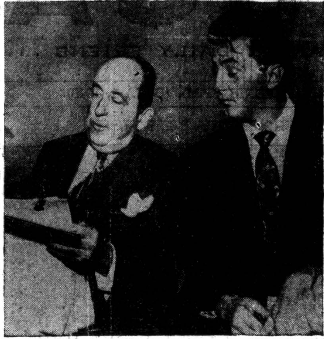
Aktorius Robert Mitchum (dešinėje) su savo advokatu teisme Hollywoode neprisipažino nusikaltesis narkotikų vartojimu.

li pragyventi. Pavyzdžiui, darbininkas uždirba 450 rublių mėnesį. Iš tos sumos nemažą dalį jis turi sumokėti valdžiai ir įvairiems bolševikiškiems komitetams.