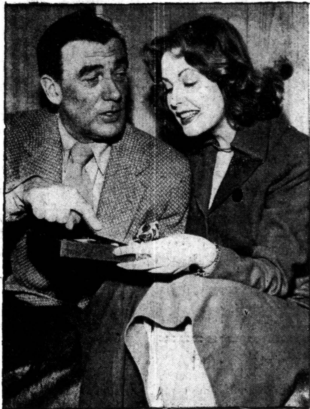
Walter Pidgeon vaišina Arlene Dahl, kuri domisi filmos "Command Decision" filmavimu. Tačiau ji pati toje filmoje ne vaidina. Ne vaidina ne tik ji, bet ir jokia kita moteris aktorė. Ta filmą tuo nepaprasta, kad joje vaidina vien tik vyrai.