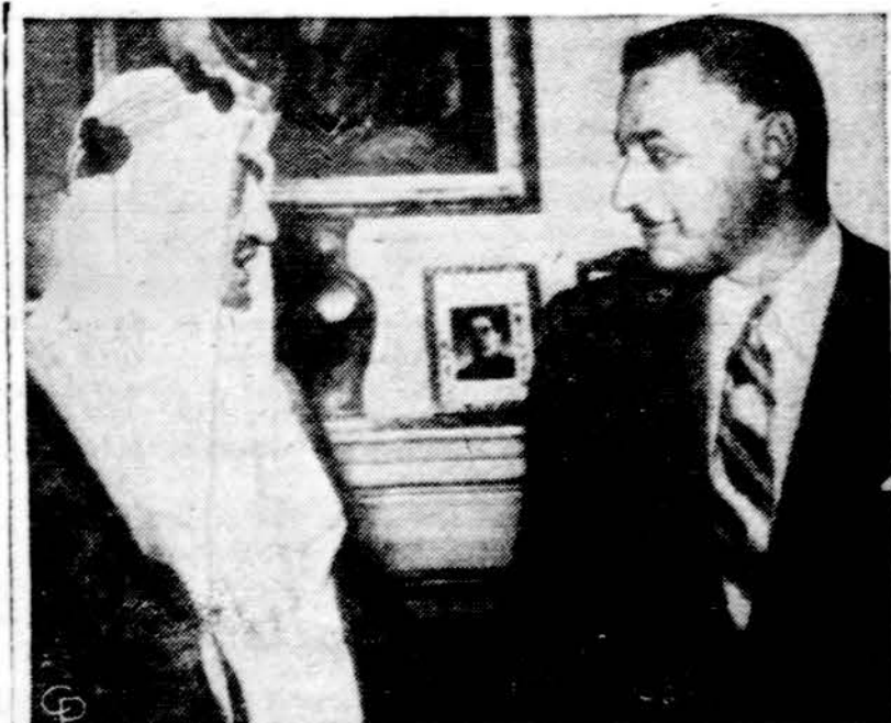
„Debesys pašalinti“ — „Debesys pašalinti tarp dviejų valstybių“ — pareiškė Saudi Arabijos princas Faisal laikraštiniams Kaire po konferencijos su Jungtinių Arabų respublikos prezidentu Nasseriu. Faisal ir Nasseris turėjo trijų dienų konferenciją Kaire.

17 bilionų rublių nuostolių Lietuvai padaryta praėjusio karo metu. Tai pranešė Vilniaus radijas rugpjūčio 4 d. laidoje pramonės darbininkams.