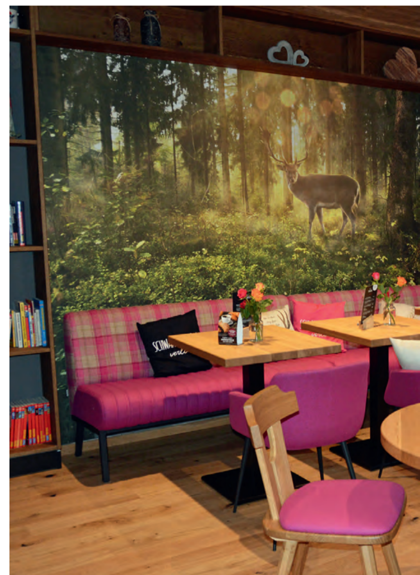
Die Schwarzwaldstube lädt zu einer genussvollen Kaffee- und Kuchenpause ein.