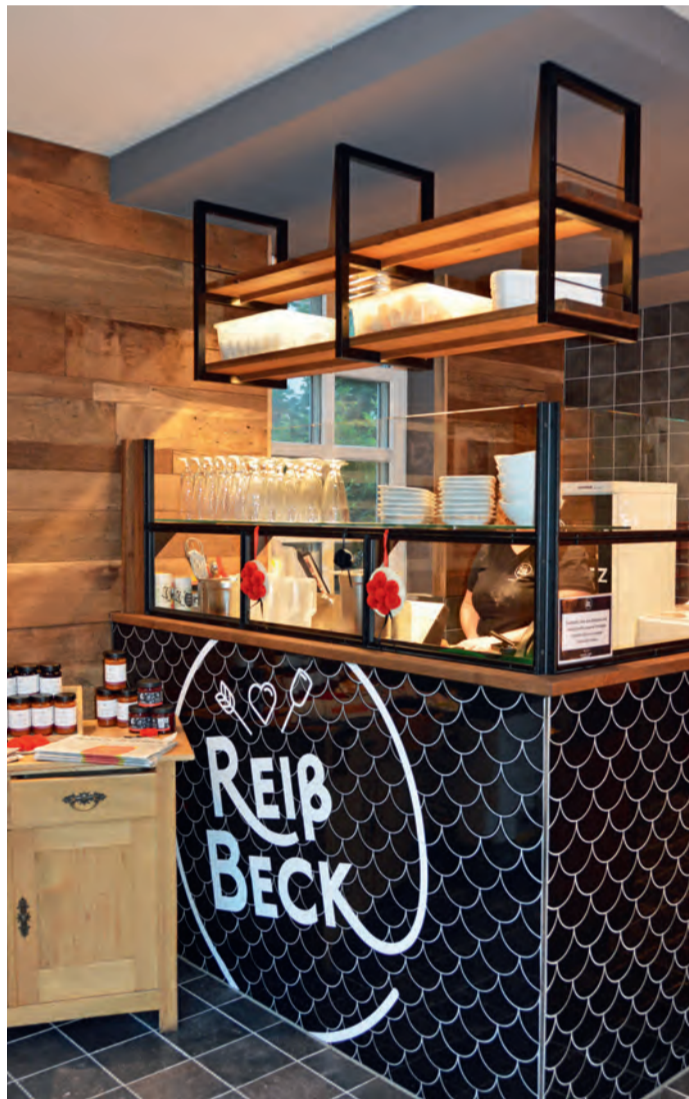
In der Ecke am Eingang können die Mitarbeiterinnen leckere belegte Brote vorbereiten.