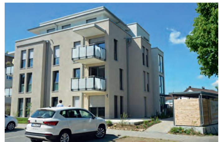
So präsentiert sich das Haus Kirschenhof 1 von der Südseite.