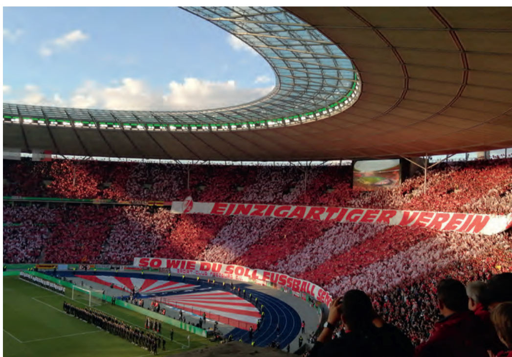
Mit der Choreographie "Einzigartiger Verein - So wie du soll Fussball sein" begrüßten die SC Fans die Mannschaft im Berliner Olympiastadion zum DFB Pokal Finale.

Bei einem Fan-Fest auf dem Breitscheid-Platz am Fuße der Gedächtniskirche wurden von Tausenden die Fan-Songs geschmettert und natürlich auch immer wieder das Badner-Lied, womit sich die Fans fröhlich, friedlich und ausgelassen auf das große Finale einstimmen. Am Samstagnachmittag dann der beeindruckende Marsch zum Finale, eine rote Karawane, bestehend aus ca. 30.000 erwartungsvollen SC-Fans, die sich von der Innenstadt gemeinsam