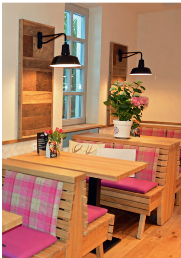
In diesen Sitzecken kann sich manche Gesprächsrunde niederlassen.