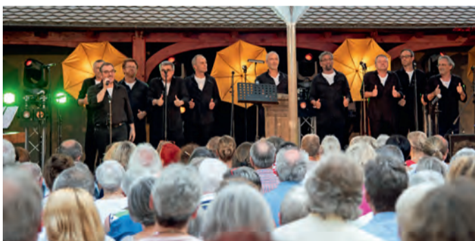
Auch die Oberrieder Ohrwürmer traten bereits beim Festival auf.

In sechs Konzerten an vier Tagen kommt die ganze Welt des Gesangs – im wahrsten Sinn des Wortes – ins Dreisamtal. Den Auftakt macht Donnerstag, 16. Juni, um 20 Uhr die „Future-Night“ in der Evangelischen Kirche mit UNDUZO, Neilon und anderen. Freitag folgt um 20 Uhr in der Talvogtei der „Fabulous Friday“ mit z.B. Acoustic Instinct und „anders“. Samstag gibt es um 15 Uhr ein Kinderkonzert und am Abend um 20 Uhr die „Big Vocal Night“ mit