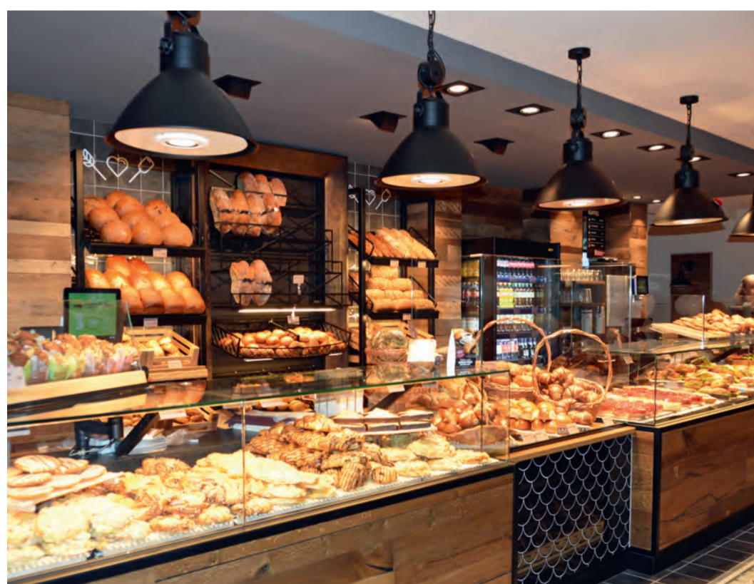
An einer langen Theke präsentiert Reiß-Beck im Rats-Café vielfältige Backwaren.