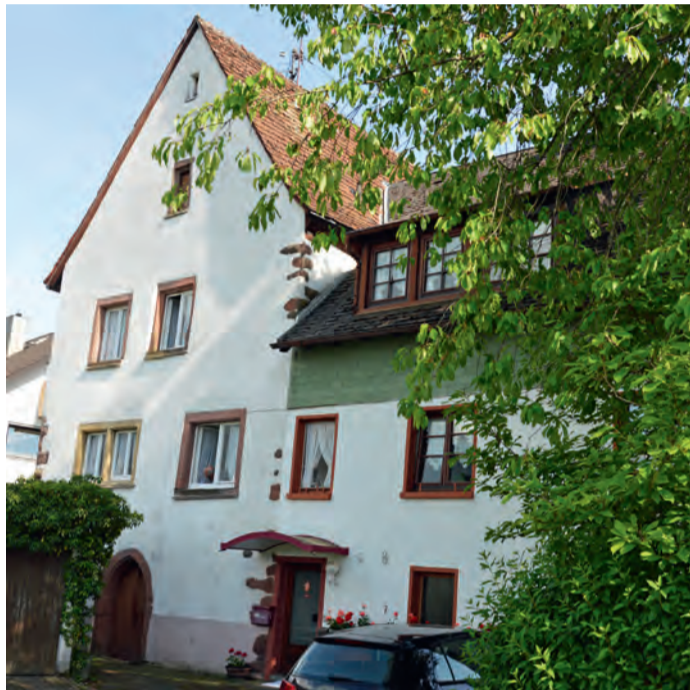
Das Turmhaus Janz in Zarten gehört zu den ältesten profanen Bauten im Dreisamtal.