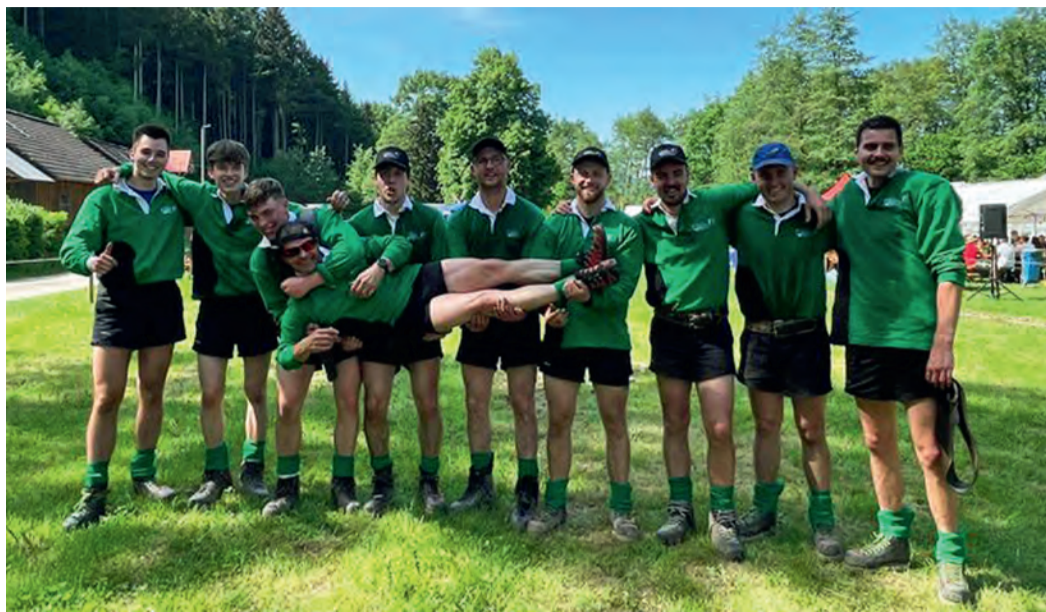
Die siegreichen Tauzieher der Tauziehfreunde „Bleifuß“ Dietenbach.

Sonniges Turnier der Tauziehfreunde „Bleifuß“ Dietenbach am Engenwald