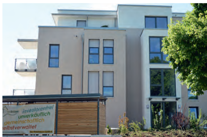
Das Wohnprojekt steht gleich an der Ecke Freiburger Straße – Dr. Gremmelsbacher Straße