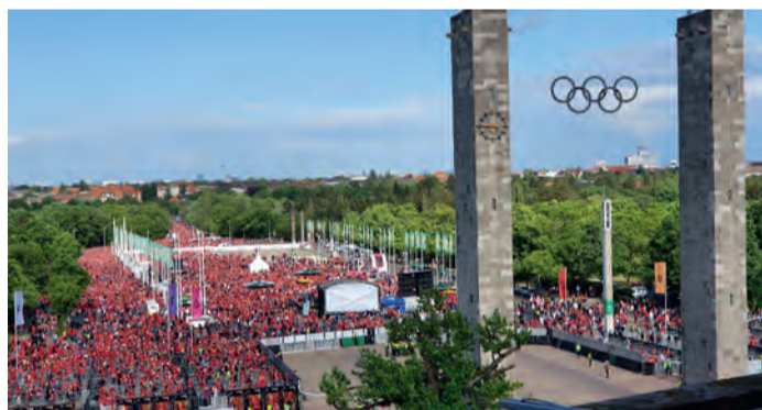
Beeindruckend die rote Karawane: Gemeinsam pilgerten ca. 30.000 SC Fans friedlich und bestens gelaunt von der Innenstadt ins Olympiastadion.