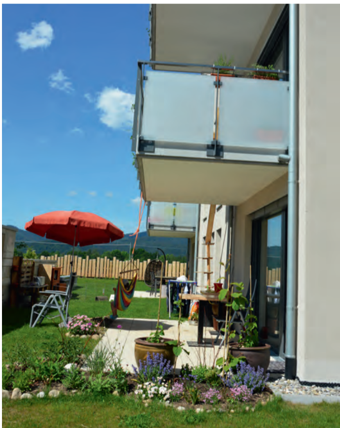
Alle Bewohner können den Garten beim Haus nutzen.

www.loeffler-geruestbau.de info@loeffler-geruestbau.de