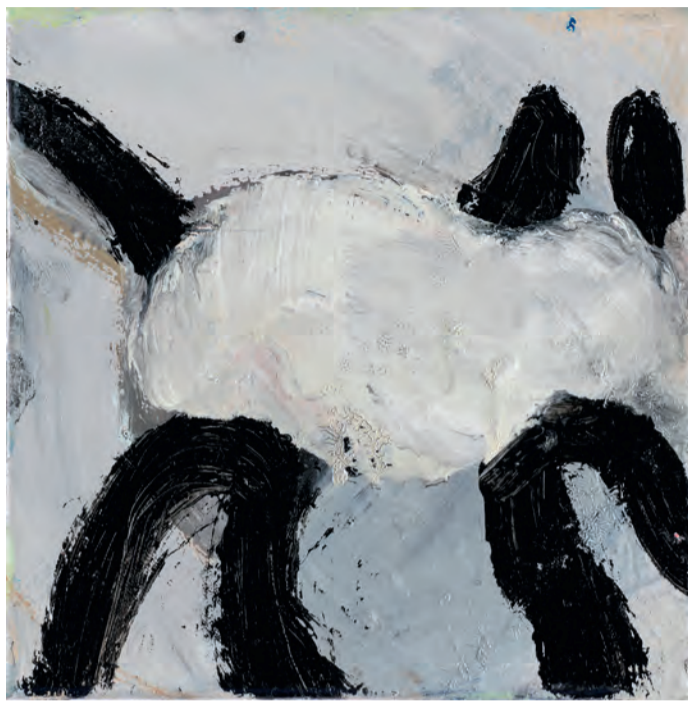
Peter Bosshart: Gump, 2020, Öl auf Leinwand.

In der Ausstellung mit dem alemannischen Titel "Gump" sind die Schlüsselmomente oder Initialzündungen beim Erarbeiten eines gemalten Bildes nachspürbar. Ein plötzlicher Gedankensprung, ein Gump, kann die Möglichkeit eröffnen ein Bild neu zu strukturieren, etwas anzustoßen, welches dieser Überraschungsmoment auslöst und auf die anderen Teile des Bildes überträgt. Eine Kettenreaktion dessen Ende dann noch nicht absehbar ist. Diese Sprünge und Wendungen, die bei der Malarbeit entstehen und nötig sind, sollen aber die Bilder in ihrer einfachen Zugänglichkeit nicht stören, sondern im Betrachter emotionales Wiedererkennen bereits gemachter Erfahrungen oder auch Ablageort für neu empfangene Gefühlspe-