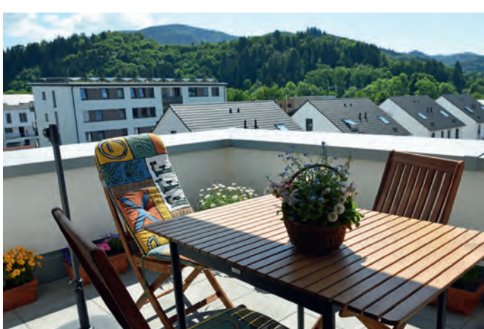
Der Blick von den Balkonen ganz oben ist wunderbar.