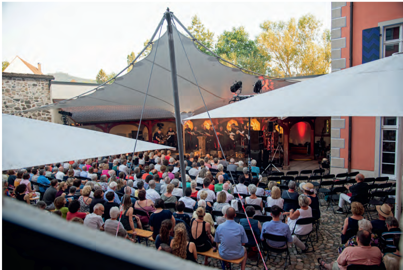
Der Innenhof der Talvogtei bietet einen fantastischen Rahmen für die Atmosphäre des „Black Forest Voices Festival“.

„Back again!“. Das 4. Black Forest Voices Festival 2022 vom 16. bis 19. Juni in Kirchzarten