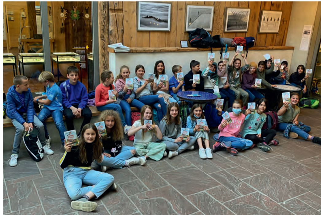
Schülerinnen und Schüler vom Kolleg St. Sebastian Stegen freuten sich über ein Buchgeschenk am Welttag des Buches.

Kollegschüler unternahmen eine Exkursion zum Welttag des Buches 2022