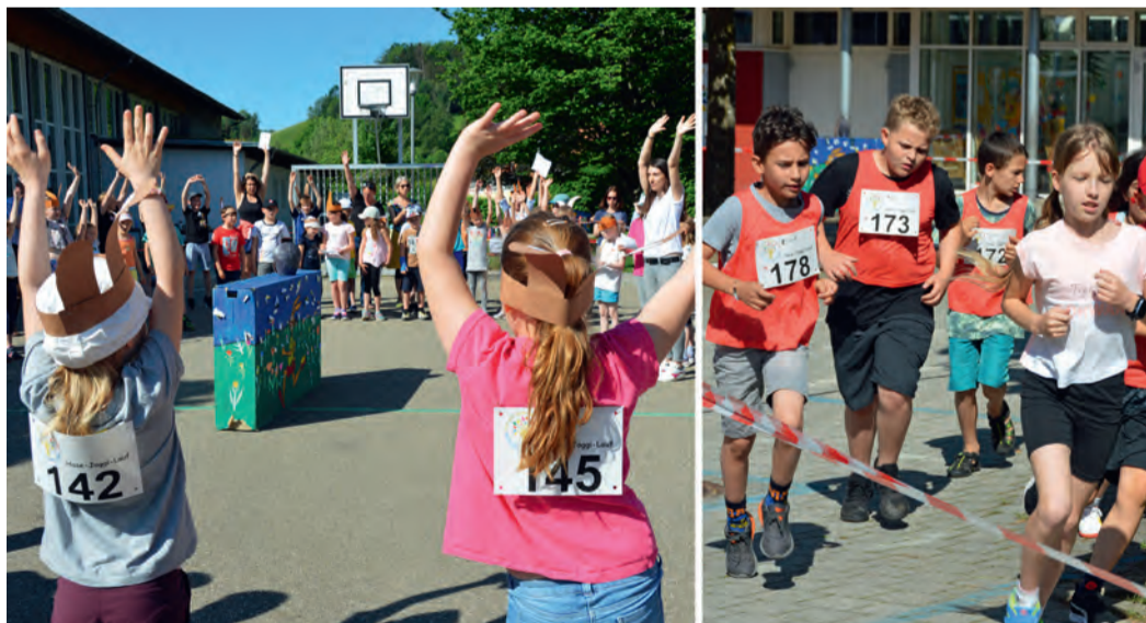
Vor dem Laufwettkampf (r.) stand das spielerische Aufwärmen (l.) mit dem neuen „Hase-Joggi-Lied“ auf dem Programm.

Nach zwei Jahren Pandemiepause gingen 67 Schüler in Eschbach an den Start