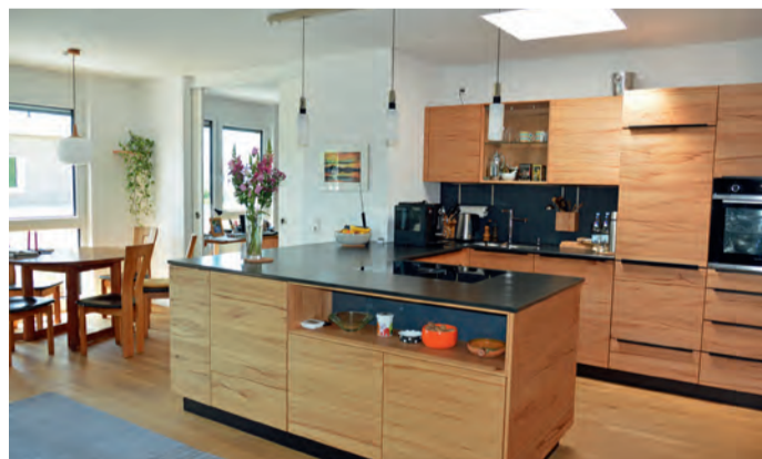
Traumhaft sind Küche und Wohnraum bei Dieter Kienert, der mit seiner Frau in einer freifinanzierten Wohnung im 4. OG wohnt.