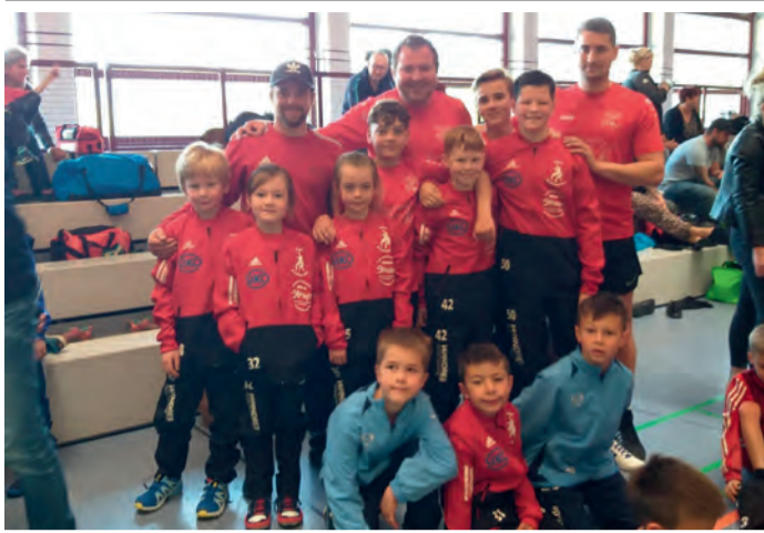
Die jüngsten RingerInnen des SV Eschbach 1967 mit ihren Trainern.

Stegen-Eschbach (dt.) In Haslach i. K. fand kürzlich das Hubert-Völker Gedächtnisturnier für Erststarter statt. Der Sportverein Eschbach 1967 war mit acht Kindern am Start. Die jungen Sportler haben mit ihren Leistungen die Trainer und Eltern gleichermaßen überrascht. Es waren die ersten Erfahrungen auf fremdem Gefilde und damit immens wichtig für die weitere Entwicklung der Kleinsten.