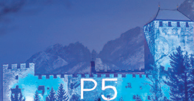
Schloss Bruck, Lienz.