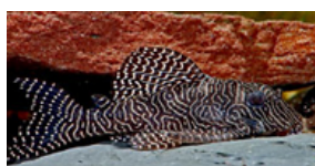
Hypancistrus sp. "L260" (ikke videnskabeligt beskrevet)