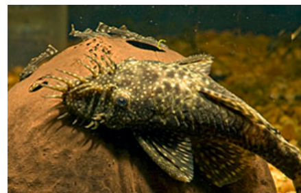
Skægfish ( Ancistrus dolichopterus ) yngler flittigt i akvariet. Decideret opdræt af sugemaller kræver dog, at man på forhånd sætter sig grundigt ind i den enkelte arts behov. Forhør dig evt. hos Dansk Akvarie Union for kontakt til praktikere, der har erfaring med opdræt.

Ved hold af sugemaller skal man især være opmærksom på ikke at holde for mange andre bundlevende fisk i samme akvarium.