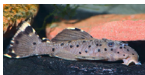
Leporacanthicus joselimai (uoff. navn: sultanplecostomus)