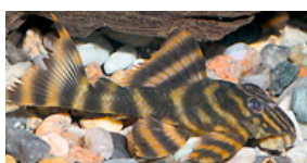
Panaqolus sp. "L360" (ikke videnskabeligt beskrevet)