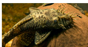
Ancistrus dolichopterus (skægfish)