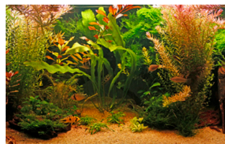
I det beplantede stueakvarium er det vigtigt, at fiskene har masser af både svømmeplads og skjul, samt mulighed for eventuel territorieafgrænsning og æglægning.

Længere sydpå i den centrale del lever Otothyropsis piribebuy og Rineloricaria parva , mens den østlige del huser Harttia kronei , Hisonotus leucofrenatus , Macrotocinclus affinis og Parotocinclus spilosoma .