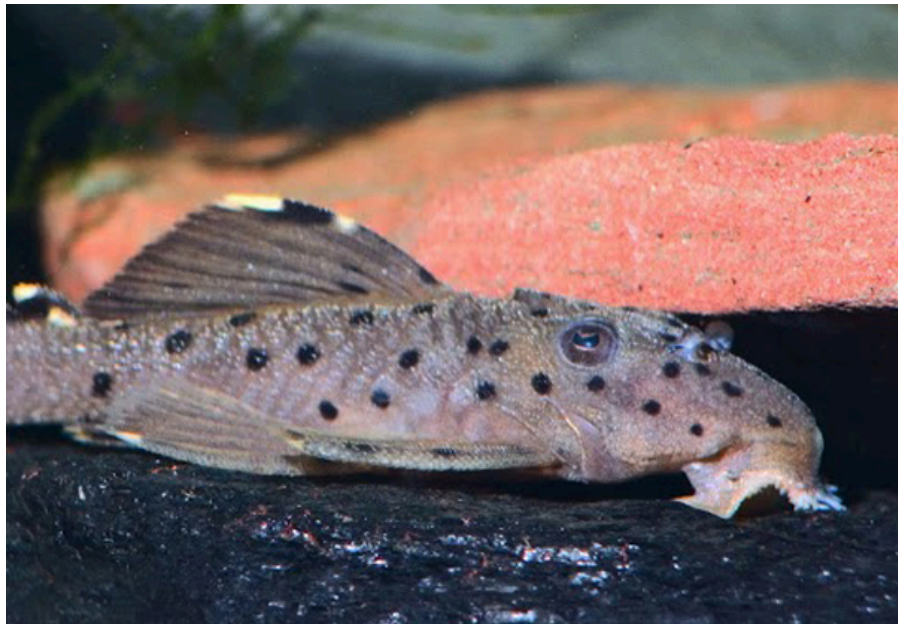
Loporacanthicus joselimai , der populært kaldes sultanplecostomus, er en ud af mindst 800 nulevende sugemalle-arter.