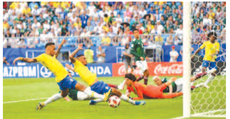
Neymar keresztbe vezette a labdát a mexikói tizenhatoson, majd sarokkal kiugratta Williant. Utóbbi majdnem az alapvonalig vezette a labdát, beadására Gabriel Jesus és Neymar érkezett vetődve, végül utóbbi spiccel juttatta a labdát a kapuba három méterről

Mexikó: Ochoa – Álvarez (55. Jonathan dos Santos), Ayala, Salcedo, Gallardo – Herrera, Rafael Márquez (46. Layún), Guardado – Lozano, Javier Hernández (60. Jiménez), Vela.