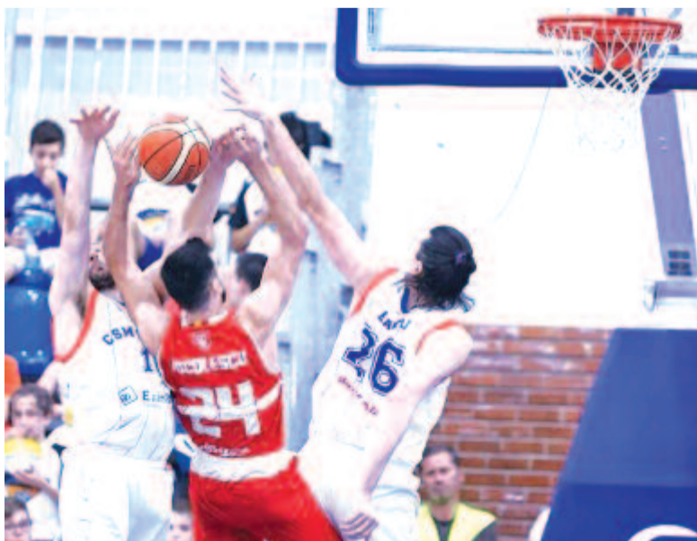
Izgalmasabb hajrát is várunk a kezdeményezők – a képen a nemrégiben zárult évad bajnoki döntőjének egyik csatája a palánk alatt

Magyarországon a Szolnoki Olaj kiélezett csatában győzött Szombathelyen a férfikosárlabda NB I döntőjének negyedik mérkőzésén, így 3-1-es összesítéssel megnyerte a párharcot, és megszerezte fennállása nyolcadik aranyérmét. Az eredmények: Szolnok – Szombathely 82:76; Szombathely – Szolnok 76:73, Szolnok – Szombathely 89:70, Szombathely – Szolnok 81:83.