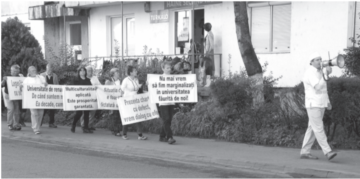
Az Egyesülés negyedben

Az Egyesülés negyedbeli tüntetés résztvevőit kérdezték meg, hogy ahogyan idős emberek a MOGYE jellegének megőrzéséért vállalták a kiállást, a hosszú gyaloglást. Fiatalok nem voltak közöttük. (bodolai)