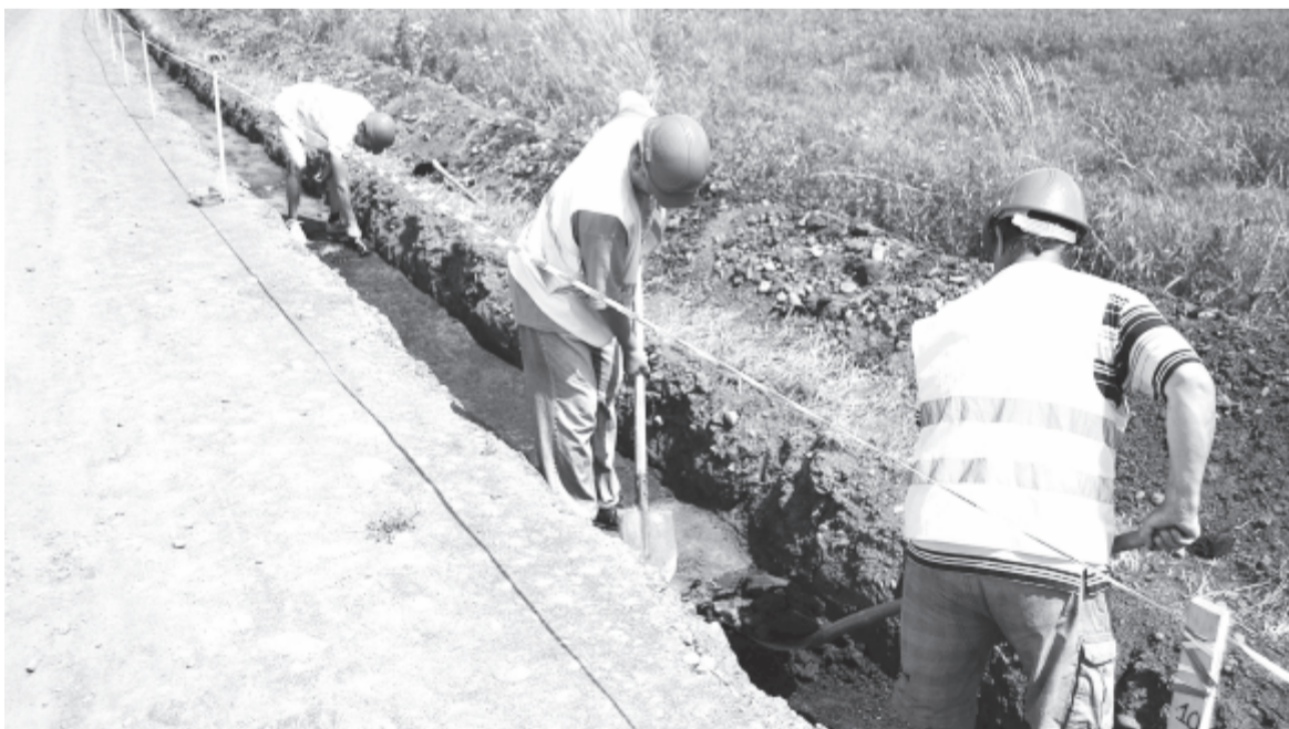
A csatornázás előtt egyedi lehetőség nyílt a katonai táboron kívüli rész feltáráására

Nagyon fontos volna az itt dolgozóknak számára, ha a Maros Megyei Tanács vásárolna Mikházán egy ingatlant, hogy ott a múzeum régészeti bázist alakítson ki raktárral, kutatólaboratóriummal és esetleg szálláshelyekkel, ugyanis jelenleg a művelődési otthonban van a „főhadiszállásuk”, és naponta két órát kell ingázással tölteniük Marosvásárhely és Mikháza között.