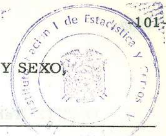
Tabla Nº 8. - POBLACION INMIGRANTE DEL CANTON MONTUFAR, POR AÑOS DE RESIDENCIA Y SEXO, SEGUN GRUPOS DE EDAD