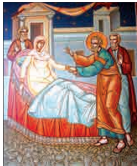
Învierea Tavitei de către Sfântul Petru

Din Biblie aflăm despre multe întâmplări în care oamenii au fost recunoscători pentru binele primit. De exemplu, se spune că Sfântul Apostol Petru a fost chemat odată într-un orășel. Murise Tavita, o tânără harnică, prietenoasă și milosivă. Toți creștinii de acolo vorbeau despre faptele ei bune. Când a ajuns și a văzut durerea celor din casă, Sfântul Petru s-a rugat pentru ajutorul lor. Atât de puternică a fost rugăciunea lui, încât Dumnezeu a înviat-o pe Tavita și i-a bucurat pe toți.