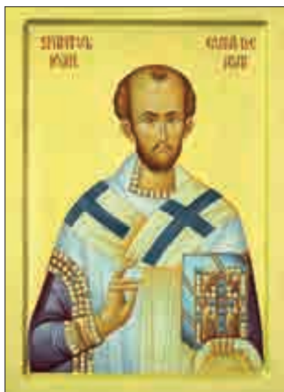
Sfântul Ioan Gură de Aur