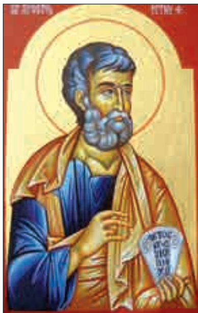
Sfântul Apostol Petru