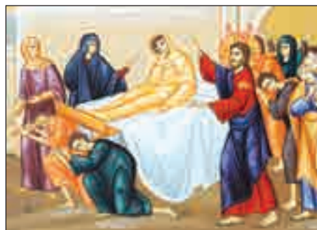
Învierea fiului văduvei din Nain