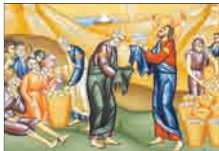
Înmulțirea pâinilor și a peștilor