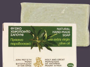
ΠΡΑΣΙΝΟ - $7.00