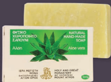
ΑΛΟΗ - $7.00