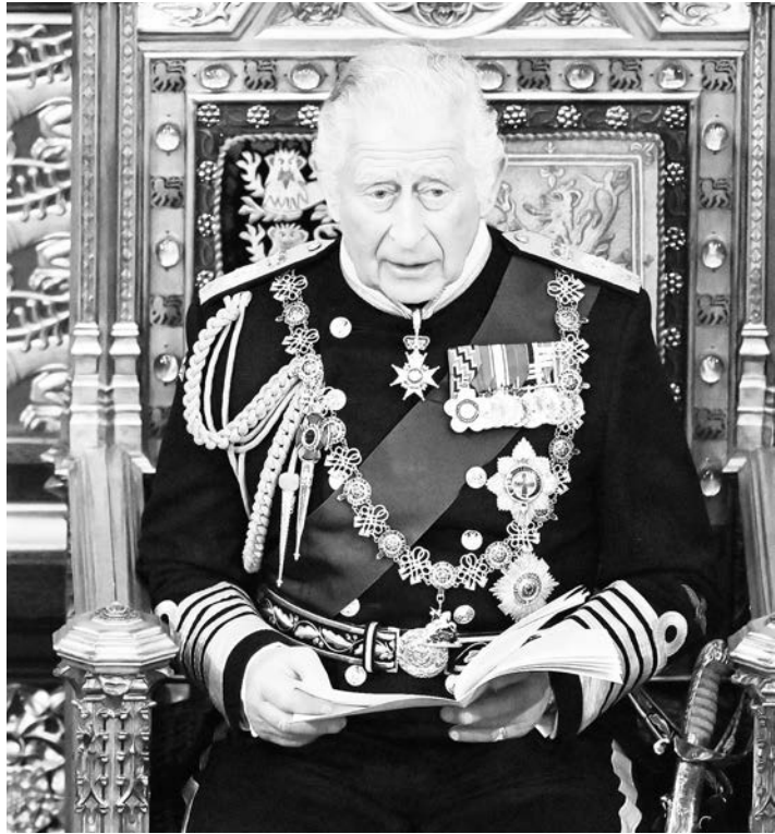
Ο πρίγκιπας Κάρολος της Βρετανίας διαβάζει την ομιλία της Βασίλισσας Ελισάβετ στη Βουλή των Λόρδων, κατά τη διάρκεια των εγκαινίων του Κοινοβουλίου.

Η βασίλισσα απείχε από την τελετή αυτή δύο φορές κατά τη διάρκεια της 70χρονης βασιλείας της -το 1959 και το 1963, όταν ήταν έγκυος στους γιους της Αντριου και Εντουαρντ.