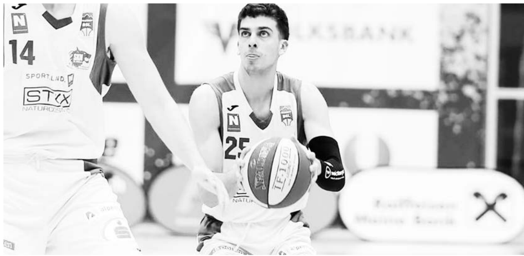
ΠΑΕ ΚΟΛΟΣΣΟΣ ΡΟΔΟΥ