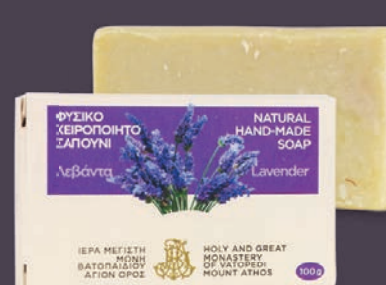
ΛΕΒΑΝΤΑ - $7.00