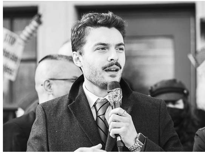
ΕΥΓΕΝΙΚΗ ΠΑΡΑΧΩΡΗΣΗ ΣΤΟΝ «Ε.Κ.»

«Η απόφασή μου να κατέλθω στις εκλογές για την Πολιτειακή Γερουσία επιβλήθη μετά από τα ταραχώδη γεγονότα του 2019 και του 2020: τα ολέθρια επεισόδια του Black Lives Matter, η έξαρση της εγκληματικότητας στην πόλη μας, τα λοκντάουν του Covid και η γενική αίσθηση ότι η γενιά μου είναι η πρώτη στην αμερικανική Ιστορία που θα έχει χαμηλότερα επίπεδα διαβίωσης από τους γονείς της. Είδα και συνεχίζω στην βλέπω τους πολιτικούς στην πολιτειακή διακυβέρνηση να περιφρονούν τους ίδιους τους ψηφοφόρους τους: Μας κατέστησαν λιγότερο ασφαλείς, μας στέ-