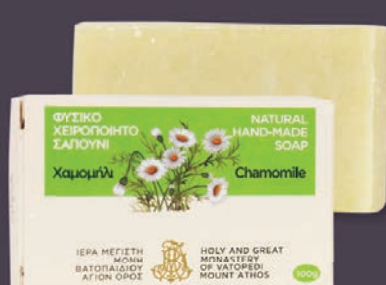
ΧΑΜΟΜΗΛΙ - $7.00