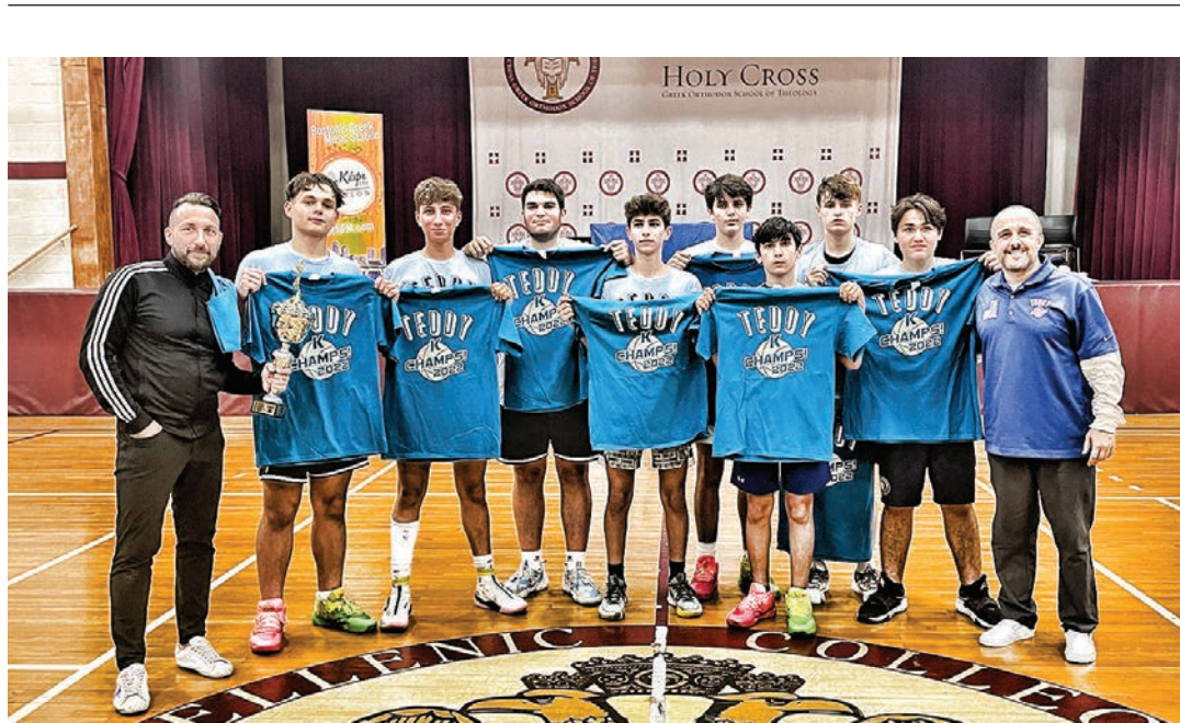
TEDDY K CLASSIC