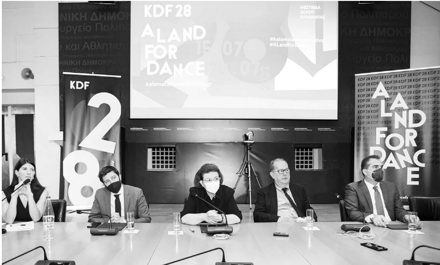
Από αριστερά: Λίνα Καπετανέα, καλλιτεχνική διευθύντρια του Διεθνούς Φεστιβάλ Χορού Καλαμάτας, Νικόλας Γατρομανωλάκης, υφυπουργός Πολιτισμού και Αθλητισμού, αρμόδιος για θέματα Σύγχρονου Πολιτισμού, Λίνα Μενδώνη, υπουργός Πολιτισμού και Αθλητισμού, Παναγιώτης Ε. Νίκας, περιφερειάρχης Πελοποννήσου, Αθανάσιος Π. Βασιλόπουλος, δήμαρχος Καλαμάτας.

«Το υπουργείο Πολιτισμού και Αθλητισμού στηρίζει το Φεστιβάλ με τριετή προγραμματική σύμβαση, την οποία έχουμε υπογράψει με την Περιφέρεια Πελοποννήσου και με τον Δήμο Καλαμάτας, με συνολικό προϋπολογισμό 1,9 εκατ. ευρώ περίπου. Από αυτά το υπουργείο συμβάλλει με 400.000 ευρώ ετησίως γιατί πραγματικά πιστεύουμε απολύτως στο Φεστιβάλ και στον Θεσμό» τόνισε η κα Μενδώνη ευχαριστώντας παράλληλα όλους όσους συνεργάστηκαν για την πραγματοποίηση της φετινής διοργάνωσης.