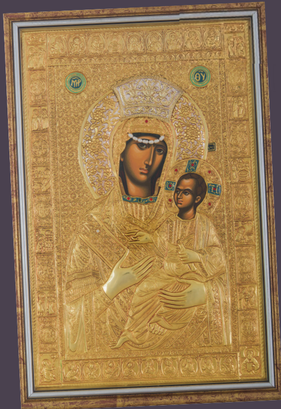
Εικόνα της ΠΑΝΑΓΙΑΣ ΒΗΜΑΤΑΡΙΣΣΑΣ

Τα ΕΛΛΗΝΙΚΑ ΧΡΙΣΤΙΑΝΙΚΑ ΔΩΡΑ που είναι ΑΠΑΡΑΙΤΗΤΑ για κάθε σπίτι και που εισάγονται ΑΠΟΚΛΕΙΣΤΙΚΑ από τα «Δώρα του "Εθνικού Κήρυκα"»