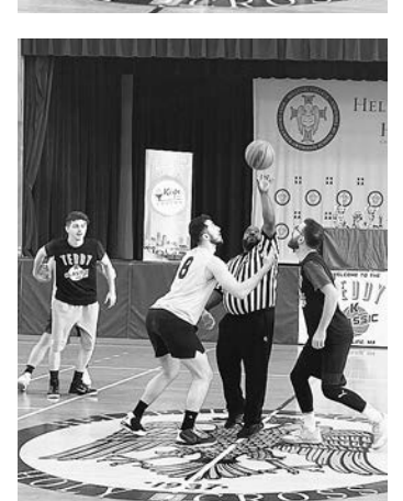
TEDDY K CLASSIC