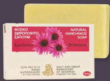
ΕΧΙΝΑΤΣΕΑ - $7.00