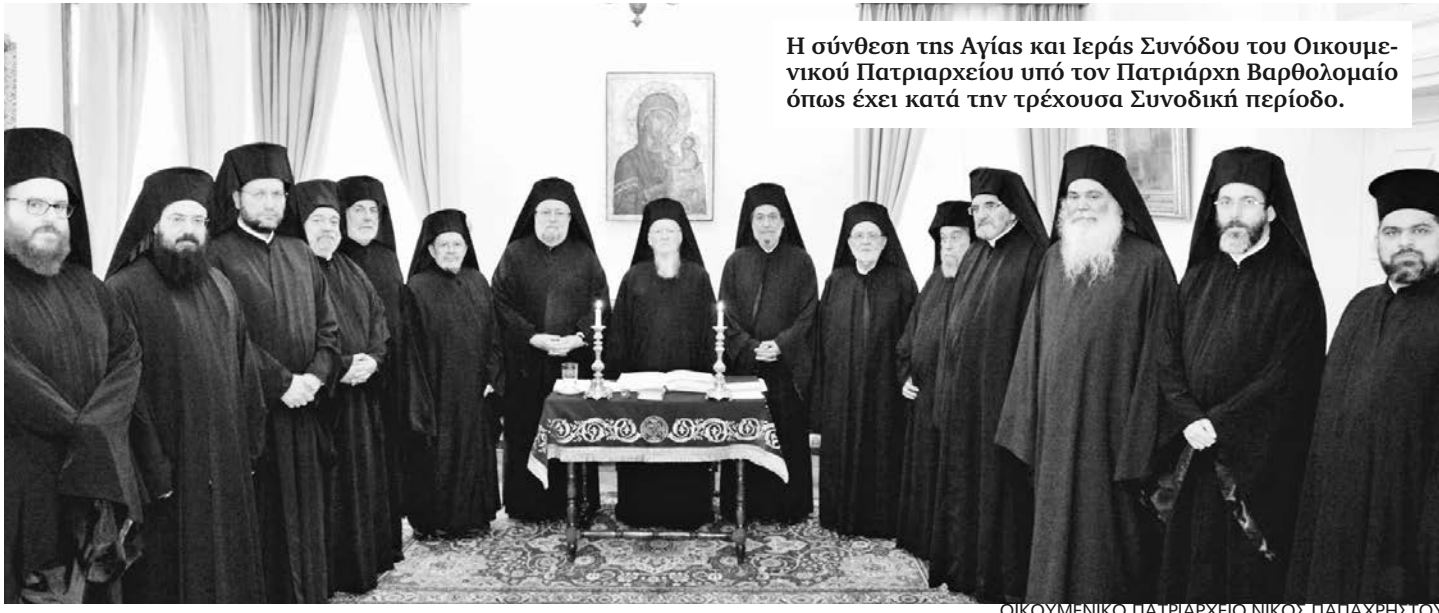
Η σύνθεση της Αγίας και Ιερής Συνόδου του Οικουμενικού Πατριαρχείου υπό τον Πατριάρχη Βαρθολομαίο όπως έχει κατά την τρέχουσα Συνοδική περίοδο.

Εκ της Αρχιγραμματείας της Αγίας και Ιερής Συνόδου».