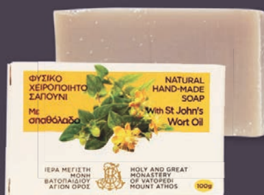
ΣΠΑΘΟΛΑΔΟ - $7.00