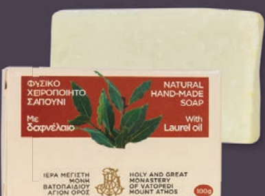
ΔΑΦΝΕΛΑΙΟ - $7.00