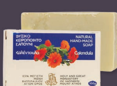
ΚΑΛΕΝΤΟΥΛΑ - $7.00