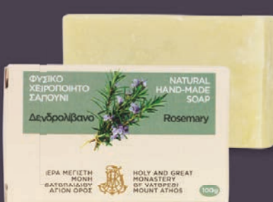
ΔΕΝΔΡΟΛΙΒΑΝΟ - $7.00