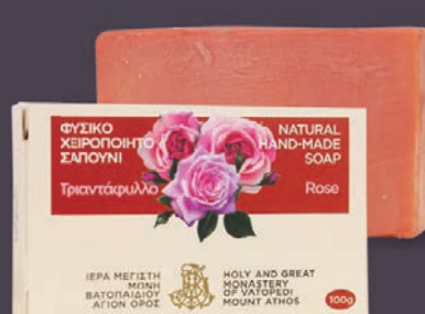
ΤΡΙΑΝΤΑΦΥΛΛΟ - $7.00