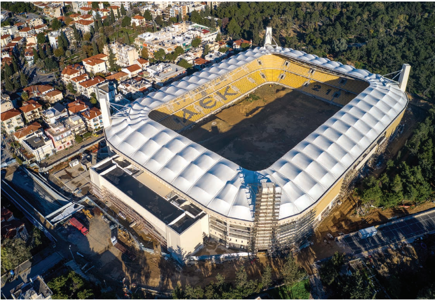
Στην «OPAP Arena» ο τελικός του Κόνφερενς Λιγκ το 2024

«Με το μαχαίρι στα δόντια» το μήνυμα του Σωκράτη εν όψει της «μάχης» με τους «πράσινους»