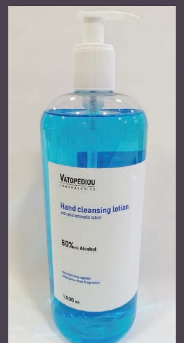
Hand Cleansing Lotion $20.00