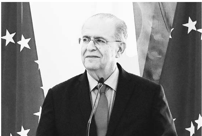
Η Κομισιόν οφείλει να γνωρίζει τις ιδιαιτερότητες των χωρών-μελών, διαμνύει ο Κύπριος ΥΠΕΞ.

Ο ΔΗΣΥ, σημείωσε, παρά την τουρκική επιθετικότητα και αλαζονεία, παραμένει προσηλωμένος στην, όσο το δυνατόν, συντομότερη επανένταξη των διαπραγματεύσεων και εξεύρεσης λύσης βασισμένης στις ίδιες αξίες που απαιτεί για την Ουκρανία.