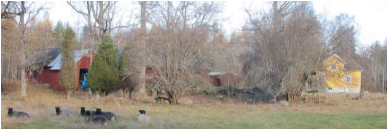
Gården A från madmarkerna i söder.