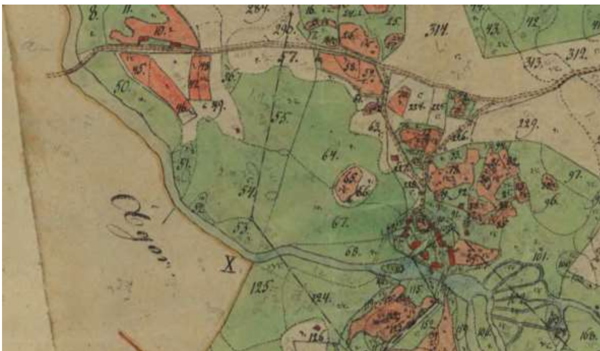
1835 års karta. Gården/byn ligger precis norr om vattnet. De båda broarna finns på samma lägen som idag. Bolstervägen syns gå i östvästlig riktning.

Gårdarnas bebyggelse låg koncentrerad i en tät klunga precis norr om södra bron, med ett par gårdar. 1833-34 genomfördes laga skifte. Det dröjde dock innan husen flyttades. 1880 uppfördes nuvarande mangårdsbyggnaden till gården B på ny tomt, norr om det gamla