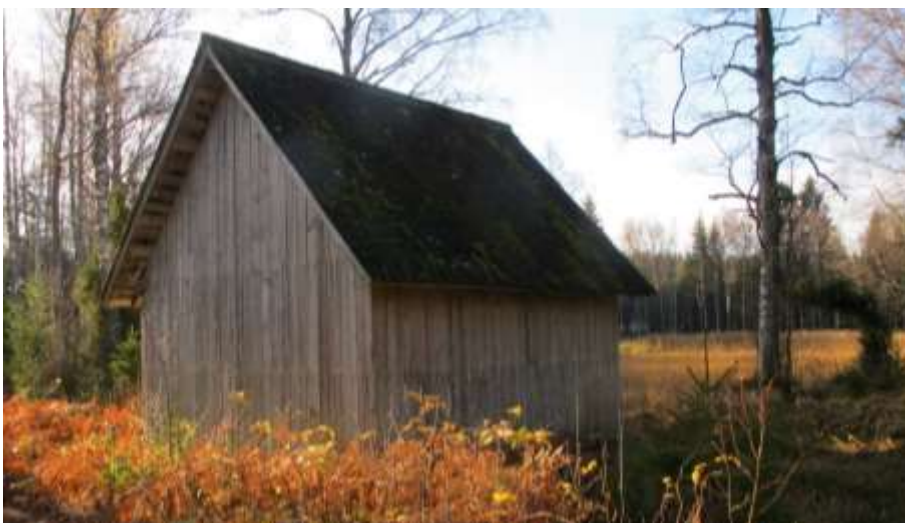
Den ängslada som ligger i mitten av de tre.