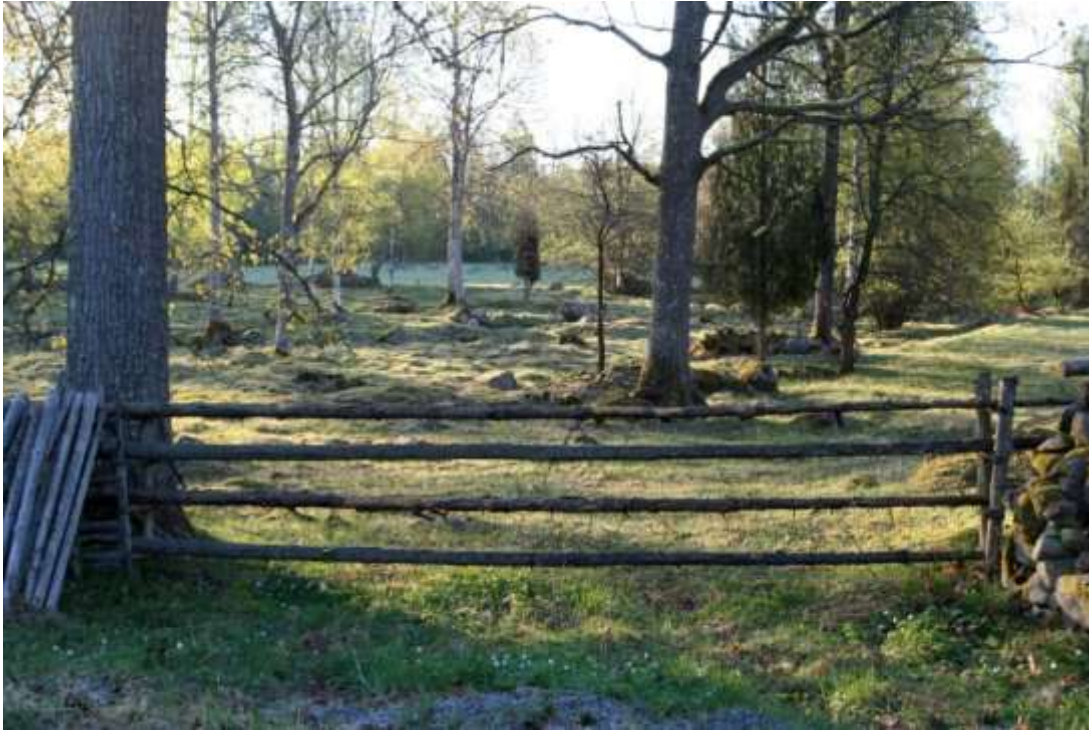
Naturreseptatet Huvudhultakvarn (Huvudhultakvarn 3:2) med många bevarade odlingsrösen och tre madhus.