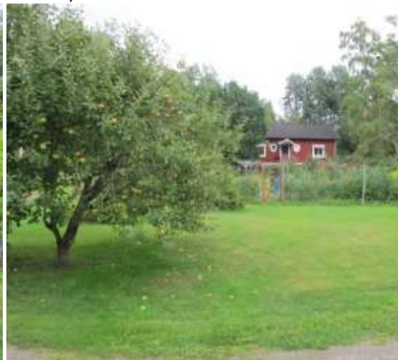
Stenkällare (hälften på Huvudhultakvarn 3:3/3:8), som kan vara från tiden då byn låg vid ån, dvs äldre än 1827. Bostadshuset på den tomt som tidigare var handelsträdgård. Äppelträden är troligen en rest från den tiden. (Huvudhultakvarn 3:6)