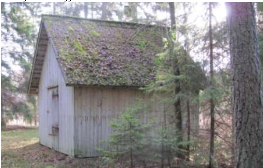
Den södra ängsladan ligger på fast mark i gammal granskog, men på kanten till de stora öppna madmarkerna vid Lyckebyån.