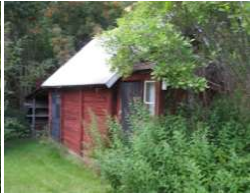
I stugan Stensborg bodde färgaren som drev det lilla färgeri som fanns i ån intill (idag borta). (Huvudhultakvarn 3:5).