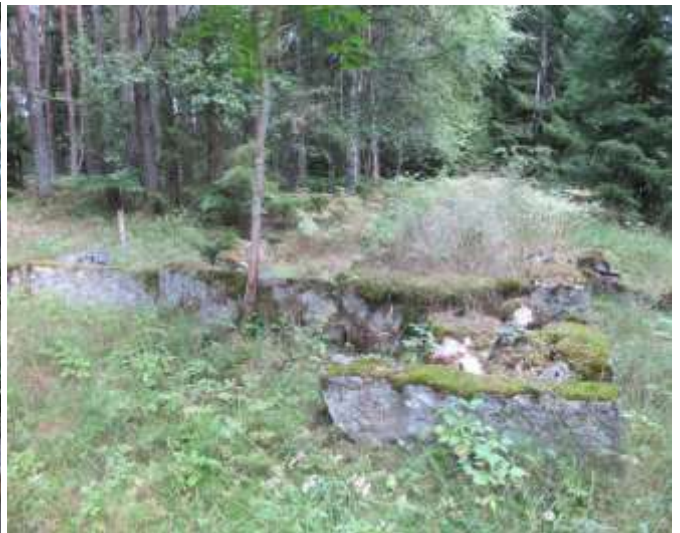
Två anseliga stengrunder finns kvar efter Grönahults bryggeri, troligen anlagt på 1880-talet av bryggaren Gustaf Peter Boije. Stengrund finns också från bryggarmästarens stuga och ladugård.