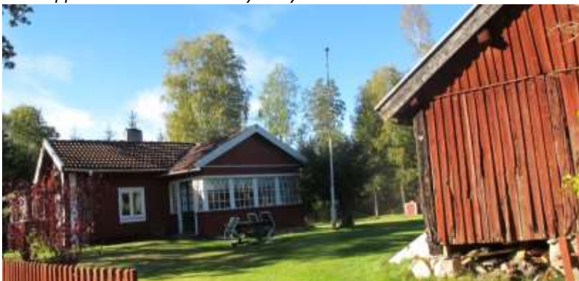
Svensholm är en annan bevarad torpmiljö längs den sk Bolstervägen (Huvudhultakvarn 3:10?).