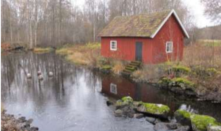
Tvättstugan till gården A (Huvudhultakvarn 3:2) med några spår av äldre åfåror (verksutlopp), samt madmarkerna söder om byn i bakgrunden. Tvättstugor är extra viktiga eftersom det finns så få bevarade och de är en av få byggnadskategorier som så tydligt hör samman med kvinnornas uppgifter i bondesamhället.