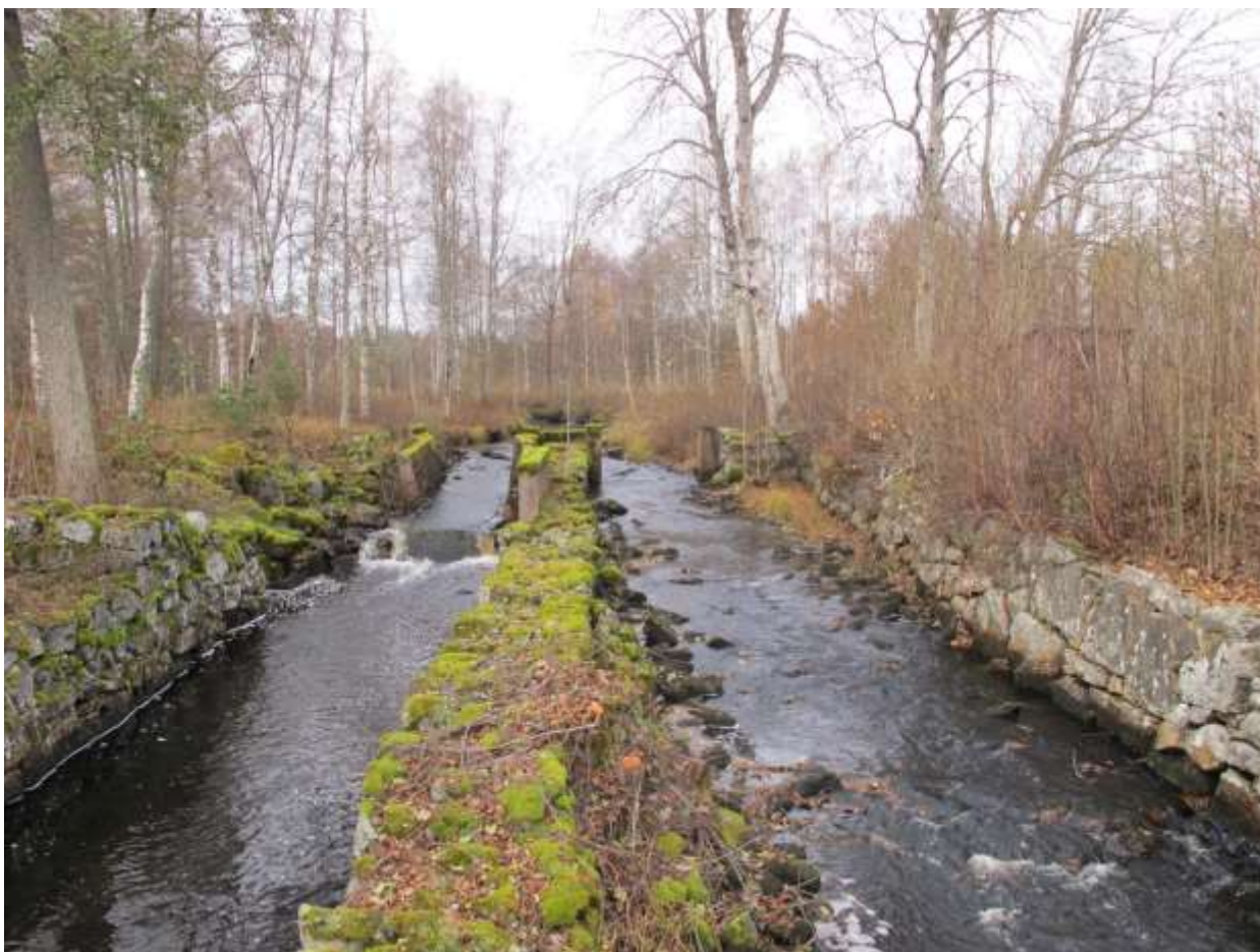
Spår från kvarnar i ån, väster om den södra bron. (Huvudhultakvarn 3:4)