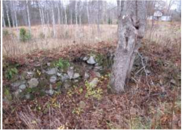
Stenstolpar mellan det som var grind in till den gamla gården, samt grunden efter en stenkällare.