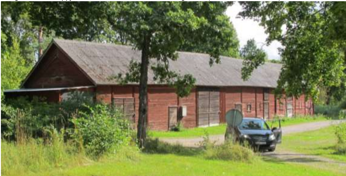
Ladugård och uthus till gården B. (Huvudhultakvarn 3:3).