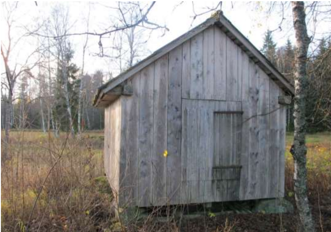
En av tre bevarade ängslador. Den första från norr, närmast gården.