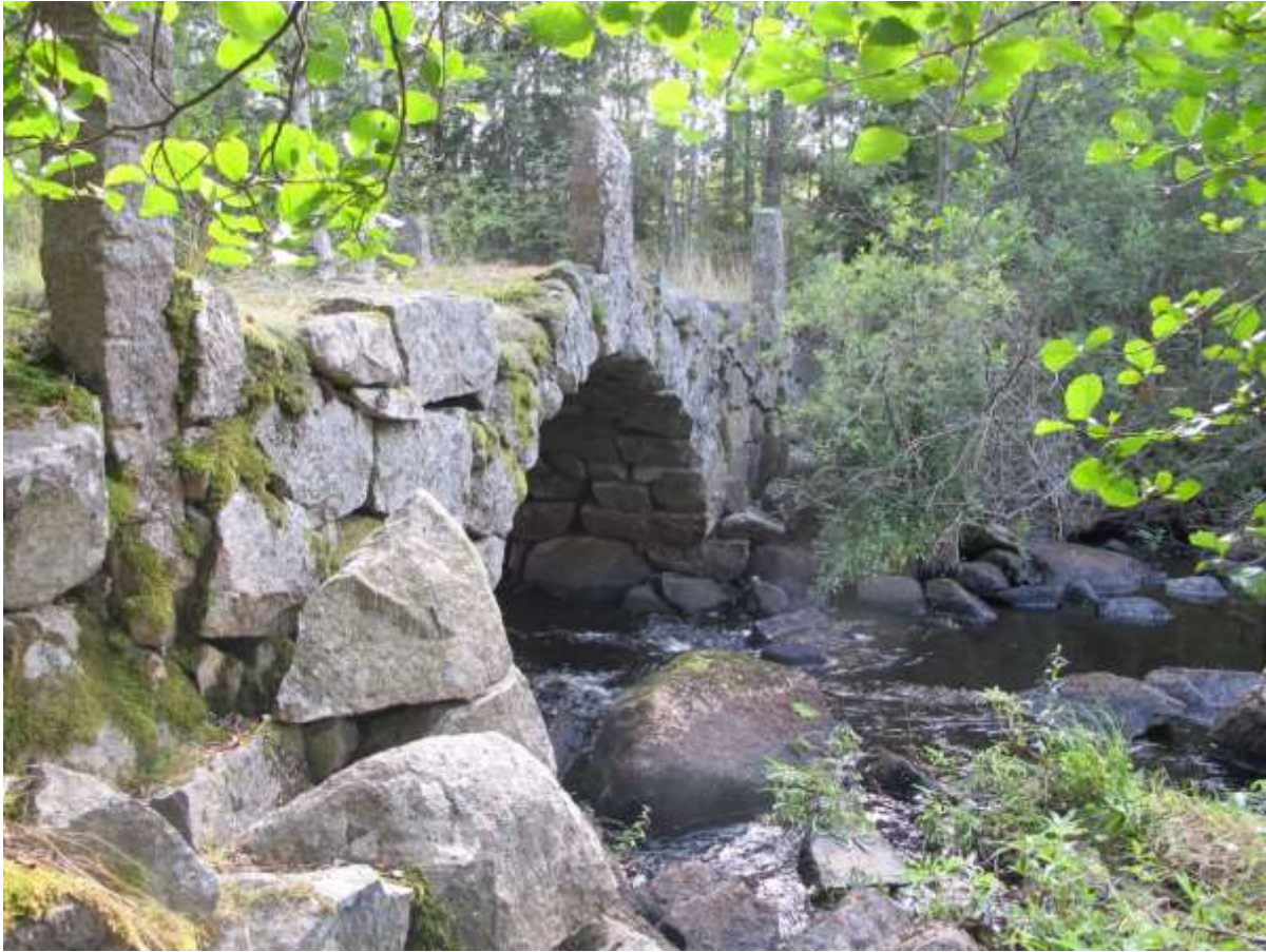
Den vackra stenvälsbron med två valv, nordväst om byn.