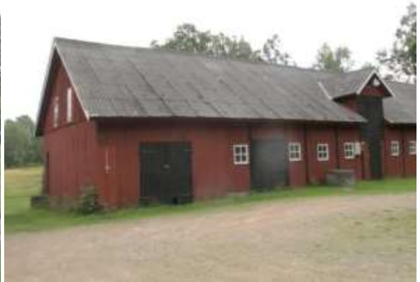
Gården A, Bergfors, flyttades ut (skiftades ut) och fick ny mangårdsbyggnad och ladugård 1892 (Huvudhultakvarn 3:2).