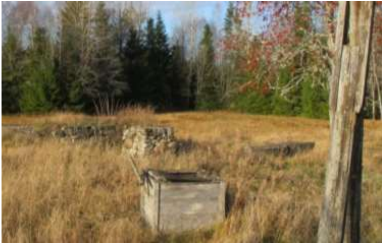
Stengrund och brunnsvinge vid brunn från mälteriet.