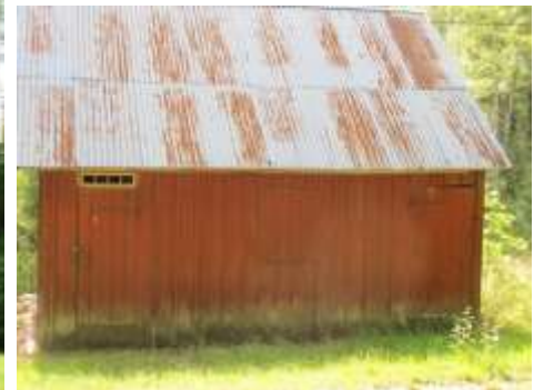
1880 uppfördes nuvarande mangårdsbyggnaden till gården B på ny tomt, norr om det gamla byläget. Den tillhörande ladugården hade uppförts 1865. Ett uthus hör också till gården. (Huvudhultakvarn 3:3)