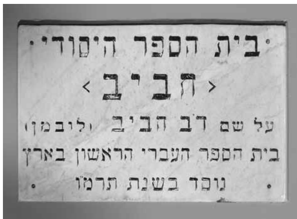
שלט על מבנה בית ספר 'חביב' בראשון לציון. השלט הוצב בשנות החמישים של המאה העשרים