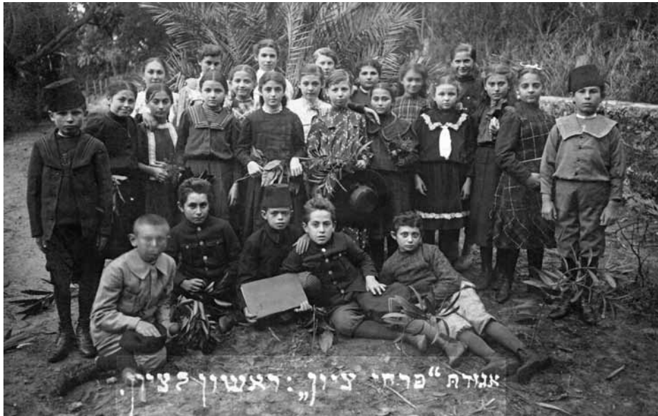
אגודת 'פּרַחֵי צִיּוֹן', ראשון לציון, 1908 (גלויה בהוצאת מ' פכטר ושות', קהיר ויפו)