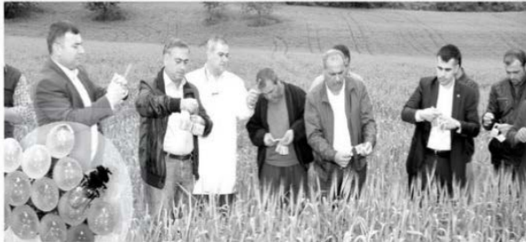
Süne'ye karşı biyolojik mücadelede kullanılan faydalı böceklerin, Süne yumurtalarını yüzde 95 oranında parazitleyerek yok ettiği belirlendi.