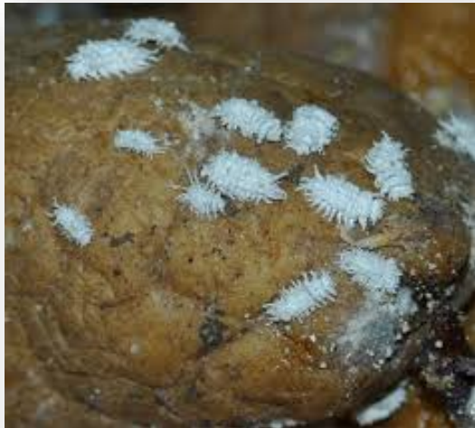
Cryptolaemus montrouzieri adult and larvae