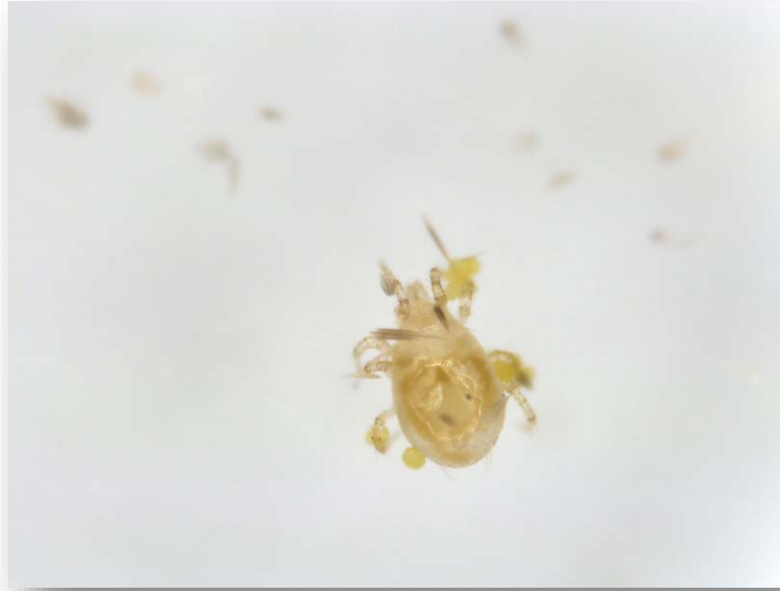
Amblyseius swirskii adult