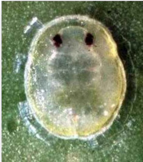
Japanese bayberry whitefly pupal stage