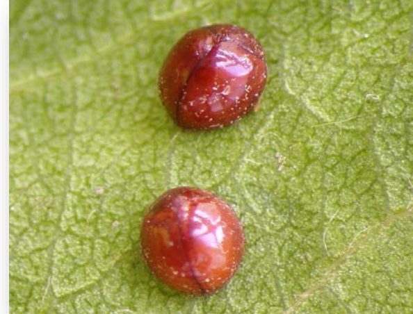
Adult Serangium parcesetosum