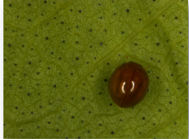
Adult Serangium parcesetosum