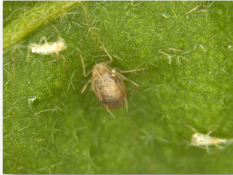
Aphidius colemani adult and parasitised aphid mummy