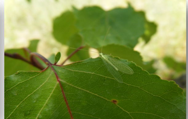
Chrysoperla carnea larvae, pupa, and adult