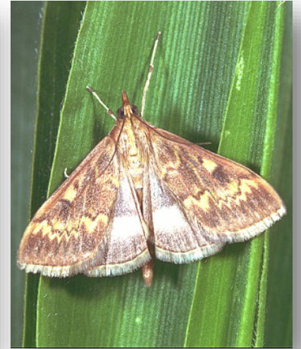
Parasitized and non-parasitized Ostrinia nubilalis eggs and adult individual