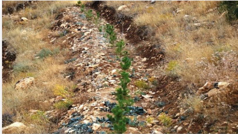
Beydağı Green Zone Project