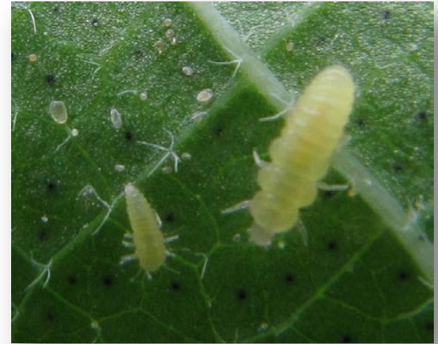
S. Parcesotosum larvae