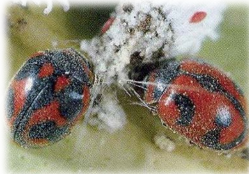
Adult Rodolia cardinalis