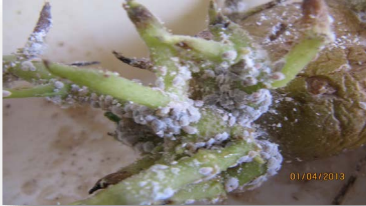
Citrus mealybug individuals