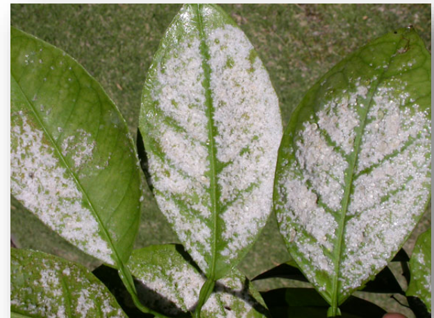
Damage of citrus woolly whitefly