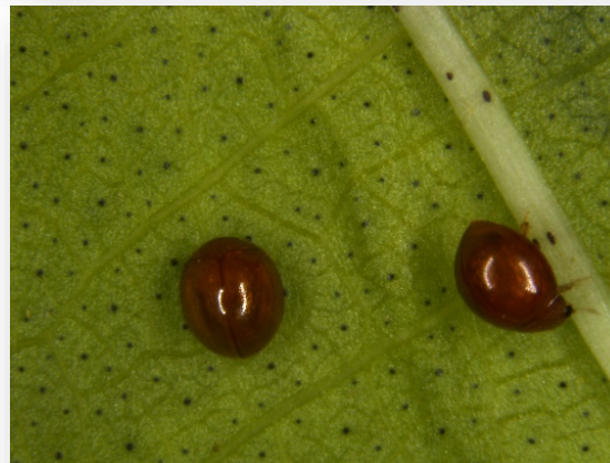
Adult S. Parcesotosum