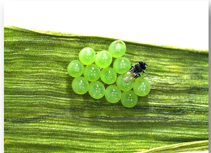
Adult Trissolcus semistriatus and sunn pest eggs