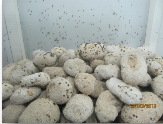
Aspidiotus nerii )