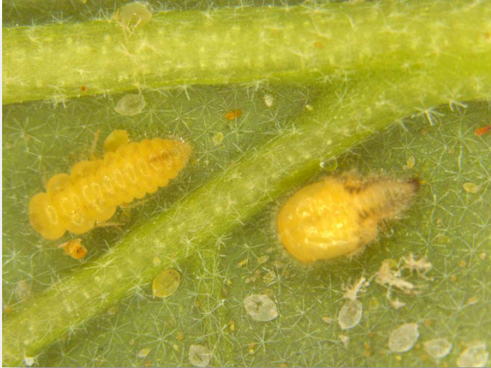
Larvae and pupa of S.parcesotosum