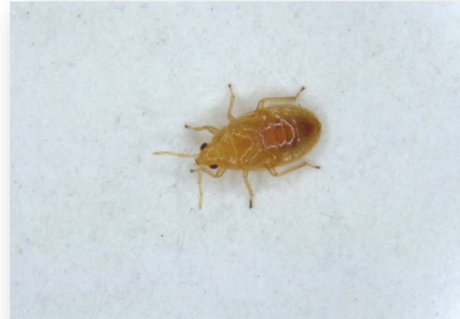
Orius laevigatus adult and nymph