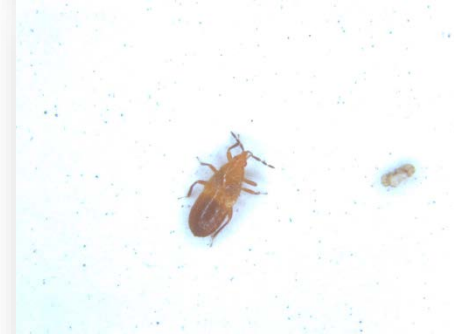
Anthocoris minki nymph and adult