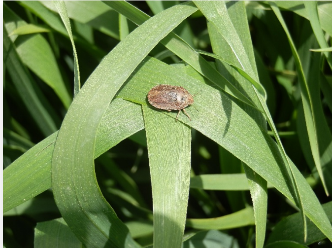
Sunn pest eggs and adult