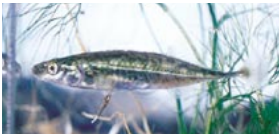
トミヨ 県域絶滅危惧 類 Pungitius sinensis (Guichenot)