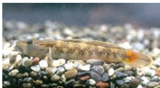
トウヨシノボリ 県域準絶滅危惧 Rhinogobius sp. OR