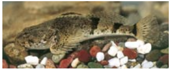
カマキリ(地方名, アラレガコ) 県域絶滅危惧 類 Cottus kajika Jordan et Starks