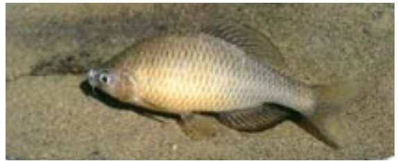
アブラボテ 県域絶滅危惧 類 Tanakia limbata (Temminck et Schlegel)