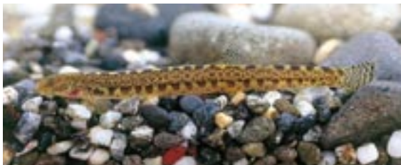
アジメドジョウ 県域絶滅危惧 類 Niwaella delicata (Niwa)