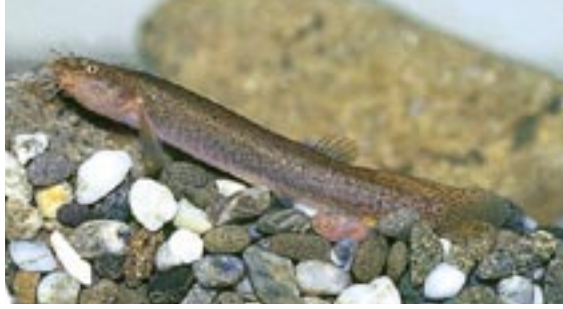
ホトケドジョウ 県域絶滅危惧 類 Lefua echigonia Jordan et Richardson