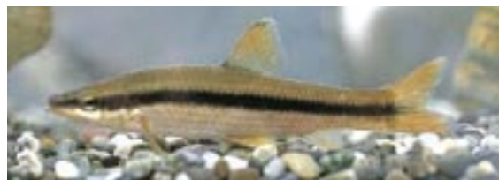
ムギツク 県域準絶滅危惧 Pungtungia herzi Herzenstein