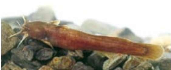
アカザ 県域絶滅危惧 類 Liobagrus reini Hilgendorf