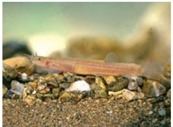
ナガレホトケドジョウ 県域絶滅危惧 類 Lefua sp .