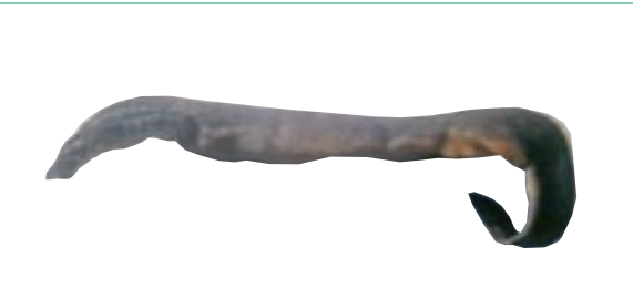
カワヤツメ 県域絶滅危惧 類 Lamptera japonica (Von Martens)