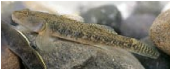
カワヨシノボリ 県域絶滅危惧 類 Rhinogobius flumineus (Mizuno)