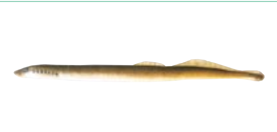
スナヤツメ 県域絶滅危惧 類 Lamptera reissneri (Dybowski)