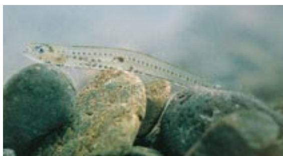
シロウオ(地方名, イサザ) 県域準絶滅危惧 Leucopsarion petersi Hilgendorf