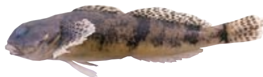
回遊型カジカ 要注目 Cottus sp.