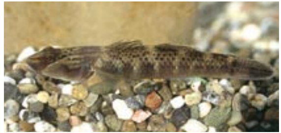
クロヨシノボリ 県域絶滅危惧 類 Rhinogobius sp. DA