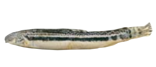
スジシマドジョウ 県域絶滅危惧 類 Cobitis tania striata Ikeda