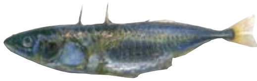
降海型イトヨ 県域絶滅危惧 類 Gasterosteus aculeatus (Linnaeus)