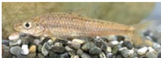
イトモロコ 県域準絶滅危惧 Squalidus gracilis gracilis (Temminck et Schlegel)