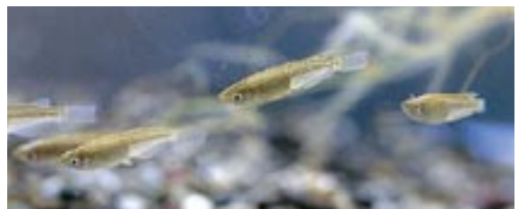
メダカ 県域絶滅危惧 類 Oryzias latipes (Temminck et Schlegel)