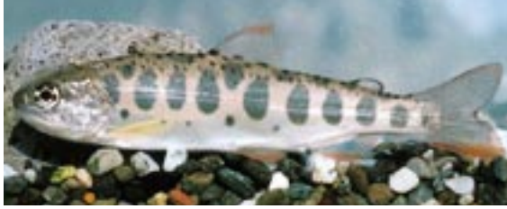
ヤマメ 県域絶滅危惧 類 Oncorhynchus masou (Brevoort)