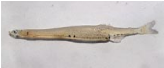
シラウオ 県域絶滅危惧 類 Salangichthys microdon Bleeker