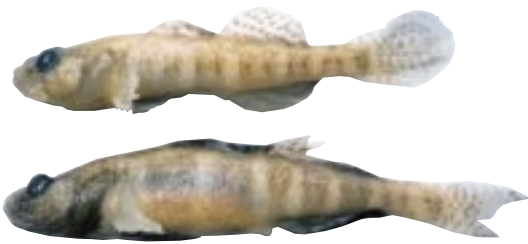
ジュズカケハゼ 県域絶滅危惧 類 Chaenogobius laevis (Steindachner)