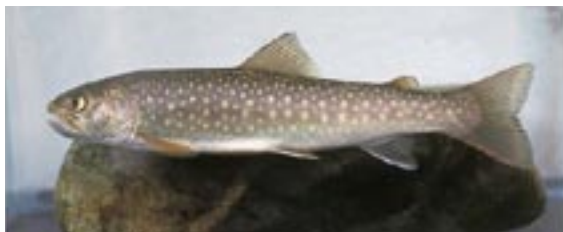
イワナ 県域絶滅危惧 類 Salvelinus leucomaenis (Pallas)