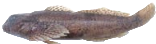
カジカ 県域準絶滅危惧 Cottus polluxs Günther