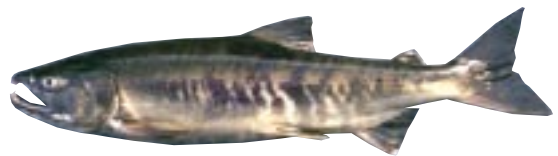
サケ 県域準絶滅危惧 Oncorhynchus keta (Walbaum)