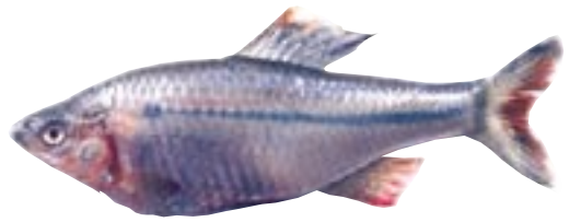
イチモンジタナゴ 県域絶滅危惧 類 Acheilognathus cyanostigma Jordan et Fowler