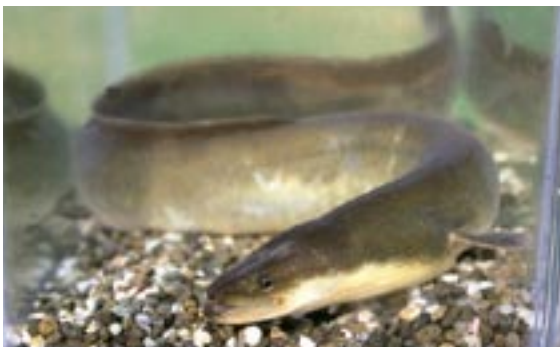
ウナギ 県域準絶滅危惧 Anguilla japonica Temminck et Schlegel