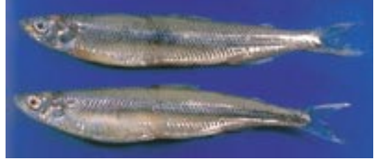
ワカサギ 県域絶滅危惧 類 Hypomesus transpacificus nipponensis (Dybowski)