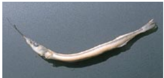
クルマサヨリ 県域絶滅危惧 類 Hemiramphus kurumeus (Jordan et Starks)