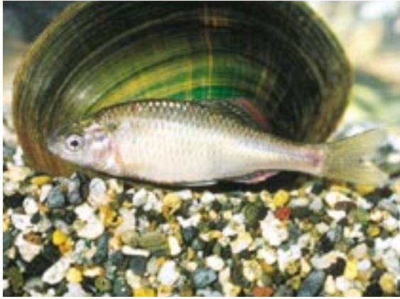
アカヒレタビラ 県域絶滅危惧 類 Acheilognathus tabira subsp. 1