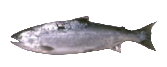
サクラマス 県域絶滅危惧 類 Oncorhynchus masou (Brevoort)