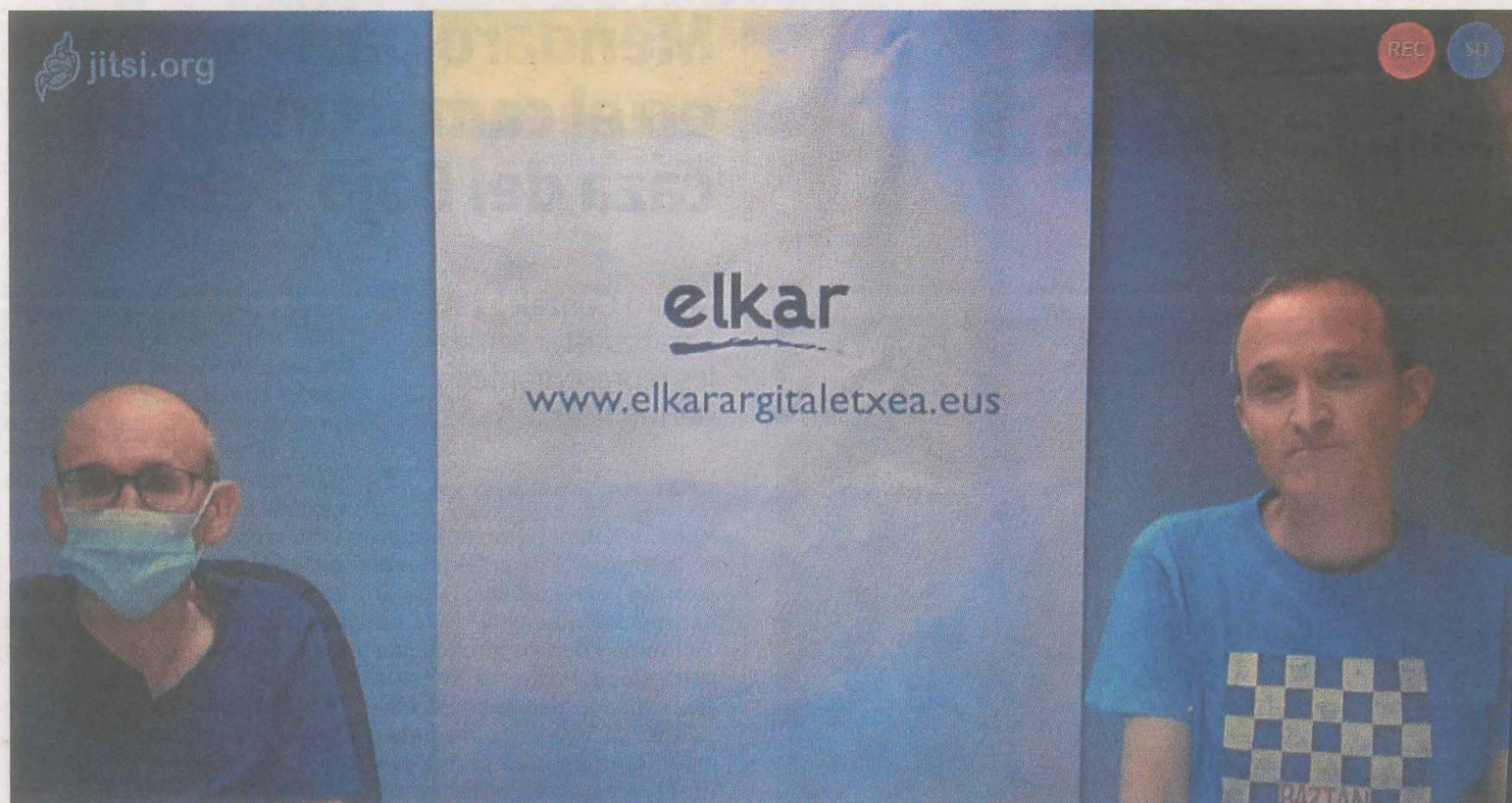
Xabier Mendiguren eta Eneko Aizpurua aurkezpenaren une batean. SALEGI