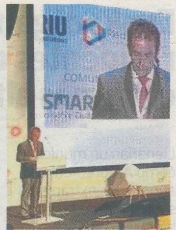
El alcalde, en la clausura.

—Reivindica su recuperación. —Sí, la recuperación del pasado y, en definitiva, del presente. En Bilbao no se recuerda que ha sido una ciudad industrial. Que conste que, en general, me gusta cómo está Bilbao ahora. Antes era gris, pero ahora la gente piensa que Bilbao siempre ha sido así. Me da rabia que al menos no conozcan esa historia industrial. Han dejado 'La Carola'. Es de risa. En Bilbao van a cometer ahora otra atrocidad, que es la del proyecto de la estación de Abando. Van a mantener la vidriera. La estructura es preciosa y se la van a cepillar. Estamos haciendo ciudades todas iguales y el encanto reside en apreciar lo que tenemos de pasado. Debemos enseñar nuestras raíces y ahí sí puedes competir con otras ciudades, porque tienes algo único. —Las fotos son del interior ¿Ha costado pedir los permisos? —(Ríe). He entrado como he podido, porque si pides permisos no te dan. Cuando me han pillado, he pedido perdón. No he podido hacer otra cosa.