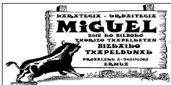
Drogeteniturrri, 245 zkia.

Lan berezia da, eramaten jakin behar da.