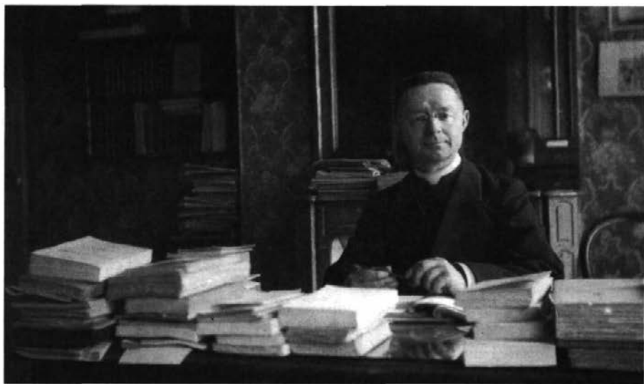
Lionel Groulx au travail dans sa chambre de l'hôtel Jean-Bart, 1 er mars 1922.

Une longue promenade au Quartier latin lui fait revivre le voyage de 1921-1922, revoir l'hôtel Jean-Bart, rue Cassette, où il était descendu, et constater de nouveau que le Canada reste « ignoré si profondément même des Français qui prétendent le connaître ». Il en retient « les nombreuses vitrines de librairies de toute espèce et l'extraordinaire activité intellectuelle des Français, activité toujours intense et persévérante. Beaucoup de paille, sans doute, en ce grain. [Mais] quand même, quel effort cérébral. Et quelle influence serait encore celle de la France dans le monde, si toute cette production intellectuelle pivotait davantage autour du pôle de la Vérité. 52 »