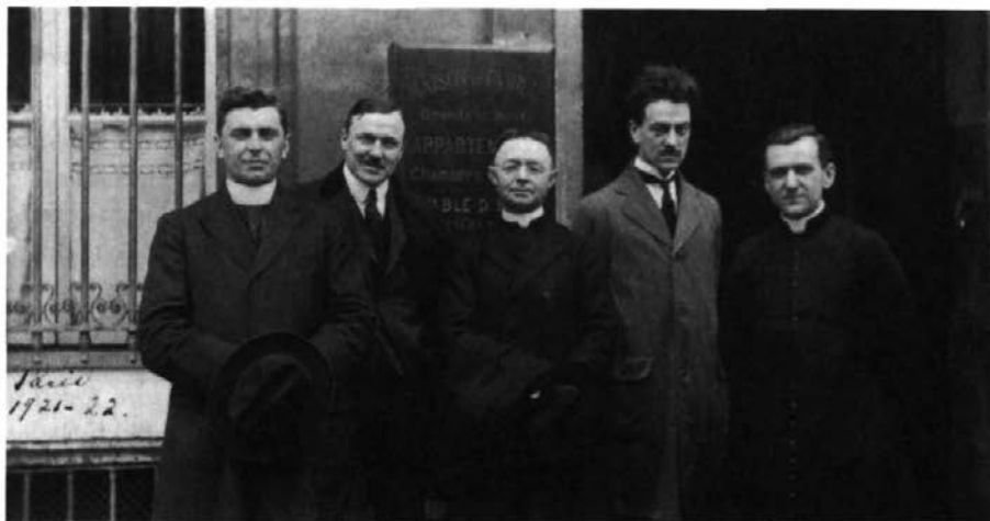
Lionel Groulx, au centre, et des membres du Comité de propagande canadienne-française à Paris, 1921 ou 1922.