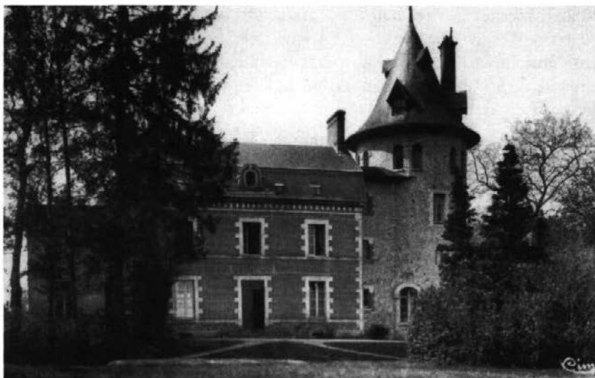
Château de Saint-Père, propriété de Rameau à Adon (Loiret), qui a vu défilé nombre de Canadiens français, tel qu'on pouvait encore le voir dans l'entre-deux-guerres.