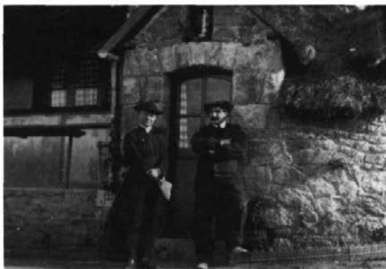
Lionel Groulx et Théodore Botrel devant Ti-Chansonniou, maison de ce dernier à Port-Blanc (Bretagne), 10 août 1908.

Groulx fait cinq voyages en Europe. De 28 à 31 ans, en 1906-1909, il séjourne pour la première fois sur le vieux continent, pour y parfaire sa formation : doctorats en philosophie et en théologie à Rome, études de lettres à Fribourg (Suisse), que la maladie interrompt, l'empêchant d'obtenir la licence. C'est alors un étudiant, sans prestige ni réputation.