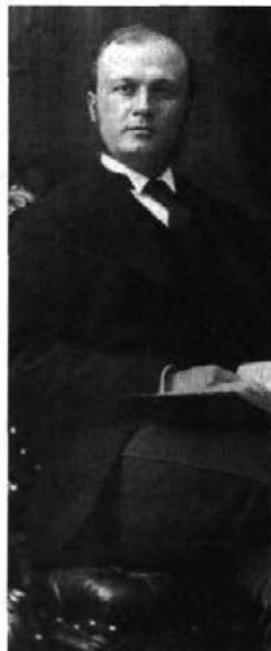
Siméon Le Sage vers 1880. ( Joliette-Journal , 12 mars 1980, p. E-12)

Sage (1835-1909) l'illustre à merveille 11 . Conservateur et catholique mais antiultramontain, croyant sincère, respectueux de la mission sociale de l'Église, mais partisan d'un rôle accru de l'État dans le développement économique, social et culturel, ruraliste mais partisan du chemin de fer et de l'industrialisation, loyalement attaché à la France mais méfiant à son égard, favorable à l'immigration française, belge et suisse mais inquiet de sa qualité, il a entretenu une correspondance éclairante avec des membres du réseau des amis du Canada en France, en particulier avec le leplaysien Edme Rameau de Saint-Père, fondateur de la Société canadienne d'économie sociale de Montréal.