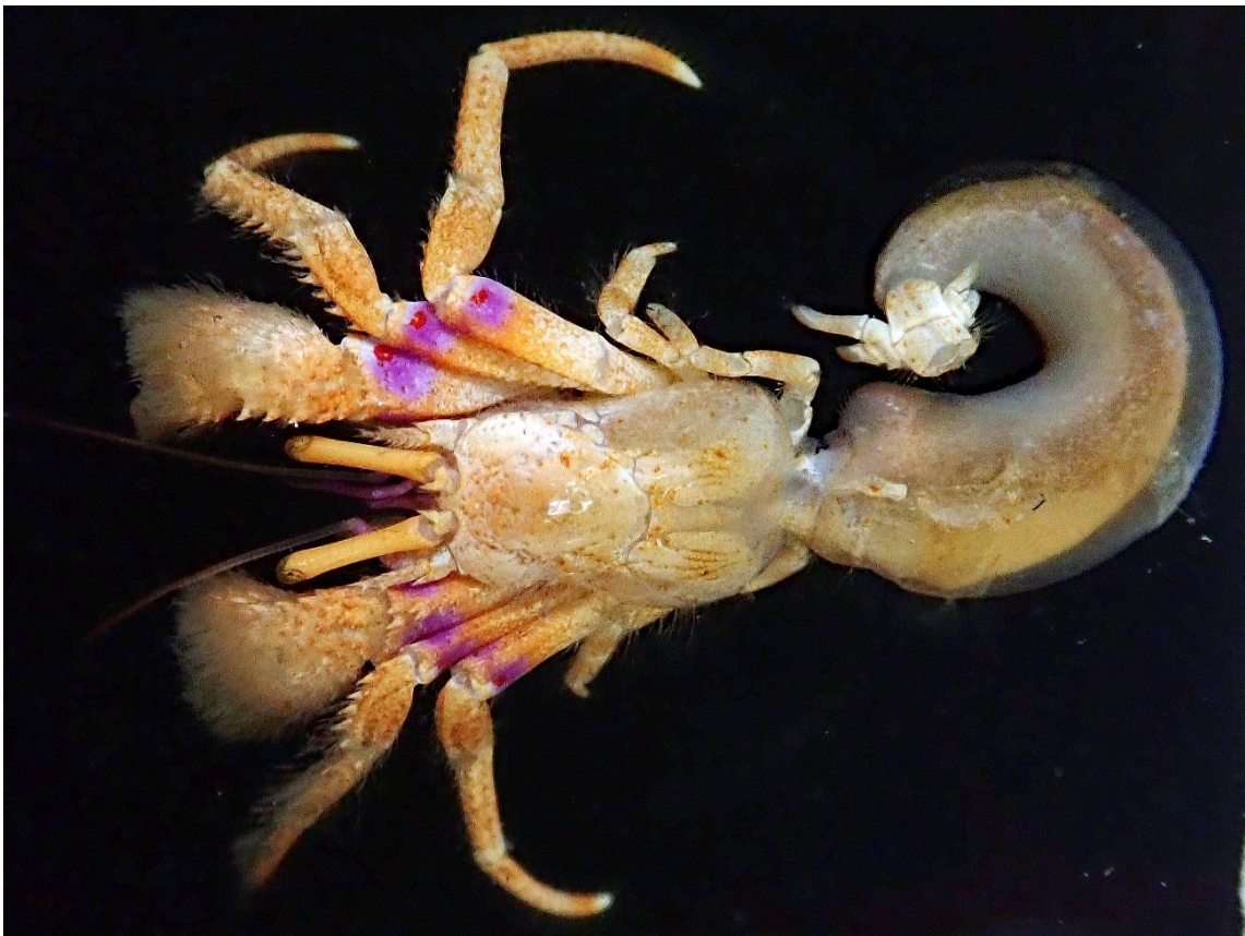
図 25. Paguristes gonagrus (H. Milne Edwards, 1836) ヒノマルヒメヨコバサミ, 鳥取県鳥取市長尾鼻沖, オス (sl 6.4 mm).

本種の宿貝の表面は, Epizoanthus ramosus Carlgren 1934 (ヤドリスナギンチャク科 Epizoanthidae)の群体に覆われる (峯水, 2002; Komai, 2010; Reimer et al., 2010).