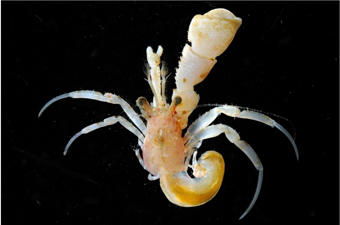
図 28. Anapagurus japonicus Ortmann, 1892 ユミナリヤドカリ, 島根県隠岐の島町四敷島東 (隠岐諸島島後), オス (sl 2.4 mm).