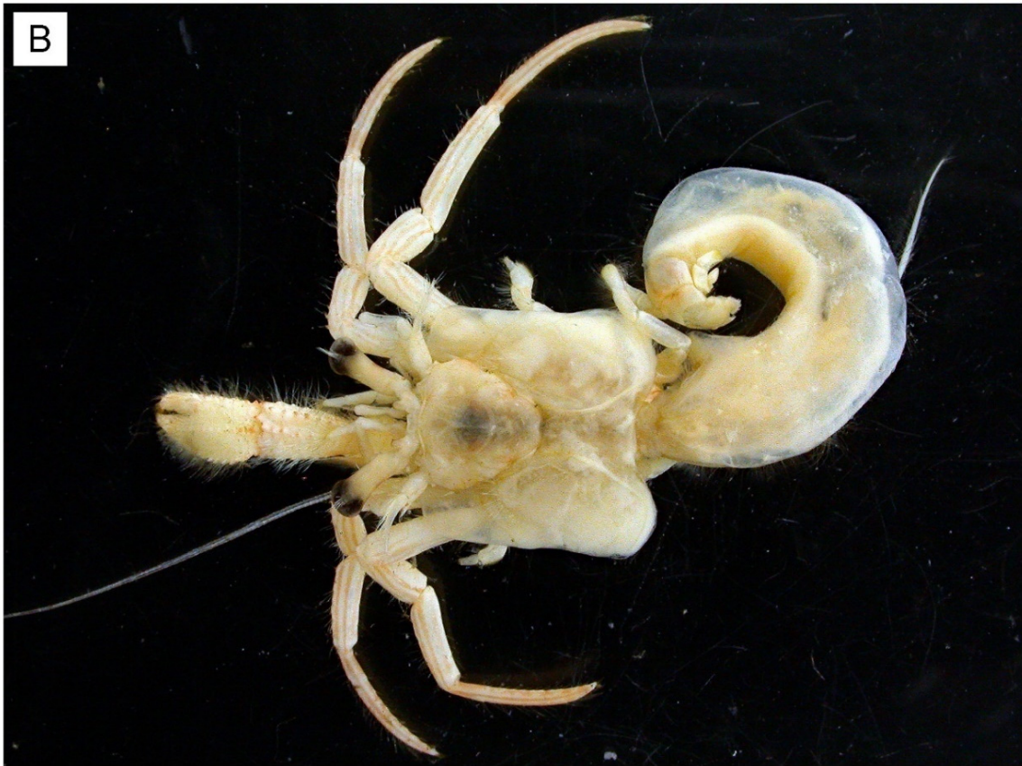
図 32. Nematopagurus australis (Henderson, 1888) ツメナガイトヒキヤドカリ, 鳥取県鳥取市長尾鼻沖, メス (sl 4.3 mm) (A); 同, エタノール液浸 (B).