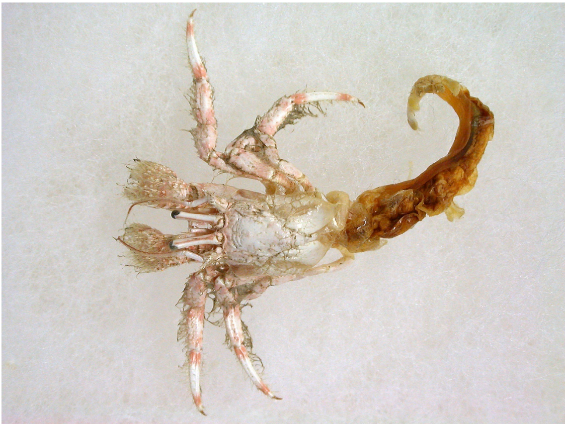
図 24. Paguristes digitalis Stimpson, 1858 ヤスリヒメヨコバサミ, 鳥取県琴浦町赤碕, 性未確認個体 (sl 未測定), 乾燥.

Komai (2001)は, 本種を詳細に再記載している. 加えて, Paguristes kagoshimensis Ortmann, 1892 のシタイプ (総模式標本)を再検討し, それが実際にはヤスリヒメヨコバサミ Paguristes digitalis Stimpson, 1858 であることを判明させるとともに, それまで「カゴシマヒメヨコバサミ P. kagoshimensis 」として報告されていた記録・標本について, 分類学的整理を行っている (Komai, 2001).