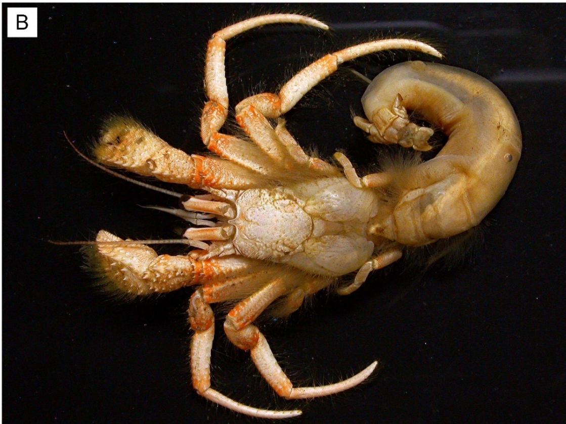
図 27. Paguristes versus Komai, 2001 カゴシマヒメヨコバサミ, 鳥取県鳥取市長尾鼻沖, オス (sl 5.8 mm) (A); 同, エタノール液浸 (B).