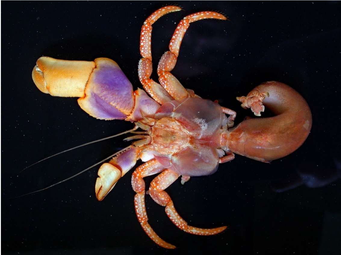
図 30. Ellassochirus cavimanus (Miers, 1879) ゴトウヤドカリ, 島根県浜田市沖, オス (sl 17.0 mm).