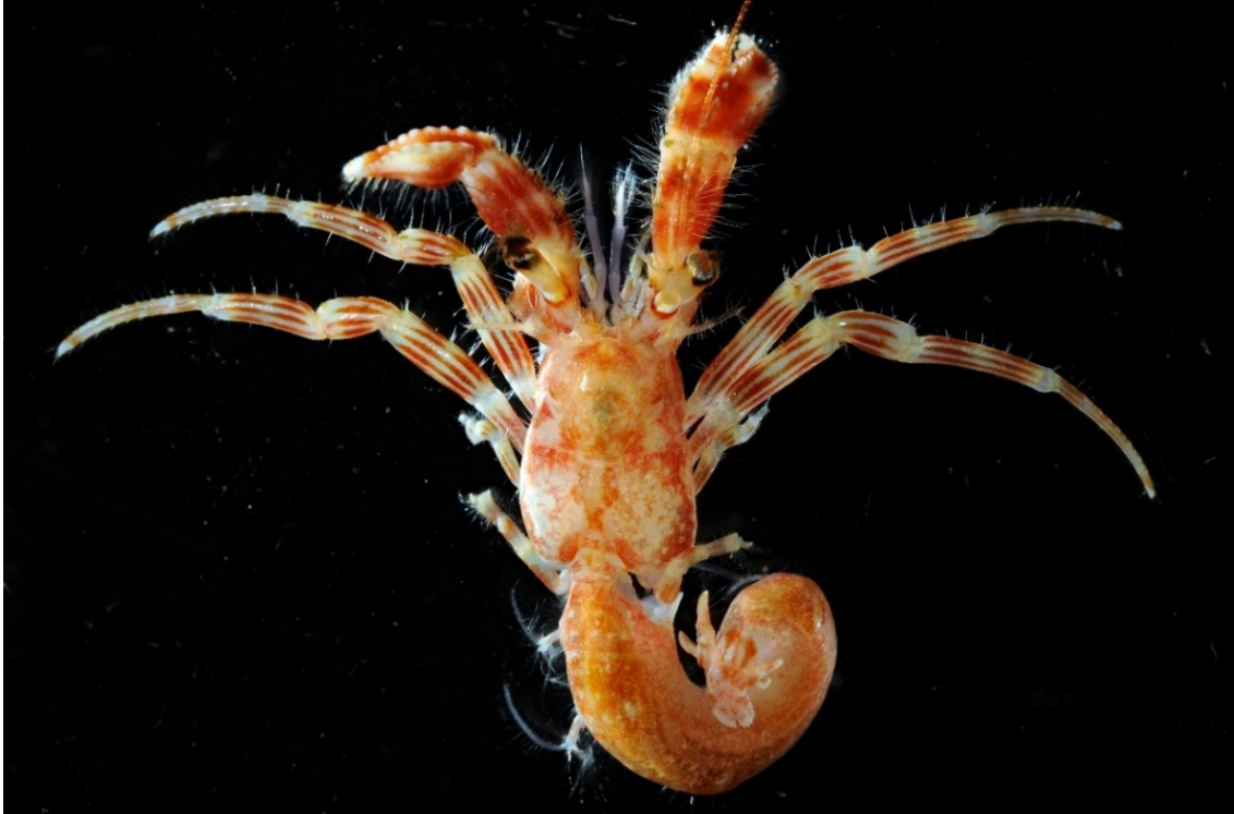
図 33. Nematopagurus tricarinatus (Stimpson, 1858) イトヒキヤドカリ, 島根県隠岐の島町四敷島東 (隠岐諸島島後), 1 メス (sl 3.4 mm).

イトヒキヤドカリは, N. vallatus に形態が類似するが, 左右鉗脚の掌部背面の竜骨状隆起の間にこぶ状突起を欠くことで後者から区別できる (McLaughlin, 2004).