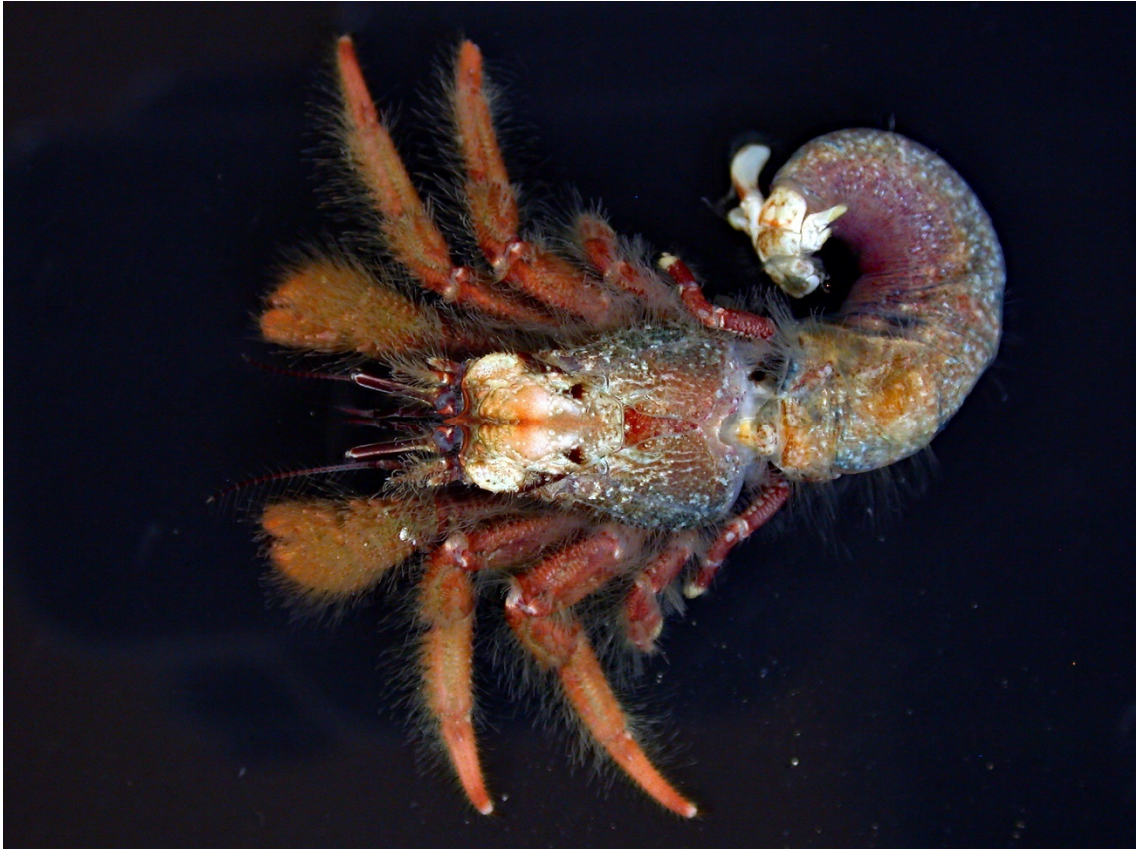
図 26. Paguristes ortmanni Miyake, 1978 ケブカヒメヨコバサミ, 島根県松江市島根町小具,オス (sl 9.8 mm).