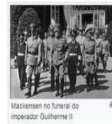
Mackensen no funeral do imperador Guilherme II

De acordo com um noticiário de rádio datado de 15 de abril de 1945, arquivado pelo correspondente da CBS News Larry LeSueur para World News Today, Mackensen foi rapidamente capturado pelo Segundo Exército britânico em sua casa durante as últimas semanas da