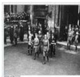
Mackensen e Hitler em 1935 durante o Heilengedenktage em Berlim

Durante a eleição presidencial alemã de 1932, Mackensen apoiou Paul von Hindenburg contra Hitler, mas depois que Hitler ganhou o poder em 1933, Mackensen tornou-se um visível, talvez apenas simbólico, apoiante do regime nazista.