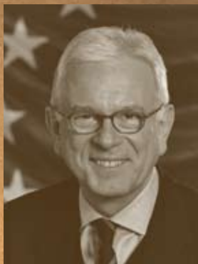
Hans-Gert Pöttering Europaparlamentets talman

"Fred, framsteg och mänskliga rättigheter – dessa tre mål är för alltid sammanbundna, och att nå ett av målen är omöjligt om de andra två förbises."