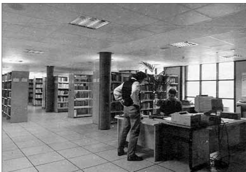
Munduko edozein hizkuntza ikasteko material ugari dago HABEko liburutegian.