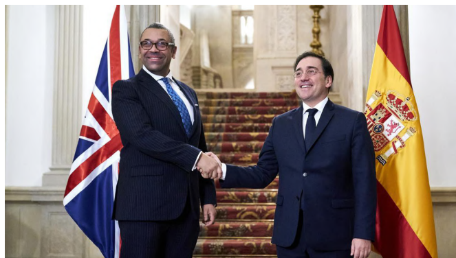
El ministro de Asuntos Exteriores, Unión Europea y Cooperación, José Manuel Albares, recibe a su homólogo británico, James Cleverly

Dirección: 63 North Castle Street, Edinburgh EH2 3LJ. Tel.: 0044 (0) 131 220 18 43. Fax: 0044 (0) 131 226 45 68. Correo Electrónico: cog.edimburgo@maec.es Twitter: @CGEspEdimburgo