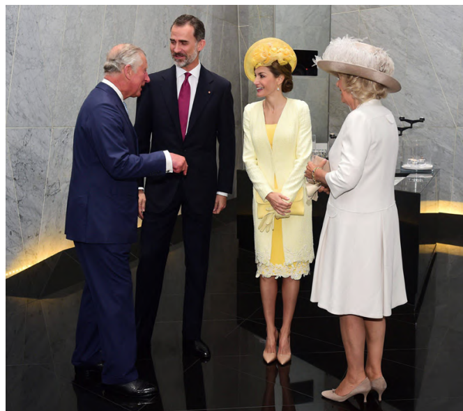
Encuentro de SS.MM. Los Reyes de España D. Felipe y D a Letizia con el Príncipe Carlos y la Duquesa de Cornwall, con motivo de la visita a Reino Unido en julio de 2017.- @Cordon Press

Fuente: S.G. de Inversiones Exteriores (Registro de Inversiones. marzo 2023)