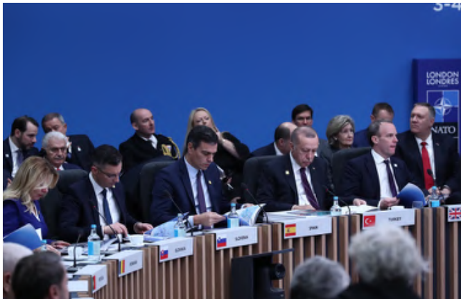
El presidente del Gobierno español D. Pedro Sánchez en la Cumbre d OTAN Londres (Reino Unido), 4 de diciembre de 2019.

Esta cercanía se constata en las habituales visitas de alto nivel. En julio de 2017, SS.MM. los reyes de España realizaron una visita de Estado al Reino Unido. En junio de 2019, la reina Isabel II impuso a Felipe VI al Orden de la Jarretera. En marzo de 2019, la reina Letizia inauguró una exposición sobre Sorolla en la National Gallery. En abril de 2022, la Reina acompañó al entonces Príncipe de Gales a la inauguración en Durham de una exposición sobre Zurbarán. En septiembre de 2022, SS.MM. asistieron al funeral de Isabel II.