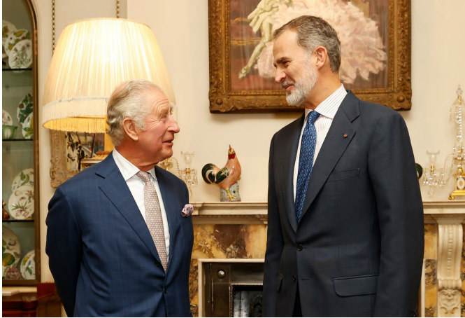
Su Majestad el Rey Carlos III y Su Majestad el Rey durante el encuentro privado en Clarence House. Clarence House. Londres (Reino Unido), 21.11.2022.

Junio 2019: SS MM los reyes (la reina Isabel II concede la Orden de la Jarretera al rey Felipe).