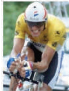
MIGUEL INDURAIN (CICLISMO)