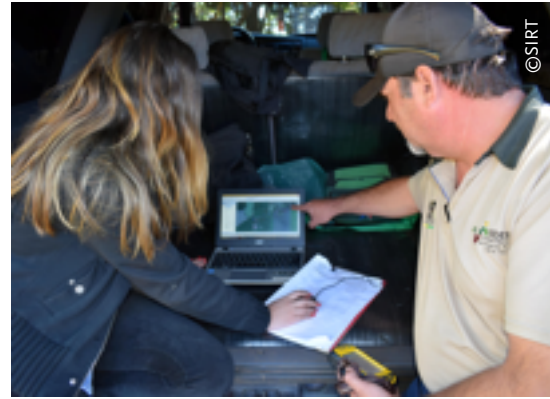
Imagen 2. Relevamiento de información geográfica en campo.

El sistema de información desarrollado en el marco del SIRT fue una herramienta clave para agilizar los procesos y asegurar el goce de los derechos de tenencia, a precios asequibles y mediante procedimientos transparentes. Todos los procesos están informatizados y automatizados, y los datos seguros en un almacenamiento en la nube. La transmisión automática de información entre los diferentes entes responsables por la titulación permite mejorar la rapidez y eficacia del procedimiento.