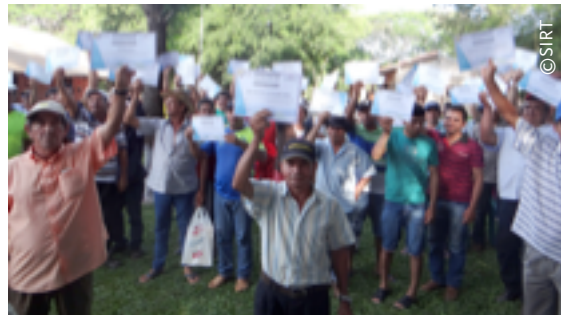
Imagen 4. Entrega de certificados de adjudicación de lotes agrícolas.

Este documento ha sido elaborado en base al documento de “3 años de gestión del SIRT”, así como a los datos, entrevistas e información facilitada por el equipo del SIRT y el equipo de FAO Paraguay.