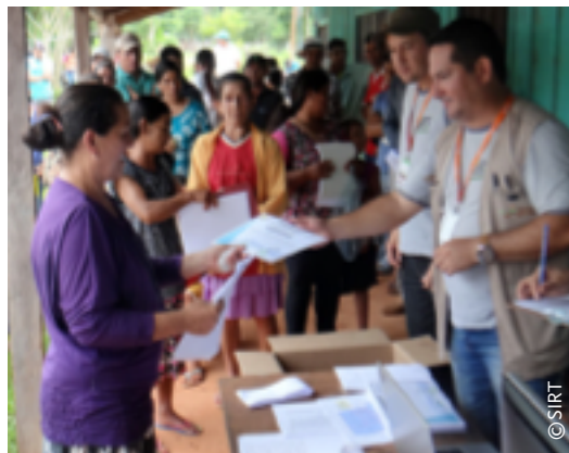
Imagen 1. Entrega de certificados de adjudicación.

Desde el 2014 se ha implementado un sistema de control y evaluación mediante el llamado Tablero de Control -Presidencial, herramienta que busca contribuir a la gestión pública eficiente y transparente, como estrategia para el Plan Nacional de Desarrollo 2030. Los esfuerzos institucionales son monitoreados con este tablero. En constante actualización y libre de acceso contribuye a la transparencia. En este tablero también se muestra la cantidad de servicios brindados por cada institución, las metas a ser alcanzadas y los avances de los mismos.