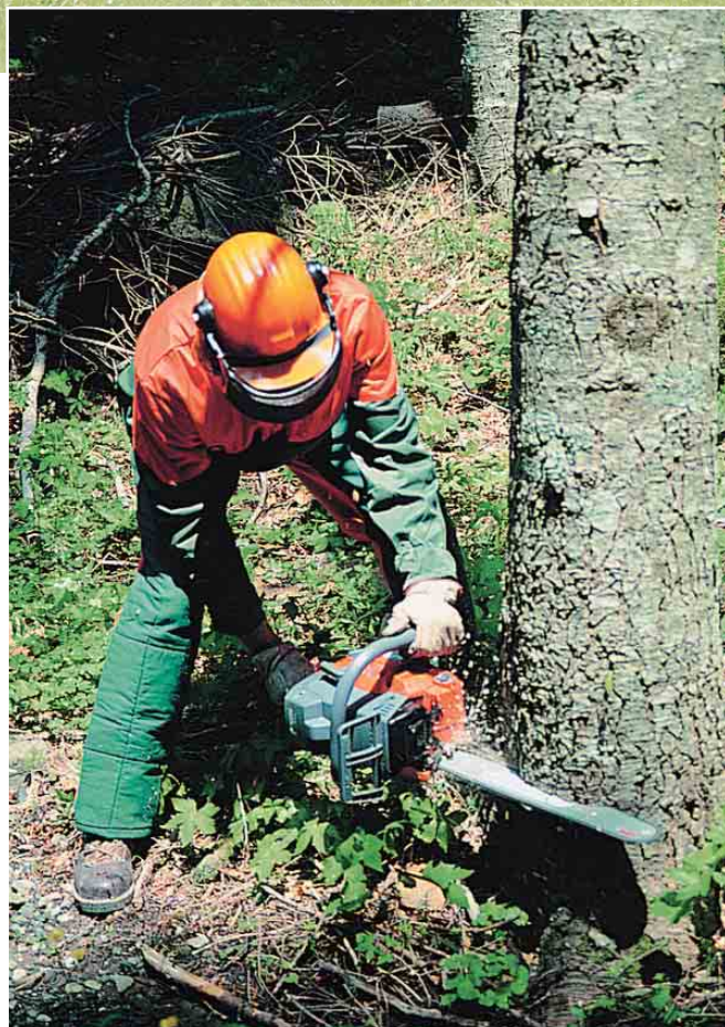
Sotto/Below: motosega professionale Professional chainsaw Oleo-Mac

This enabled us to make a heavy investment in quality, shifting from primarily agricultural users to gardening and green maintenance as an increasingly broad market".