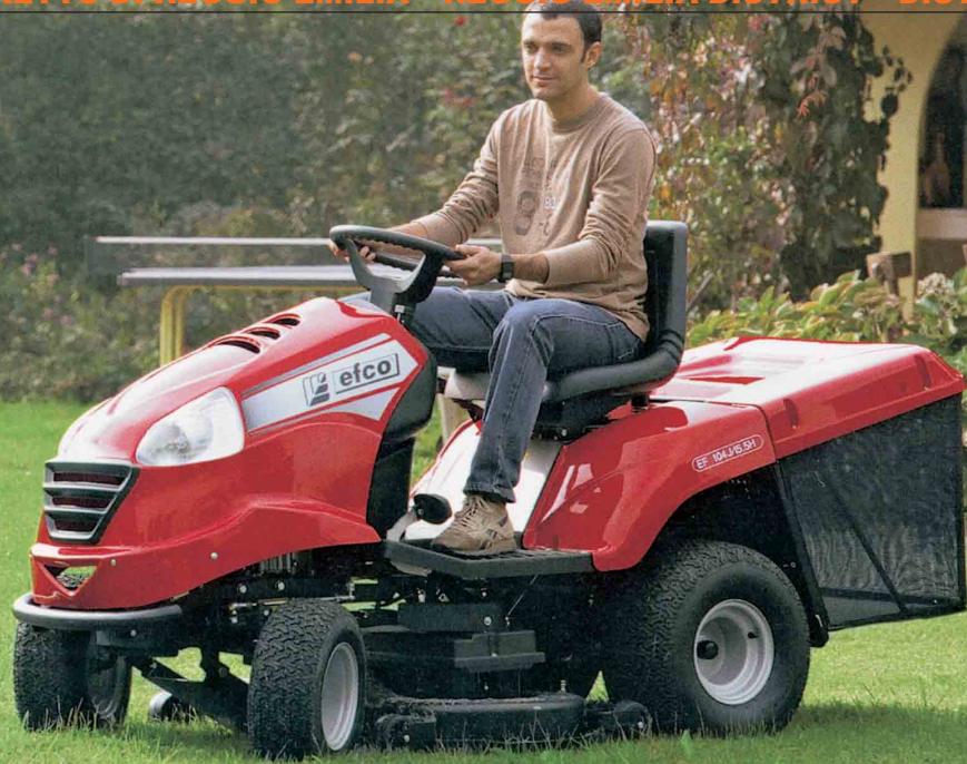
Trattorino professionale a scarico posteriore per grandi superfici EF 104 J da 15,5 CV/Rear-discharge garden tractor for large areas EF 104 J, with 15,5 HP