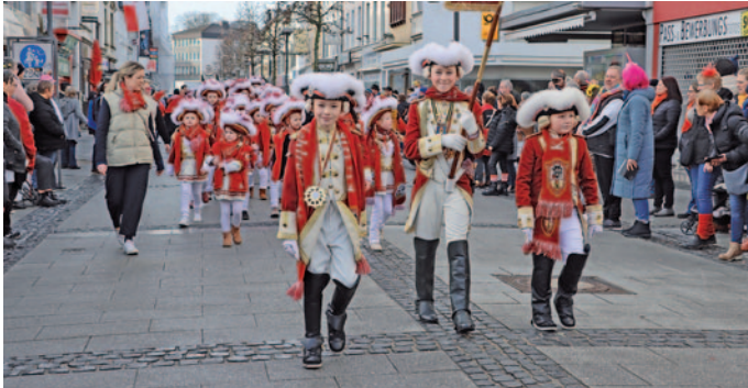
Auch die Kinder und Jugendlichen der KGs stürmten mit Freude das Rathaus.