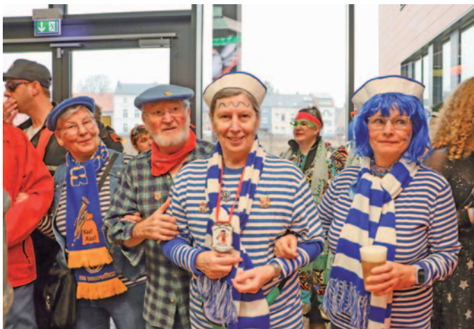
Die Jecken schunkelten bereits bei der offiziellen Eröffnung des Straßenkarnevals im Rathaus.

der Marienstraße zum närrischen Frohsinn, während die Sparkasse eine Spende an das Karnevals-Komitee für die Durchführung des Rosenmontagszugs überreichte. Die musikliebenden Gäste trotzten den Regenschauern und feierten ausgelassen das „Jecke-Tön-Projekt“. Dass Petrus an diesem Tag nicht im Sinne der Fastelovendsjecken agierte, war im Freien auch laut Polizei deutlich spürbar. Wie in anderen Städten feierten weniger Menschen als sonst