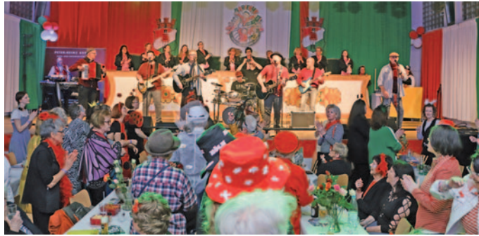
Die Inde-Singers brachten die Röher Frauen zum Singen und Tanzen.