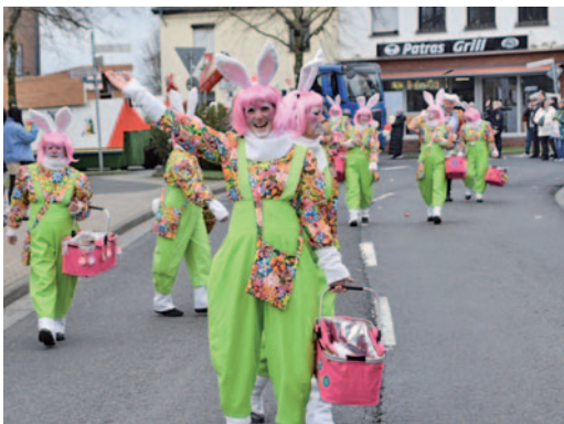
Fantasievolle Kostümgruppen gehören auch zu den Veedelszügen dazu.

Sie waren ein Vorgeschmack auf Rosenmontag und gehören einfach zum Eschweiler Fastelovend dazu. Die Veedelszüge beglückten am Sonntag die Zuschauer in den Stadtteilen Dürwiß, Hastenrath, Weisweiler und Hüheln, Nothberg, Hehlrath sowie Röhe. Das Wetter passte, die Kamelle flogen. Neben Uniformierten, Musikensembles und Tanzgruppen bereicherten fantasievolle Kostümgruppen die Umzüge. Auch das Prinzenpaar schaute in den Dörfern vorbei und fuhr beispielsweise in Nothberg mit dem nostalgischen Feuerwehr-Drehleiter-Fahrzeug mit.