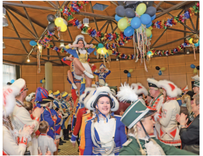
Ein buntes Bild bot die Tanzgruppe des Karnevals-Komitees bereits beim Einzug.