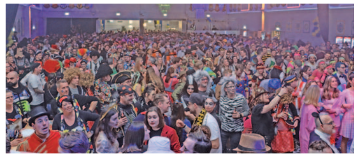
Der Scharwachball am Samstagabend in der Festhalle Dürwiß war ausverkauft.

für Erwachsene stattfanden. Durch die Bank ausverkauft waren die Bälle bei Flatten, der Scharwachball sowie die Nacht in Rot und Gelb. Und auch die Party in Blau und Weiß, das Fastelovendssamsdaachsspell, der Narrentanz und die Burghof-Nacht – auf die Beine gestellt von verschiedenen KGs – erfreuten sich großer Beliebtheit.