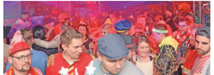
Besonders voll war es in Äu's Gasthaus Haus Lersch.