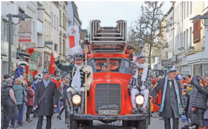
Auf einem nostalgischen Drehleiter-Fahrzeug der Feuerwehr nahm das Prinzengepaar Platz.