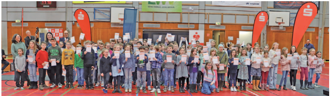
Die Kinder von KGS Kinzweiler, Barbaraschule und KGS Dürwiß bildeten den Grundschulbereich beim Sportabzeichen ab.