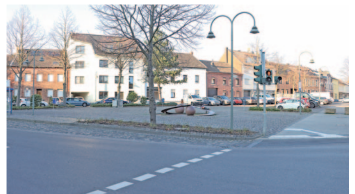
Der Platz soll klimaangepasst und nachhaltig umgestaltet werden, vor allem mit mehr Bepflanzung und Grünflächen.

Neben Kriterien der Nachhaltigkeit wie Entsiegelung, Wassermanagement, Verschattung und Erhöhung des Grünanteils standen dabei Aspekte wie die Aufenthaltsqualität und Neuordnung des Verkehrs im Fokus. Aktuell befinden sich 17 Bäume auf und rund um den Frankenplatz, dessen Grünflächenanteil bei 5,5 % liegt. Entwurf 1, der „urbane Wald“ zielt auf eine höchstmögliche Bepflanzung mit neuen Bäumen (65 Stück), bei dem sich dennoch eine kleine Lichtung auf dem Platz befindet, die durch Sonnensegel verschattet werden kann. Die Bündelung der Parkplätze in dieser Variante ist auf der Südseite vorgesehen. Der Grünflächenanteil wird hier auf 20 % beziffert. 38 % Grünfläche sind bei Entwurf 2, der „entsiegelte Platz“, möglich, sodass ein großer Anteil des Regenwassers direkt versickern kann. Die Maximalvariante der Entsiegelung beinhaltet 38 Bäume. Der „lebendige Quartiersplatz“ ist sozusagen eine Kompromisslösung (24 % Grünflächenanteil und 47 Bäume), bei der Nutzungsmöglichkeiten wie Spielgeräte stärker in den Fokus rücken. Die Parkplätze sollen hierbei an der Straße angeordnet werden, damit der Platz weitgehend vom Verkehr