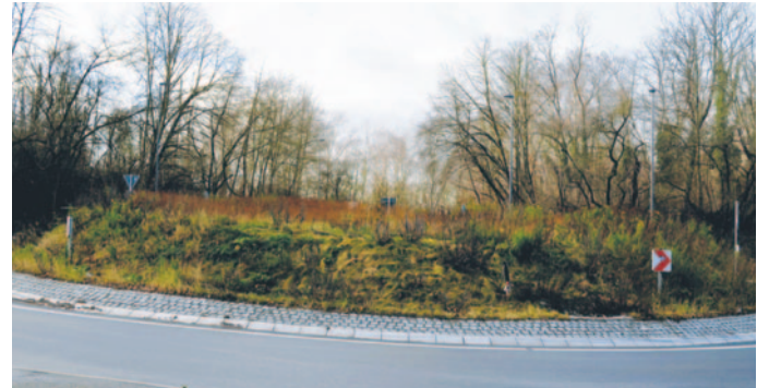
Obwohl bereits im Jahr 2021 fertiggestellt sieht der Kreisverkehr an der Südstraße immer noch ungepflegt aus.

In Zeiten leerer Stadtkassen, so finden wir, vielleicht gar nicht der schlechteste Vorschlag und wieder ein kleiner Schritt in die richtige Richtung. Inés Tiede