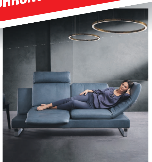
Ver. Her.: European Living Comfort sa - Herbsthalerstraße 150 - B-4700 Eupen - design www.pavonet.be

Lederland Eupen hat jeden Samstag und Sonntag von 10 bis 18:30 Uhr geöffnet.