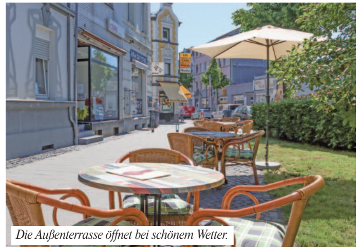
Die Außenterrasse öffnet bei schönem Wetter.