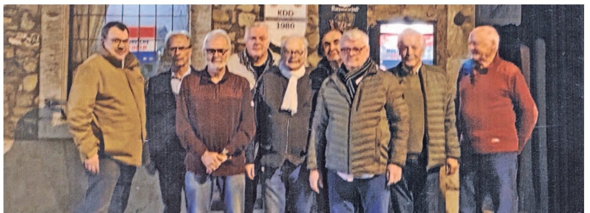
Seit Dezember nennt die 3. Korperschaft die Gaststätte „Zur Altdeutschen“ ihr neues Wachlokal.

Die 3. Korperschaft der KG Onjekauchde Eschweiler-Röhe hat ein neues Wachlokal. Im Dezember wurden die Herren mit der Gaststätte „Zur Altdeutschen“ in der Kochgasse fündig, nachdem die letzte Gaststätte in Röhe geschlossen wurde. Die 3. Korperschaft, bestehend aus 21 Personen, bezeichnet sich selbst mit einem Augenzwinkern als „Alte Herren“ (50+). Über das Jahr verteilt trifft sich die Gruppe Korperschaftsversammlungen, unternimmt Touren und führt eine Weihnachtsfeier durch. Zudem stehen zweifelsohne die Pflege des karnevalistischen Brauchtums und die Unterstützung der KG Onjekauchde im Fokus.