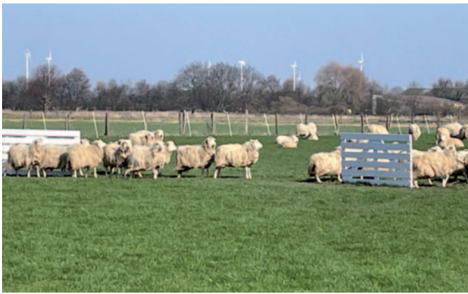
Die angelieferten Schafe sind schon in Dürwiß und betrachten eines der Tore, durch das sie bei der EM der Hütehunde getrieben werden.

Um was geht es? Auf einem großen Feld läuft der Hund im großen Bogen zu vier Schafen. Geradlinig und in ruhigem, flüssigen Tempo soll der Hund die Schafe zum Hundeführer bringen, anschließend verschiedene Tore mit ihren passieren und dann eine Aufgabe erfüllen, etwa die Aufteilung der Schafe in zwei Gruppen oder das Treiben in ein markiertes Gehege. Für die anspruchsvollen Aufgaben sind neun Minuten Zeit. Beim Führen der Schafe durch den Parcours reagiert der Border Collie auf Pfeif- und Ruffkommandos des Hundeführers. Kampfrichter beobachten vor allem am Lauf der Schafe, wie gut der Hundeführer und sein Hund die Aufgaben lösen, denn die Schafe sollen nicht gestresst werden. Wenn ein Hund gar ein Schaf zwicken oder festhalten sollte, wird er disqualifiziert. Durch die Punkte der Kampfrichter ergeben sich die Platzierungen. Die besten sieben Hund-Mensch-Teams ziehen ins Finale ein. Wann finden die Wettkämpfe statt? Von Freitag bis Sonntag, jeweils von 7:30 Uhr bis 17 Uhr. Auf drei Feldern starten täglich 50 Teams. An den drei Wettkampftagen sind die Teams täglich auf einem anderen Feld im Einsatz. Besonderheit: Bei den Vorläufen kommen die Schafe aus Gangel. Im Finale am Sonntag ab 16 Uhr treten Schafe aus Dürwiß in Aktion. Woher kommen die Teilnehmer?