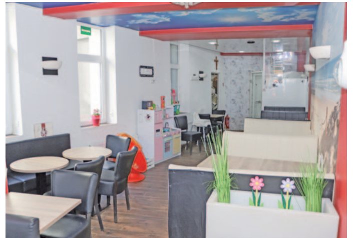
Der Innenbereich lockt mit einer kinderfreundlichen Ecke für die jungen Gäste.

Der Schein trügt, denn im Café in der Marienstraße 72 ist mehr Platz, als es von außen den Eindruck erweckt. In gemütlicher Atmosphäre können Gäste nicht nur auf der Außenterrasse, die bei gutem Wetter öffnet, die vielfältigen Eiskreationen genießen. Auch im Innenbereich wird viel Platz geboten und zusätzlich dazu eine kinderfreundliche Ecke mit Spielmöglichkeiten für die kleinen Gäste. Eiscafé Marino hat täglich von 10:00 bis mindestens 20:00 Uhr und sonntags ab 11:00 Uhr geöffnet.