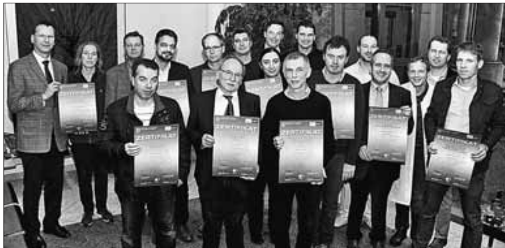
Im Qualitätszirkel erfolgte die Übergabe der Urkunden für die erfolgreiche Rezertifizierung des Netzwerkes.

Hierzu führt das St.-Antonius-Hospital regelmäßig mit der Feuerwehr Eschweiler Rettungsübungen durch, in denen der Ernstfall vom Unfallereignis über die Rettung bis hin zur Übergabe im Schockraum des Krankenhaus mit der ersten Untersuchung und der Festlegung der weiteren Therapie von verschiedenen Teams geprobt werden kann. Eine solche Übung findet erneut am 21. März auf dem Gelände der Feuerwehr und Rettungswache statt.