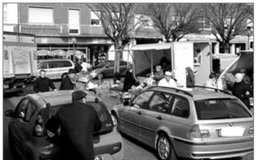
Auto-Markt: Ginge es nach den Grünen, dann würden die Blechkarossen komplett von Eschweilers schönstem Platz verbannt.

Vielmehr solle Eschweiler endlich eine nachhal-