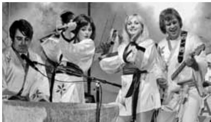
„ABBA Review“ begeisterten die Fans bereits beim EMF 2013 auf dem Eschweiler Marktplatz.

hat, die energiegeladene Show von „ABBA Review“ wieder auf die Bühne. Bei ihrer Show ist es so, als stünden Agnetha, Björn, Benny und Frida tatsächlich wieder auf der Bühne. Eine natürliche Ausstrahlung, echte Frisuren und professionelle Musiker geben der Show von „ABBA Review“ das gewisse Extra. Ein Tipp: Schnell Tickets sichern, da die Kapazität begrenzt ist! Karten gibt es im RIO, den bekanntesten Vorverkaufsstellen und unter der Hotline 0151-64030959. Einlass ist ab 18 Uhr, Beginn um 19 Uhr.