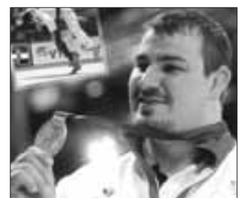
Judoka Andreas Tölzer begeisterte sein Publikum durch seine bodenständige und souveräne Art und gab darüber hinaus fleißig Autogramme.