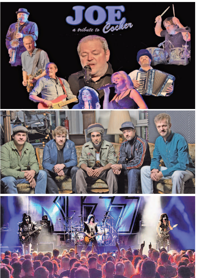
Joe Cocker, Bob Marley und Kiss: Diese Weltkünstler werden durch die Tribute-Gruppen am kommenden Wochenende in Stolberg gefeiert.