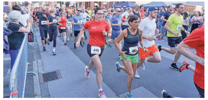
Auch in diesem Jahr findet das Kult-Sportevent in Dürwiß wieder statt.

Am Samstag, dem 5. August, findet zum 38. Mal der vom SV Germania Dürwiß organisierte und von der Filmpost präsentierte Volks- und Straßenlauf „Die 10 Kilometer von Dürwiß“ statt. Zahlreiche Läufer und viele Inliner werden zu der Kulturveranstaltung im Dürwißer Ortskern erwartet. Bedingt durch die Baumaßnahmen in Dürwiß findet der Lauf wie im Vorjahr auf einer leicht veränderten Strecke mit 1,2 Kilometer langen Runden statt.