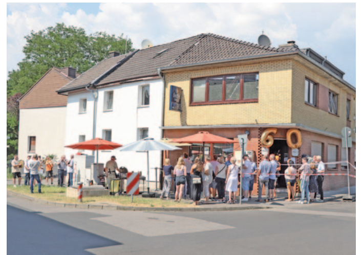
Der Platz vor der Gaststätte wurde ebenfalls für die Jubiläumsfeier genutzt.

Silvia und Andreas nahmen nun den runden Geburtstag zum Anlass, eine Jubiläumsfeier steigen zu lassen. Am vergangenen Samstag startete nachmittags das gesellige Treiben nicht nur in der Gaststätte, sondern dank der sommerlichen Verhältnisse auch auf dem Bürgersteig. Einige Getränke und Grillwürste waren verzehrt sowie Geschenke von Freunden überreicht, ehe ein