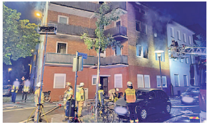
Im ersten Obergeschoss des Gebäudes entstand sich das Feuer.