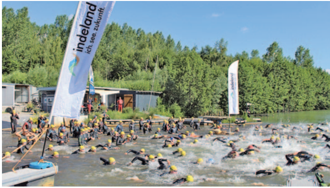
Die 2.100 Athleten starten am Sonntag im Blausteinsee.

Schwimmen, Radfahren, Laufen. Seit dem Debüt im Jahr 2007 entwickelte sich der Indeland-Triathlon zu einer überregional bedeutenden Sportveranstaltung. Am Sonntag bei der 16. Auflage wird erstmals auch eine Deutsche Meisterschaft ausgetragen. Auf der Mitteldistanz werden nach 1,9 Kilometern Schwimmen im Blausteinsee, 88 km Radfahren rund um den Tagebau Inden und 20 km Laufen in Aldenhoven die Deutschen Meisterinnen und Deutschen Meister in der Gesamtwertung sowie in den einzelnen Altersklassen gekürt. Zum ersten Mal geht's auf Eschweiler Boden um die nationale Triathlon-Ehre!