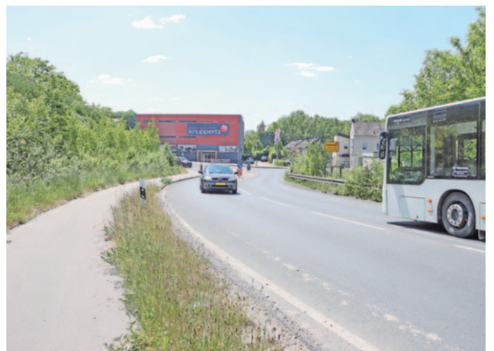
Der 2. Bauabschnitt der L238 n wurde 2013 eröffnet und endet am Möbelhaus Knuppertz.