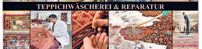
TEPPICHWÄSCHEREI & REPARATUR