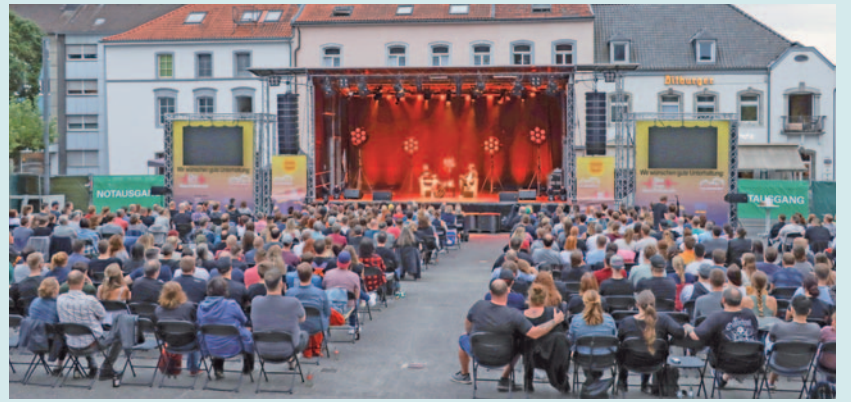
Der Tribüleneffekt wird wie 2022 beibehalten: Im August steigt wieder das Sommer Spezial auf dem Marktplatz.

Alle Informationen findet man auch unter www.talbahnhof.de .