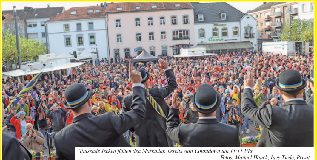
Tausende Jecken füllen den Marktplatz bereits zum Countdown um 11:11 Uhr.