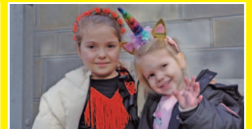
Junge Karnevalsherzen schlugen am Elften im Elften ebenfalls höher.