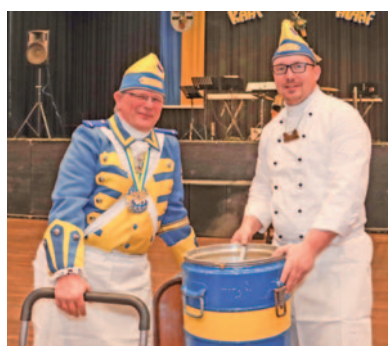
Auch in Dürwiß gehörte die Erbsensuppe zum Sessionsstart dazu.