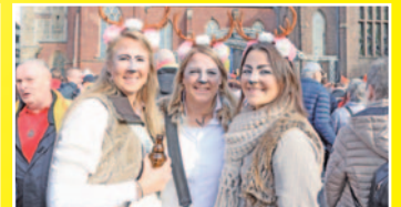
Nicht nur diese Drei griffen zu Kostüm und Schminke, um kunterbunt zu feiern.