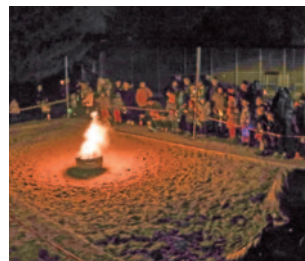
Auf dem Außengelände des Kindergartens St. Barbara (pro futura) wurde ein Martinsfeuer gezündet.