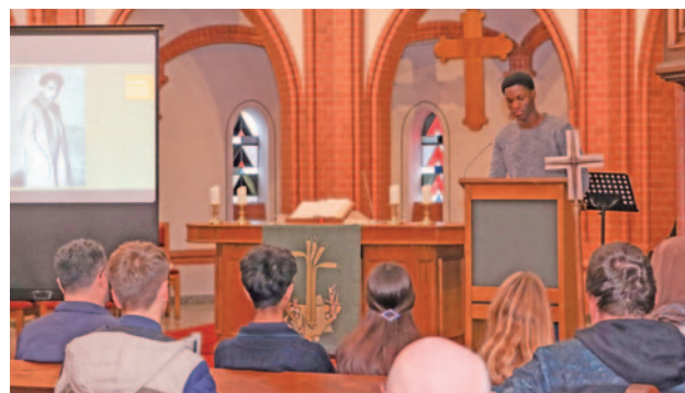
Oberstufenschüler des Städtischen Gymnasiums brachten ihre Gedanken zum NS-Terror und Niedertracht in der heutigen Zeit zum Ausdruck.