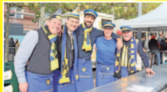
Verschiedene Karnevalsvereine wie hier die Scharwache leisteten organisatorische Unterstützung.