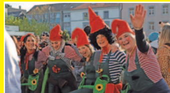
Lustige Zwerge genossen Musik und Tanz.