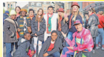
Ghana feiert mit: Die Austauschgruppe der Realschule Eschweiler aus Keta erlebte auch den kulturellen Höhepunkt.