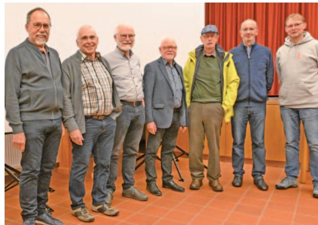
Rund 70 begeisterte Gäste hinterließ die 26. Diaporamaschau der Film- und Fotofreunde Eschweiler.