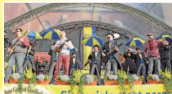
Die Inde-Singers waren erstes musikalisches Highlight.

Viele weitere Bilder vom Elften im Elften finden Sie online unter filmpost.de