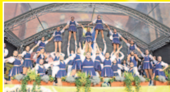
Das Tanzcorps Höppe Kroetsch war Wiederholungstäter, ebenfalls auf der Bühne stand die Tanzgarde der Efelkank.