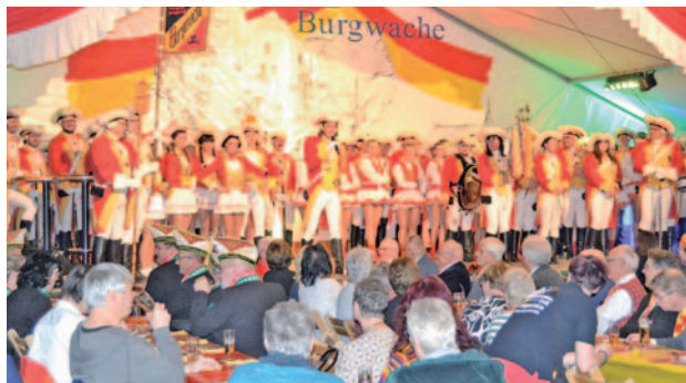
Nothberg feierte, als hätte es eine Pause nie gegeben.