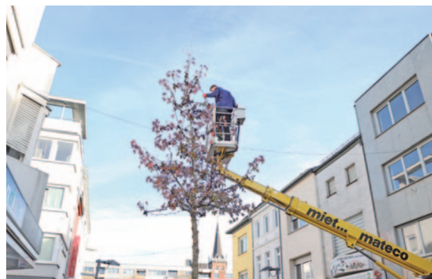
Am Samstagvormittag wurden die ersten Lichterketten in den Bäumen der Neustraße angebracht.