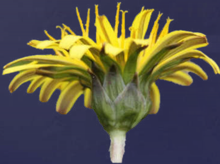
anliegend, mit Hautrand