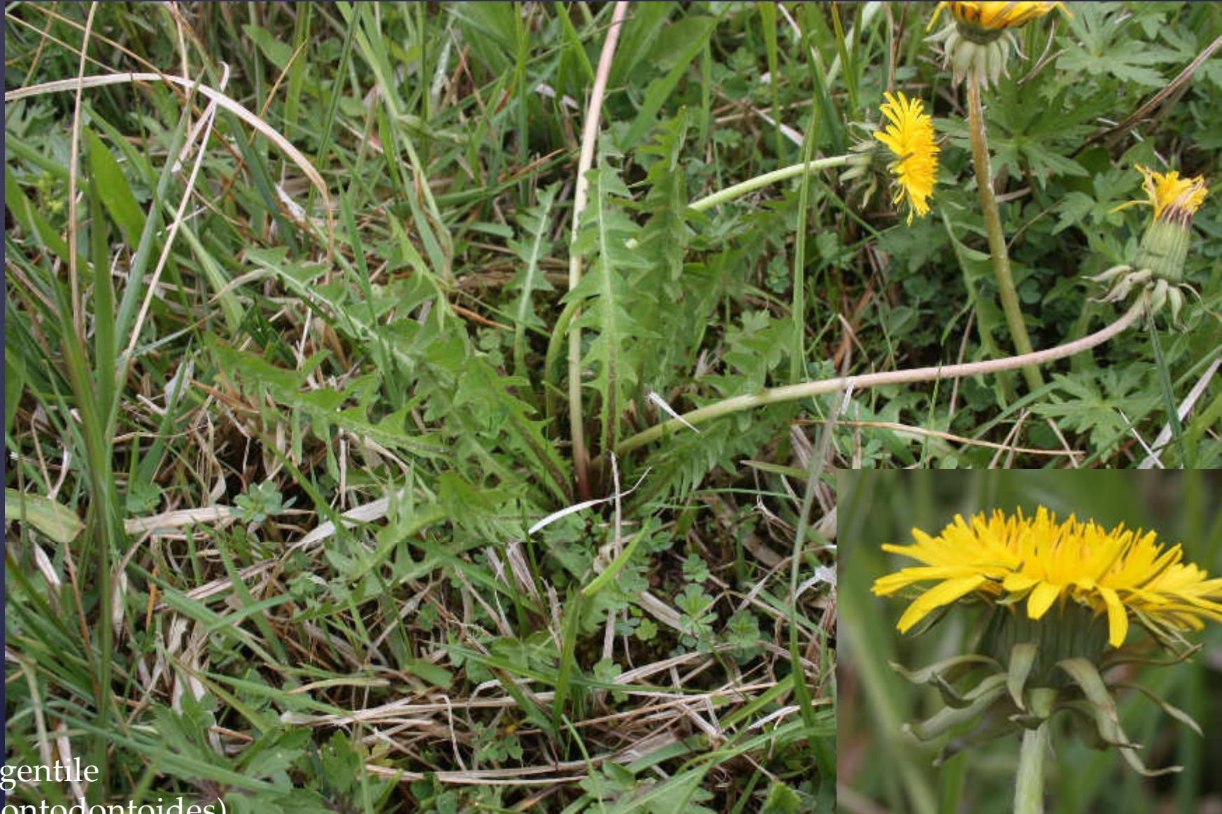
T. gentile (leontodontoides)