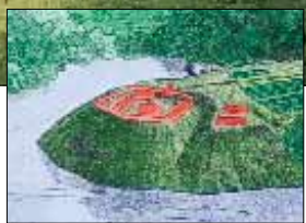
Rekonstruktion af voldstedet med bygninger