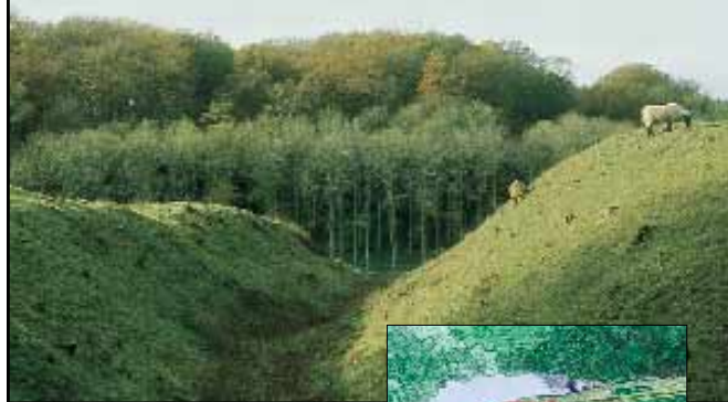
Græssende får på voldstedet