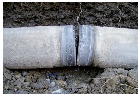
Abwinkelung bis 6° möglich

Die Marktgemeinde Steinakirchen am Forst hatte seit einigen Wochen Wasserverluste im Rohrnetz festgestellt. Nach erfolgreicher Leckortung wurde die Schadenstelle ermittelt. Bei dem Rohrbruch handelte es sich um ein AZ - Rohr DN 100 mit schadhafter Muffe. Der Rohrbruch ist durch Setzungen im Erdreich entstanden.