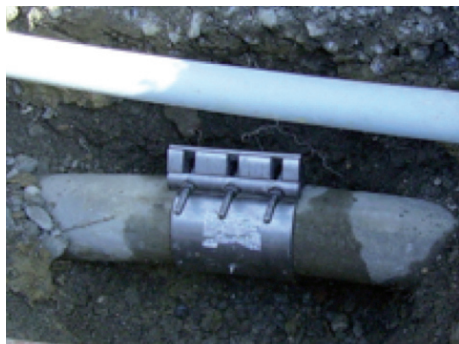
Schnelle und sichere Behebung