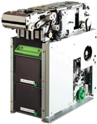
F56 El dispensador de billetes

Alto Rendimiento Múltiple Casete Dispensador