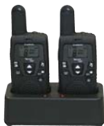
Doppel-Standlader 230 V