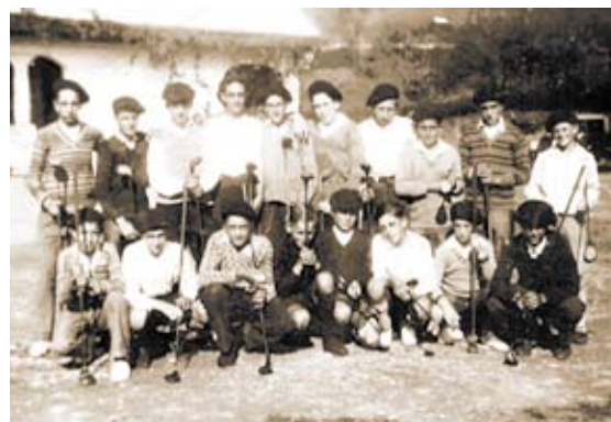
En la foto de la derecha, campeonato de caddies de 1927.

por norma general los caddies encontraban muchas dificultades para poder practicar en el propio campo. Eso no impidió que la mayoría de ellos se convirtieran con posterioridad en reputados profesores e incluso llegaran, con éxito, al campo profesional. De hecho, aquellos jóvenes, lasartearras en su mayoría, de hace muchas décadas fueron los maestros posteriores en la mayoría de campos y clubes del País Vasco.