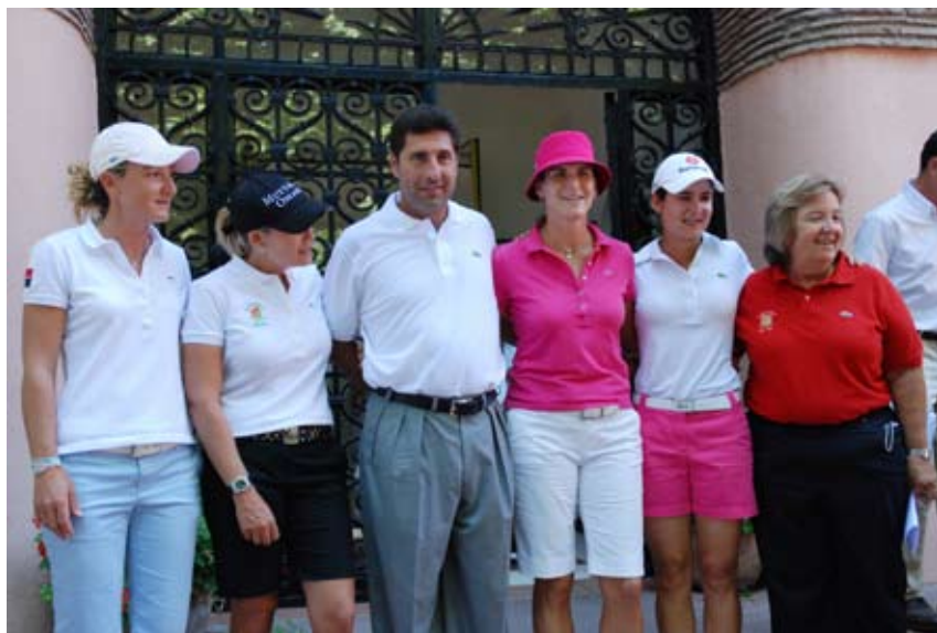
Gwladys Nocera, Cristie Kerr, José María Olazábal, Patricia Meunier-Lebouc, Lorena Ochoa y Catherine Lacoste.