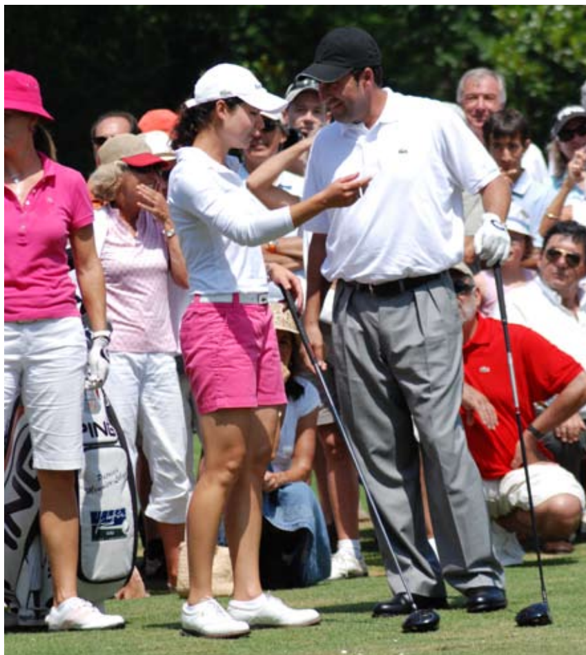
Lorena Ochoa y José María Olazábal bromearon durante la exhibición benéfica en Chantaco.

¿Se hacen amigos en el circuito de la LPGA o es demasiado competitivo para hacer amistades?