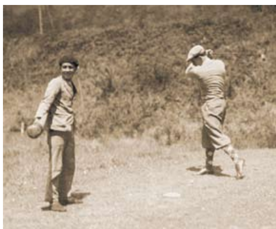
1926, Paulino Uzcudun, campeón de Europa en peso pesado y el caddie Jacinto Martín.