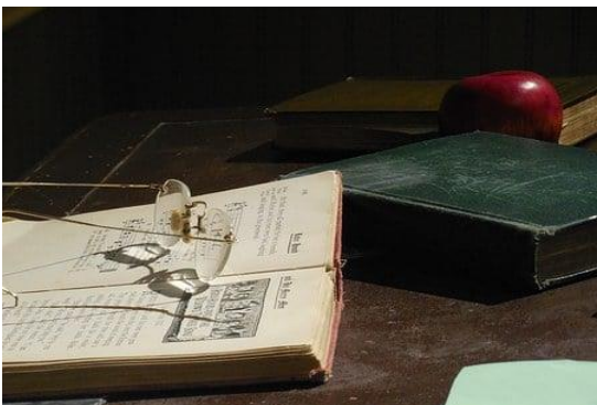
Facharbeit Schuljahr 2021/2022