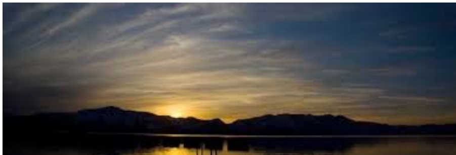
Ilunabarra Mississippi ibaian