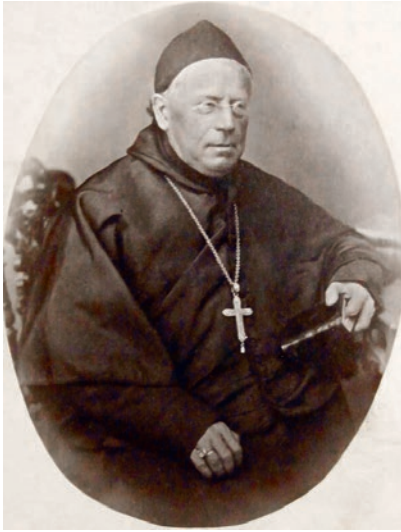
Abb. 2: Abt Adalbert Regli (1800–1881), von Andermatt, stand dem Kloster von 1838 bis zu seinem Tod vor und verschaffte dem aus Muri vertriebenen Konvent eine neue Heimat in Sarnen und Gries im Südtirol. Während seiner Amtszeit erstarkte der durch das Novizenverbot dezimierte Konvent wieder.

Bei der unglücklichen Muri Klosteraufhebung im Jänner 1841 schmerzte die Conventualen beinahe am meisten das Auseinandergehen! Da sie an das religiöse Zusammenleben (S. 2) von Jugend auf gewöhnt und einander herzlich zugehan waren. Jeder äusserte darüber unsägliches Leid und alle ersuchten den Abt, wo möglich einen Ort der corporativen Wiedervereinigung ausfindig zu machen. Am 27. Jänner hatte die Mehrzahl der H.H. Conventualen das Kloster zu verlassen. Die Szene des Austritts war schmerzlich! Es erschienen bei den Klosterporten mit einer Menge Wägen Verwandte u. Bestellte, welche Tische u. Stühle, Bett u. Kleider, Bücher u. Geräthe eines jeden Konventualen unter umstehendem Militär verluden und innert weniger anberaumten Stunden fortzuführen hatten. Der Wirrwar mag gedacht, statt beschrieben werden! Die Klosterfeinde, freilich meist nur auswärtige, triumphierten und spotteten, die Conventualen mit dem guten zuschauenden Volke weinten u. schluchzten u. zogen einer nach dem andern unter wildem Schneegestöber weg in alle Richtungen u. an verschiedenste Orte sich zerstreud! Der Abt mit seinen Oeconomie-Angestellten hatte noch bis zum 3ten februar zu bleiben, u. Rechnung oder deren Belege, Bücher u. Schriften abzugeben, auch ein politisches Verhör zu bestehen, u. dann auch fortzugehen. Er übergieng in den nahen Kanton Zug, wo schon einige andere Conventualen sich verstreut aufhielten, miethete