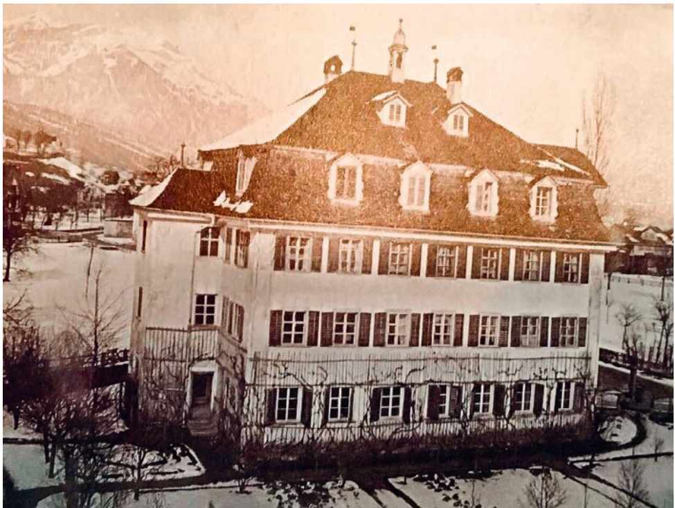
Abb. 14: Altes Kollegium Sarnen im 19. Jahrhundert.