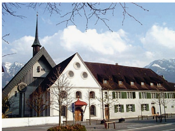
Abb. 21: Benediktinerinnenkloster St. Andreas wurde ursprünglich als Doppelkloster in Engelberg gegründet und 1615 nach Sarnen verlegt. Sie Schwestern brachten die als wundertätig bezeichnete Figur des «Sarner Jesuskindes» mit, welche im 14. Jahrhundert geschaffen wurde.