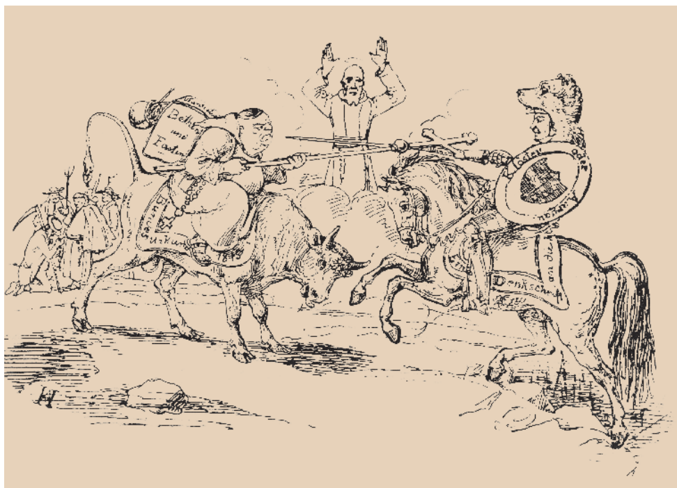
«Aargau und die Klöster». Der liberal-radikal regierte Kanton Aargau kämpft mit der Unterstützung Berns hoch zu Ross für die Beibehaltung des Aufhebungsbeschlusses. Auf der Gegenseite stellt sich der Mönch auf dem Stier sitzend stellvertretend für die konservative Seite dem Gefecht um Wiedereinsetzung der Klöster. Karikatur aus dem «Gukkasten» 1841.