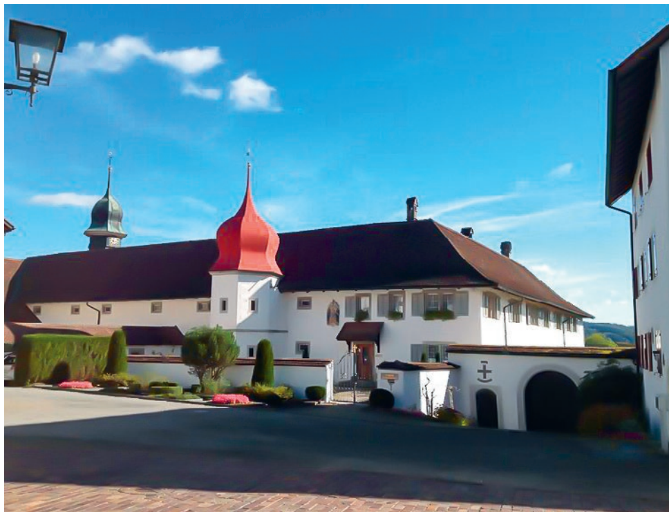
Abb. 5: Benediktinerinnenabtei Hermetschwil.