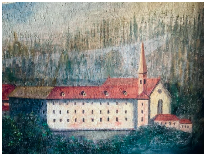
Abb. 17: Das Benediktinerinnenkloster St. Martin in Hermetschwil, Darstellung im Schweizerzimmer im Kloster Muri-Gries.

Über die Angelegenheit von Gries verhandelte man ganz im Stillen fort. Zur Zeit, als das Anerbieten von Oesterreich gemacht worden, standen die Aarg. Klöster, oder Muri u. Wettingen, im Vordergrund, oder waren Hauptgegenstand, um den sich die gute (S. 33) katholische Parthei in der Schweiz gegenüber den Bundesbrüchigen wehrte. Die Jesuitensache hatte noch nicht anfangen u. mit den Thurgauer Klöstern war es wenigstens noch nicht so weit gekommen. Wäre neu bekannt geworden, dass das Muriconvent anderswo unterkommen finden könne, so hätte das das Bemühen der Guten gelähmt u. der Andern erleichtert, oder Aargau hätte auch das Projekt durch vorläufige Pensionsentziehung für Auswanderer erschweren können, was später nach geschehener Auswanderung wieder thunlich erscheinen mochte. Die Sistirung der Pension geschah zwar dort noch, wurde aber wohl nur aus Rücksicht für Oesterreich wieder aufgehoben. Der Abt schrieb seinen Inspektionsreise an sein zerstreutes Convent in so weit es ohne Aufsehen zu erregen geschehen konnte u. als er die nöthige Zustimmung erhalten hatte, an den hl. Stuhl u. dann nach Wien, dem hl. Vater die Sachlage darlegend u. um kirchliche Entscheidung bitend, u. dem Hof in Wien das huldvollste Anerbieten verdankend u. nähere Bitten u. Anfragen unterbreitend! S. H. Papst Gregor XVI. ertheilte zuerst nur