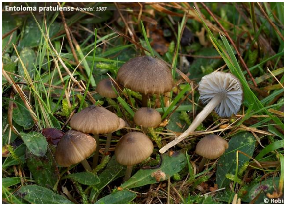
Slåtterraudskivesopp, Entoloma pratulense (VU)