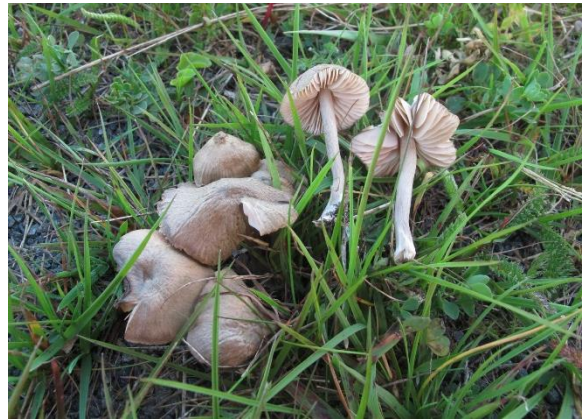
Lillagrå raudskivesopp, Entoloma griseocyaneum (VU)