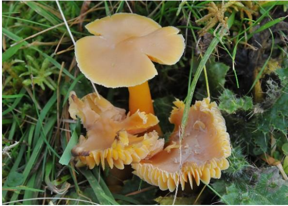
Raudskivevokssopp, Hygrocybe quieta (NT) Per Fadnes, artsobservasjoner.no