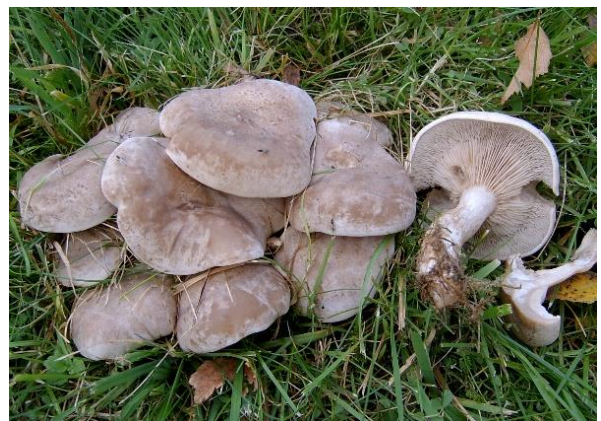
Engriddarhatt, Lepista luscina (NT)