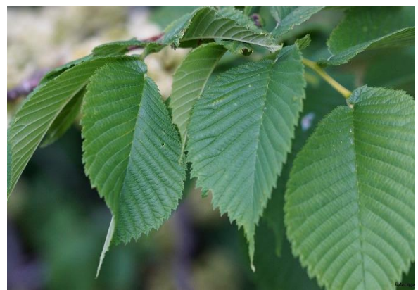
Alm, Ulmus glabra (NT)