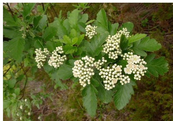
Småasal, Sorbus subarranensis (NT) Dag Holtan, artsobservasjoner.no