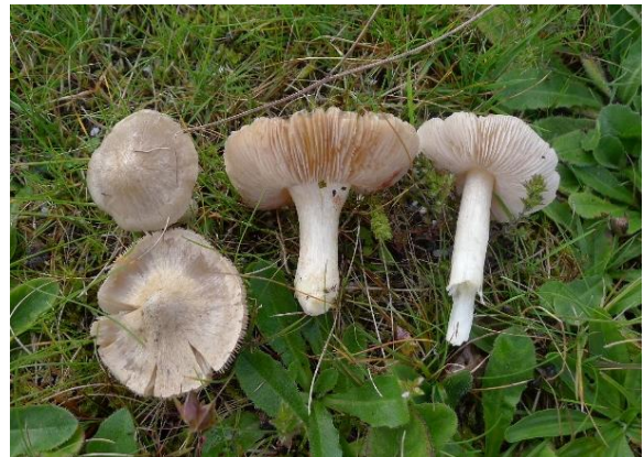
Melraudskivesopp, Entoloma prunuloides (NT)