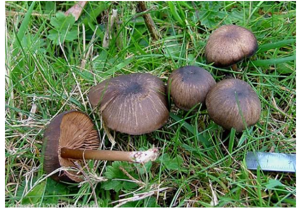
Tyrkarraudskivesopp, Entoloma turci (NT) Daniel Reaudin, mycobd.fr