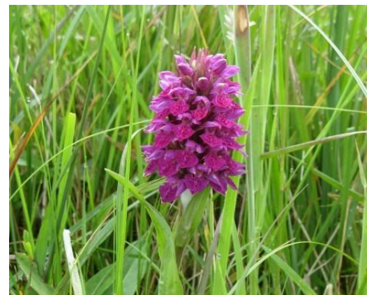
Purpurmarihand, Dactylorhiza purpurella (VU)