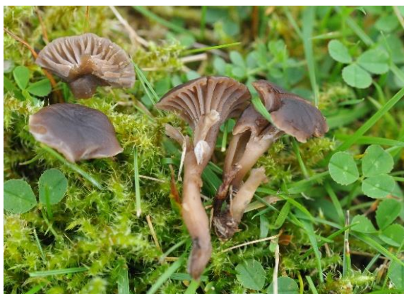
Stanknarrevokssopp, Camarophyllopsis foetens (VU)