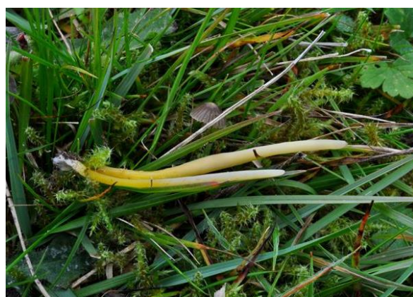
Halmgul køllesopp, Clavaria flavipes (VU)