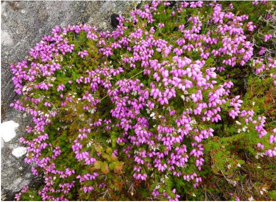
Purpurlyng, Erica cinerea (NT)