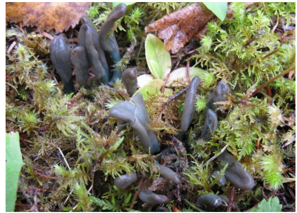
Olivenjordtunge, Microglossum olivaceum (V) Jostein Lorås, artsobservasjoner.no