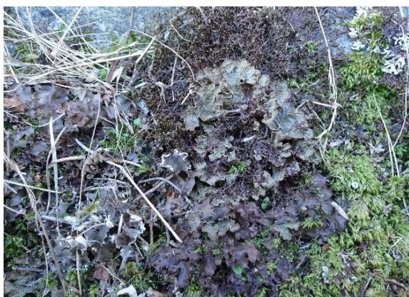
Gullprikklav, Pseudocyphellaria crocata (VU)