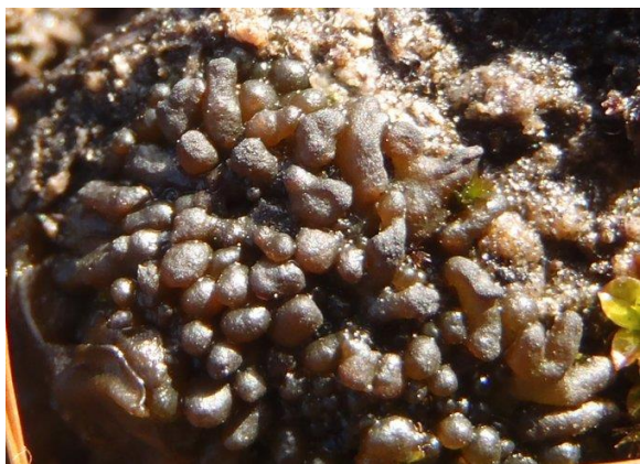
Lempholium radiatum (VU)