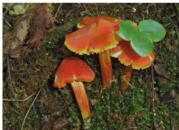
Flammevokssopp, Hygrocybe intermedia (VU)