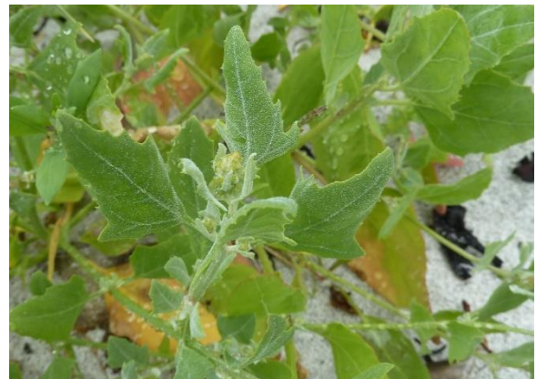
Fjordmelde, Atriplex longipes (EN) Terje Spolen Nilsen, artsobservasjoner.no