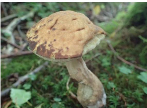
Hasselskrubb, Leccinum pseudoscabrum (R) Andreas Svensen, artsobservasjoner.no