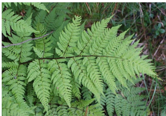
Bruntelg, Dryopteris expansa willeana (VU)