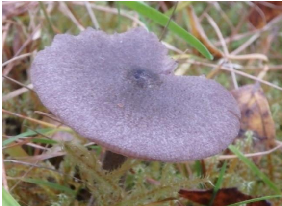
Semsk raudskivesopp, Entoloma jubatum (NT)