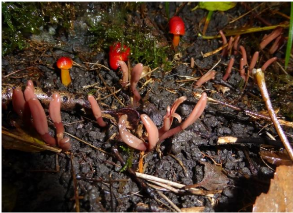
Kobbertunge, Microglossum fuscorubens (VU)