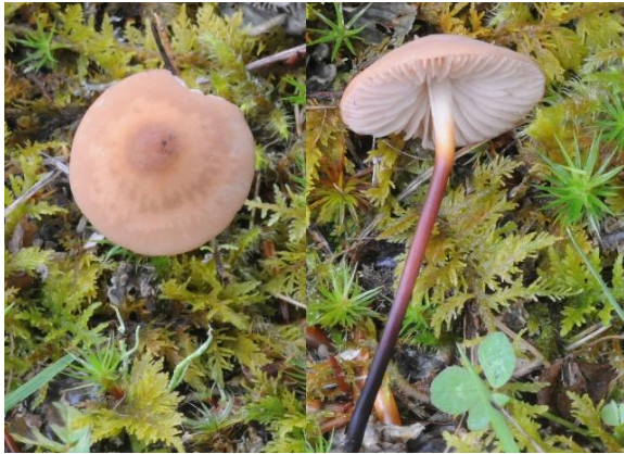
Børsteseigsopp, Marasmius cohaerens