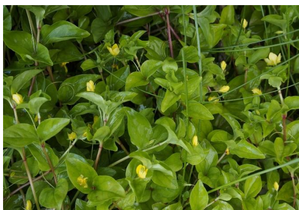
Skogfredløs, Lysimachia nemorum (NT)