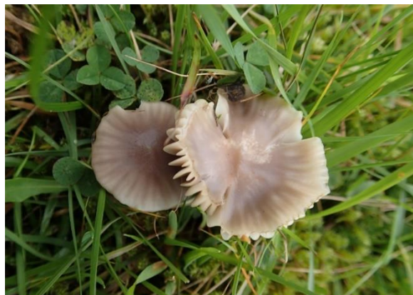
Gulfotvokssopp, Hygrocybe flavipes (NT) Andreas Svensen, artsobservasjoner.no