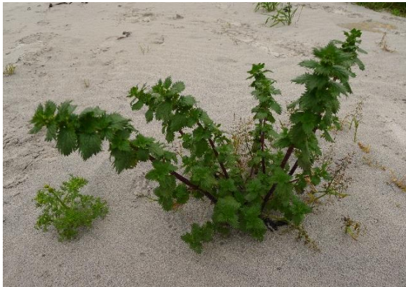
Smånesle, Urtica urens (VU)