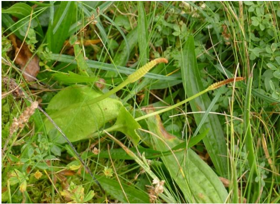
Ormetunge, Ophioglossum vulgatum (VU)