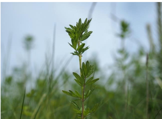
Rankfrøstjerne, Thalictrum simplex (NT)