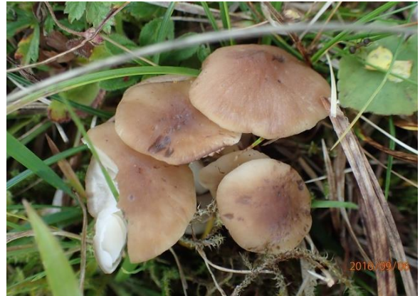
Brun engvokssopp, Hygrocybe colemanniana (VU)