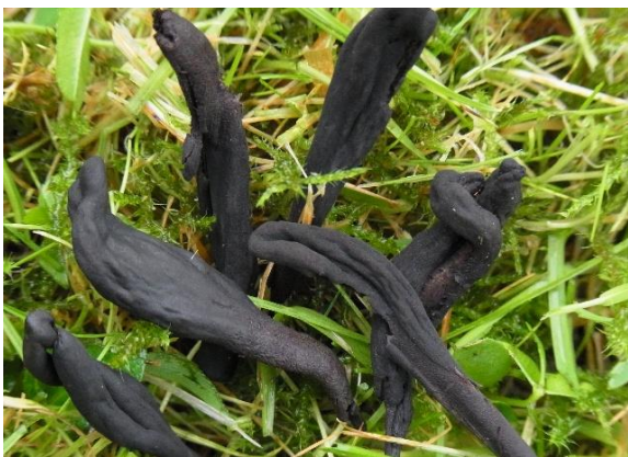
Dynejordtunge, Geoglossum cookeanum (NT)