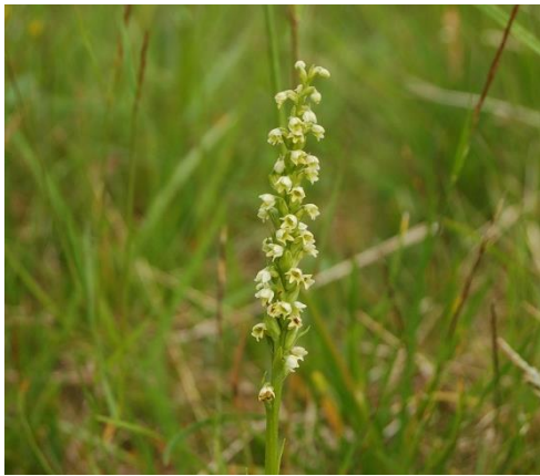
Kvitkurle, Pseudorchis albida ssp. Albida (DC)