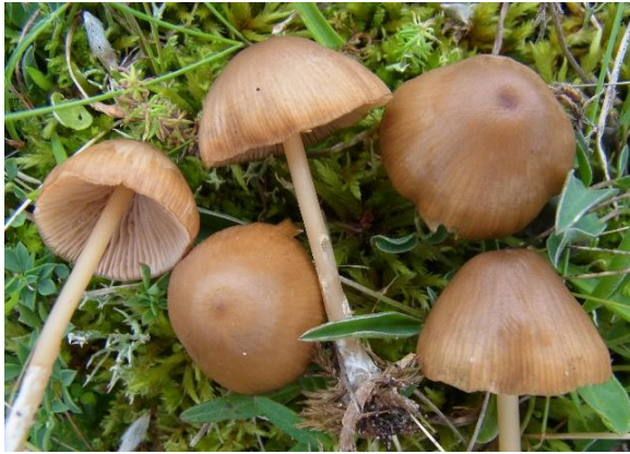
Bronseraud skivesopp, Entoloma formosum