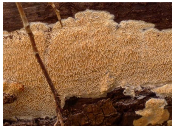
Ospekjuke, Ceriporiopsis aneirina (DC) Dag Holtan, artsobservasjoner.no