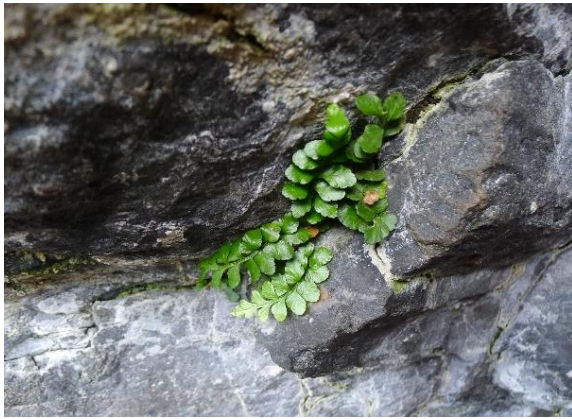
Havburkne, Aplenum marinum (NT)