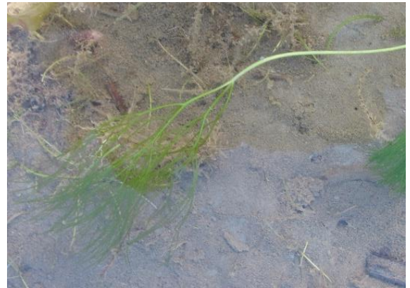
Busttjernaks, Stuckenia pectinata (NT)