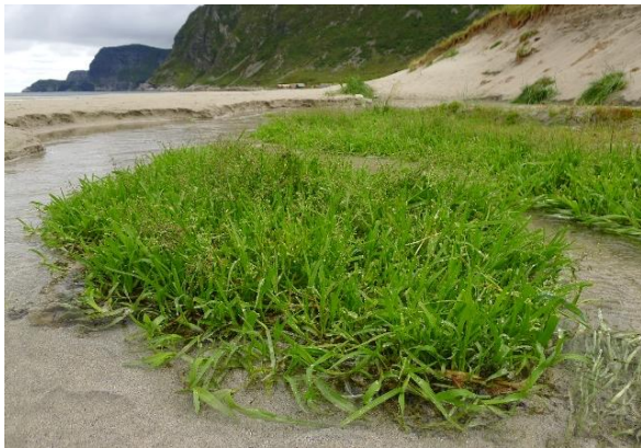
Kjeldegras, Catabrosa aquatica (NT)