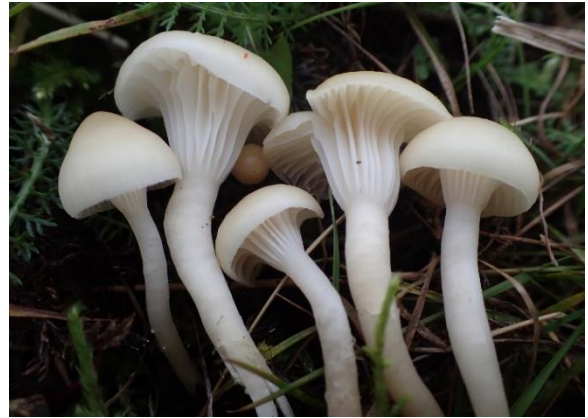
Russelærvokssopp, Hygrocybe russocoriacea (NT)