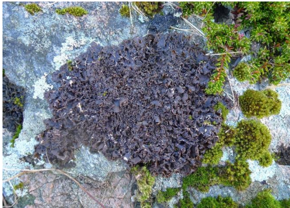
Kalkgrye, Blennothalia crispa (EN) Dag Holtan, artsobservasjoner.no