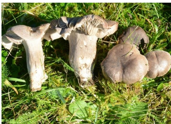
Grå narremusserong, Porpoloma metapodium (EN)