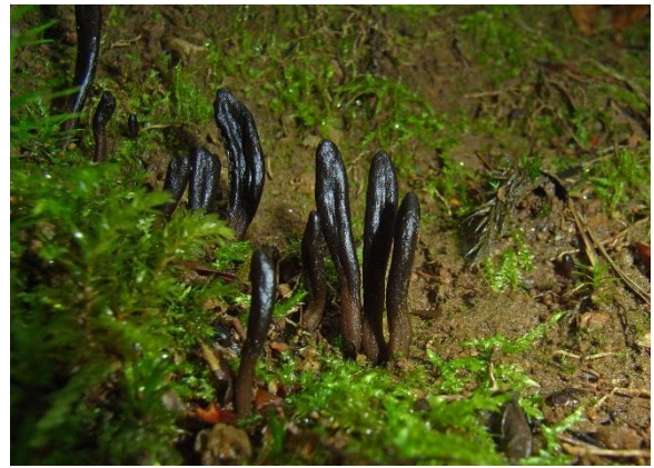
Brunsvart jordtunge, Geoglossum umbratile (DC) Inger-Lise Fonneland, artsobservasjoner.no