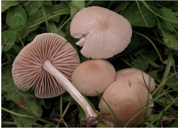
Fagerrødspore, Entoloma queletii (NT)