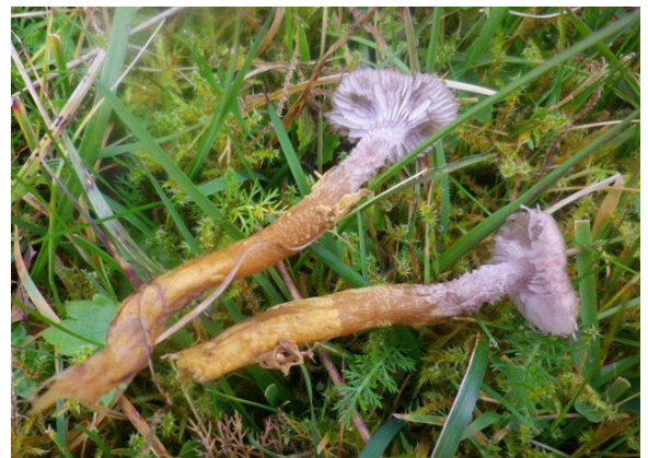
Grynknollslirehatt, Squamanita paradoxa , (EN) Heidi Støen, artsobservasjoner.no