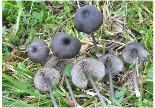
Svartblå raudskivesopp, Entoloma chalybaeum (NT)