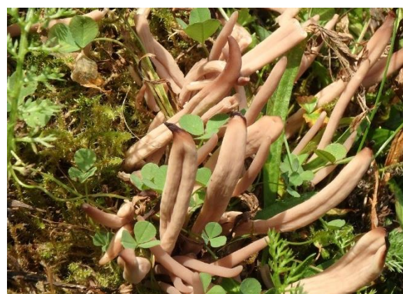
Røykkøllesopp, Clavaria fumosa (NT)