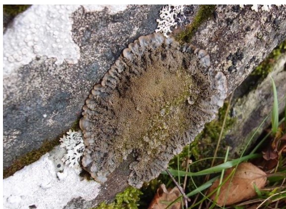
Kystblåfiltlav, Pectenia atlantica (VU)