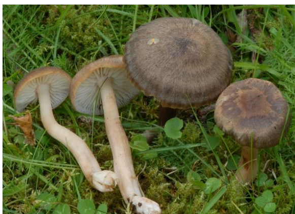
Raudnande lutvokssopp, Hygrocybe ingrata (VU) Åge Oterhals, artsobservasjoner.no