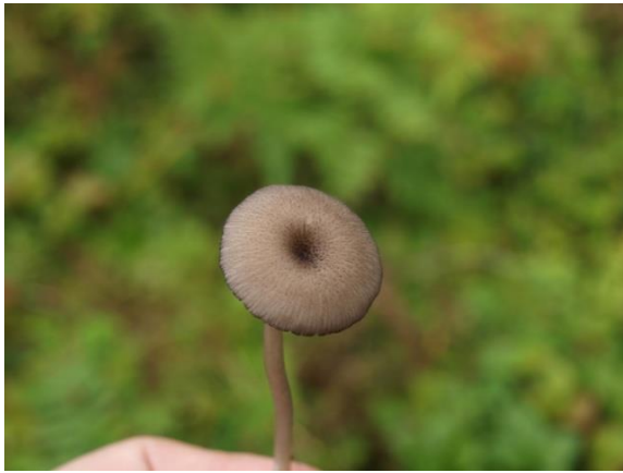
Blårandrødspore, Entoloma caesiocinctum (DC) Edel Humstad, artsobservasjoner.no