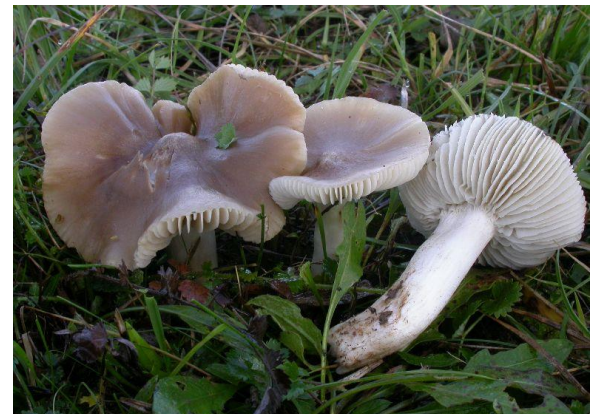
Musserongvokssopp, Hygrocybe formicata (NT)