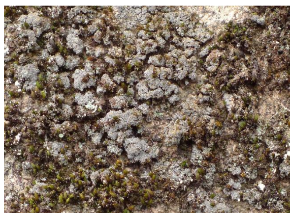
Olivenfiltlav, Fuscopannaria mediterranea (NT)