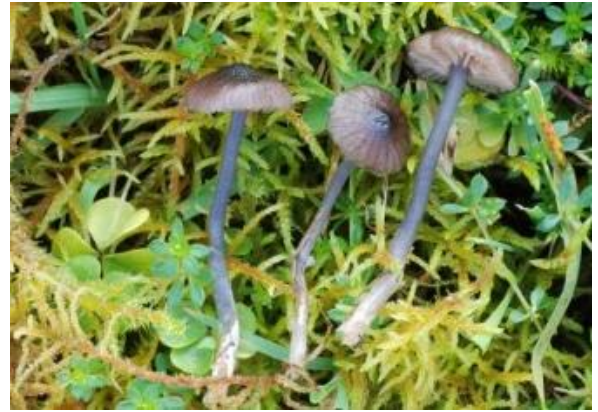
Glasblå raudskivesopp, Entoloma caeruleopolitum (VU) J.B. Jordal, jbjordal.no