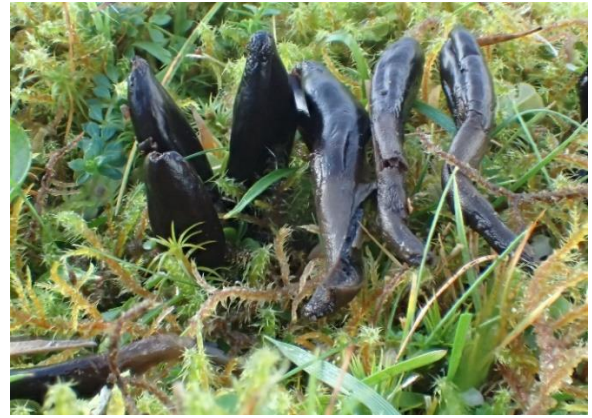
Vrangjordtunge, Microglossum atropurpureum (VU) Per Fadnes, artsobservasjoner.no