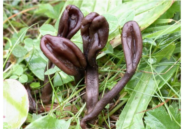
Vrangtunge, Geoglossum atropurpureum (DC) Jean-Pierre Dechaume, mycobd.fr