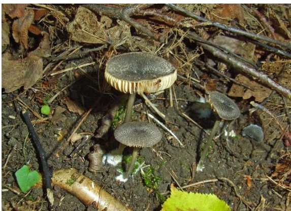
Ramneraudskivesopp, Entoloma corvinum (NT) Inger-Lise Fonneland, artsobservasjoner.no