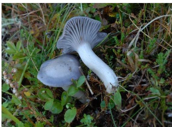
Skifervokssopp, Hygrocybe lacmus (NT) Åge Oterhals, artsobservasjoner.no