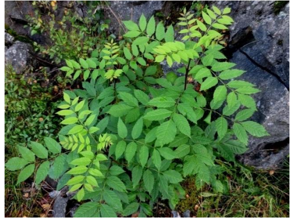
Ask, Fraxinus exelsior (NT)