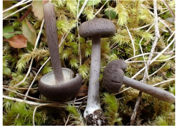
Fiolett raudskivesopp, Entoloma mougeotii (NT)