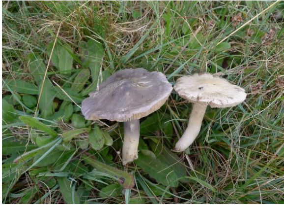
Praktraud skivesopp, Entoloma bloxamii (VU)