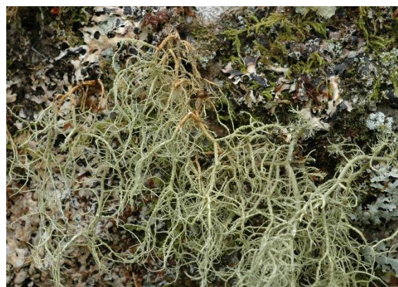
Ringstry, Usnea flammea (NT)