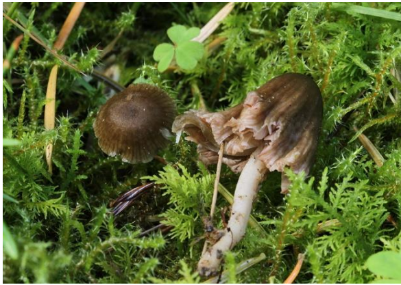
Entoloma velenovski (VU) Rodén Skov, danskesvampe.dk