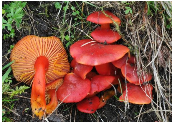
Raud honningvokssopp, Hygrocybe splendidissima (VU) Per Fadnes, artsobservasjoner.no