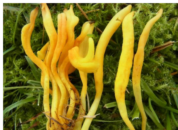
Knippesmåfingersopp, Clavulinopsis fusiformis (VU)