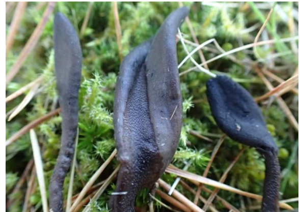
Skjeljordtunge, Geoglossum fallax (DC)