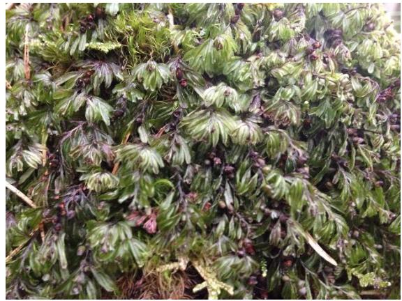
Hinnebregne, Hymenophyllum wilsonii (V)