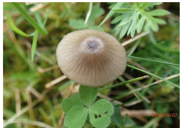
Flammefotrødspore, Entoloma exile (DC)