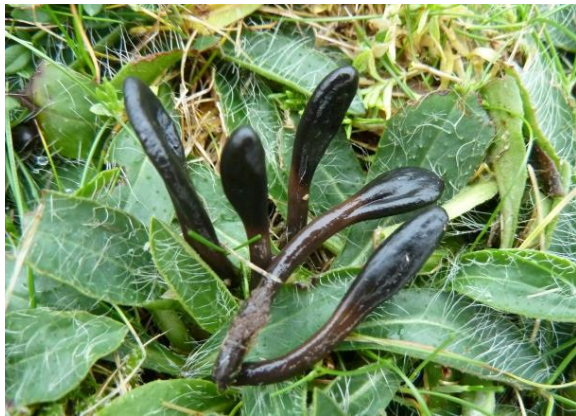
Sleipjordtunge, Geoglossum glutinosum (DC) Inger Kristoffersen, artsobservasjoner.no