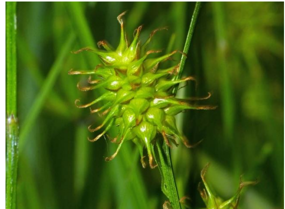
Nebbstorr, Carex lepidocarpa Einar Værnes, artsobservasjoner.no