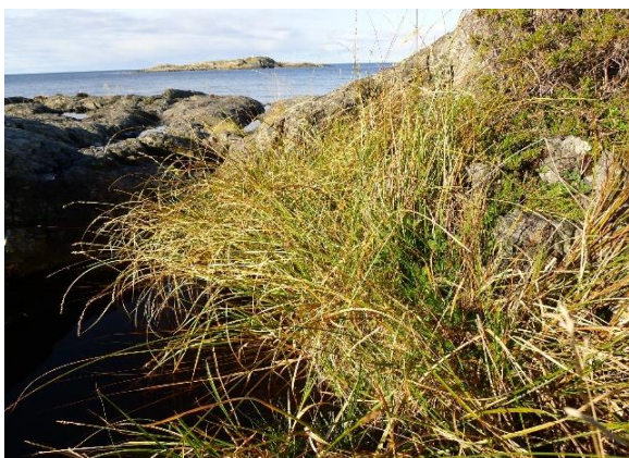
Toppstorr, Carex paniculata (VU)