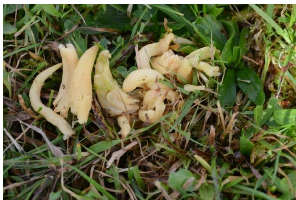
Vridd køllesopp, Clavaria amoenoides (VU)