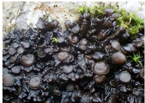
Tannjordgrye, Echylium bachmanianum (NT)