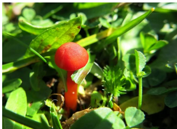
Bittervokssopp, Hygrocybe mucronella (NT)